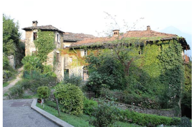
Huizen in Motto