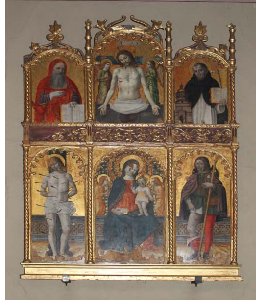
Rechts: veelluik van Bergognone in de kerk van S. Michael in Vignola