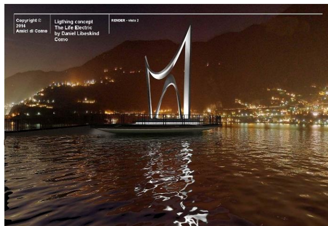
Afbeelding van het monument “The Life Electric” van Libeskind

Misschien heeft u deze zomer al gemerkt en zo niet dan vestig ik er nadrukkelijk de aandacht op. Het gaat hier om de invoering van gebieden waar u als toerist niet meer met de auto mag komen, de zgn. ZTL (Zone a traffico limitato). Het omvat het hele gebied begrensd door de Viale Lecco, Lungolago Trento, Viale Carlo Cattaneo en Viale Varese. Het grootste deel hiervan was al voetgangersgebied, maar nu zijn ook het Piazza Roma, Piazza Volta en Piazza Grimoldi beperkt toegankelijk 2 . Alle ingangen van het gebied worden met camera's bewaakt.