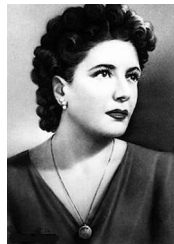
Benito Mussolini en zijn minnares Clara Petacci