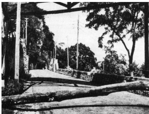
De wegversperring bij Musso waar de Duitse colonne met Mussolini werd aangehouden

Van de circa 2000 verzetsstrijders in de provincie waren er ongeveer 500 om het leven gekomen bij acties en represailles en nog eens 100 in Duitse concentratiekampen.