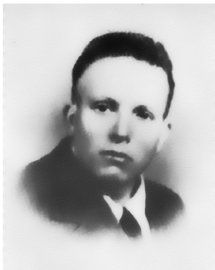
Luigi Clerici, verzetsleider

Uiteraard liet de tegenpartij dit alles niet ongemerkt passeren. In november '43 werd de Polizia Reppublicana en de Guardia Nazionale Reppublicana, GNR, opgericht. Het GNR kreeg o.a. tot taak de grensbewaking, de jacht op joden en de organisatie van razzia's. De fascistische partij werd geheel gemilitariseerd – alle leden werden bewapend. Naast bovengenoemde twee politiemachten, waren er de beruchte doodseskaders, de Brigade Nere (Zwarte Brigades), die onder afhankelijkheid van de Duitsers werkten. Op deze groepen was echter nauwelijks controle, ze opereerden vrijwel autonoom en oefenden een excessieve controle uit op de bevolking. De commandant van de 11 e Brigata Nera Paolo Porta, wantrouwde de Guardia di Finanza en de Carabinieri. Hij vermoedde terecht dat ze meewerkten aan de clandestiene transporten van personen, wapens en propagandamateriaal over de grens met Zwitserland. Van de Guardia deserteerden er ca 500 en velen daarvan kwamen terecht in het verzet. In augustus '44 werd het gehele corps ontwapend en vervangen door het GNR. Van de carabinieri waren er al velen bij de wapenstilstand naar Duitsland gedeporteerd en eind juni '44 eisten de Duitsers 10000 carabinieri voor de Luftwaffe in Duitsland. Zeer velen deserteerden en slechts 2800 gingen naar Duitsland. In augustus '44 werden 3000 carabinieri, die inmiddels waren toegevoegd aan het GNR, in de kazerne gevangengenomen en naar Duitsland gestuurd.