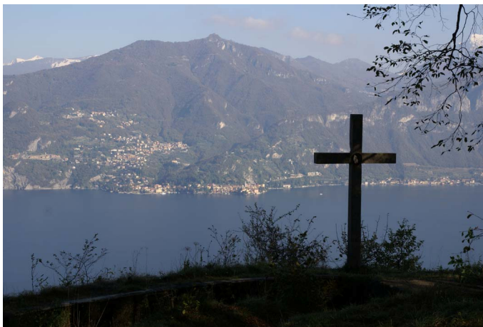
Gezicht op het meer vanaf La Crocetta

Na nog circa 50 m door de bossen bereiken we het kruis La Crocetta. Dit is een van de mooiste uitzichtpunten over het meer met gezicht op de tak naar Lecco, de Orobische Alpen en Valtellina. Van hier lopen we weer terug naar het kruispunt van de via Pigato met de via Wyatt. Naar rechts komt u terug op de weg Menaggio – Porlezza, links afslaand bereiken we aan het eind van de weg de golfbaan.