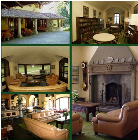
Het clubhuis van de Menaggio&Cadenabbia golfclub – alsof u meer dan een eeuw geleden in Engeland vertoeft