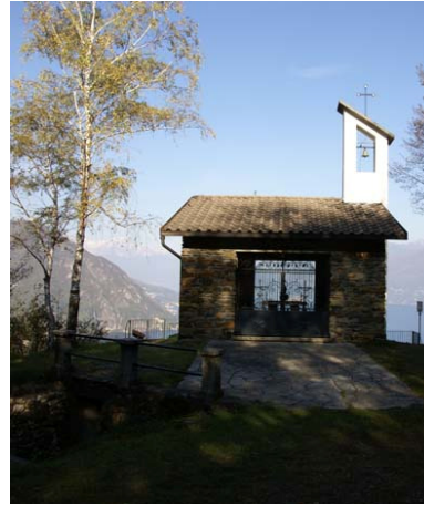
Kapel S. Mauritius voor de gevallen

Als we het pad langs de Cadornalinie vervolgen, bereiken we het kerkje van S. Maurizio, dat in 1975 door de Alpinistengroep uit Menaggio werd gebouwd, ter herinnering aan de gevallen van het regiment Alpenjagers in oorlogen.