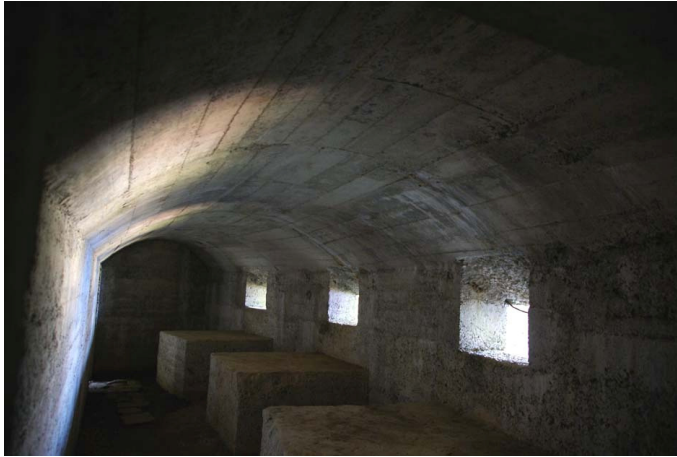
Mitralleurspost, uitkijkend over het meer

muilezelpaden werden aangelegd. Voor de uitvoering waren ca 40 000 manschappen nodig. De linie was in zes delen verdeeld, waarvan die bij Croce er een was. De loopgraven waren met veel zorg gemaakt en uitgerust met borstweringen en overdekte delen op een manier die sterk verschilt van die aan de fronten.