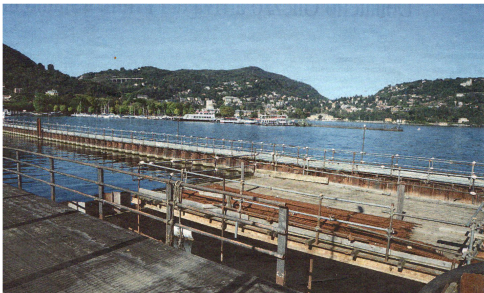
De werkzaamheden aan de waterkering liggen nu al jaren stil