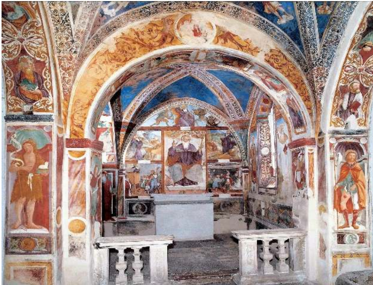
Interieur van de kerk van S. Miro met de fresco's geschilderd door Sigismundo di Magistris in de kapel van Sint Antonius Abt