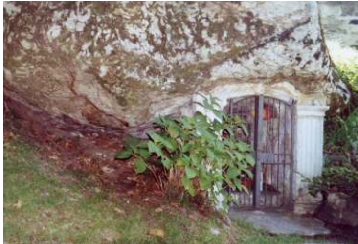
De Grot van S. Miro