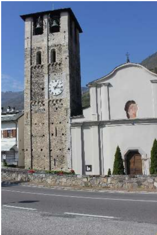
De parochiekerk van S. Stefano

Op de top van de heuvel S. Giorgio, die achter de kerk ligt, lag eens een fortificatie. Deze top is te bereiken door de Via Roma (zijweg links even vóór de kerk) in te slaan en links aanhoudend deze te volgen. Meer dan de resten van muren zult u echter niet aantreffen. Als u loopt tot het punt waar het pad uitkomt bij het riviertje en dan rechts omlaaggaat, komt u tenslotte weer terug op de Via Roma.