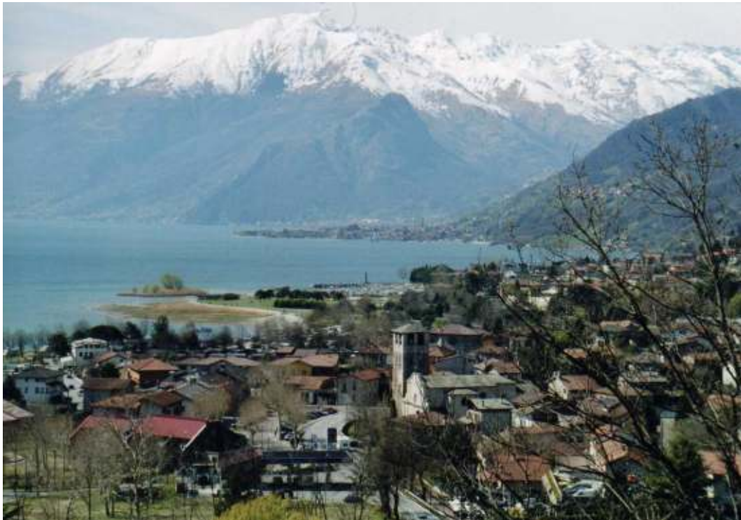
Uitzicht vanaf de kerk van S. Miro: op de voorgrond Sorico met de kerk van S. Stefano, op de achtergrond Gera Lario met het beeld bij de haven