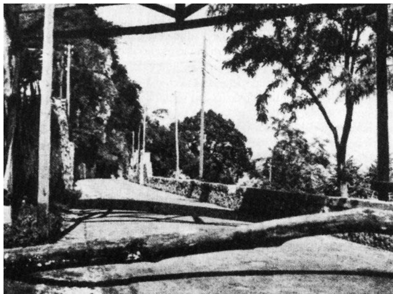
Fig. 9 De primitieve wegersperring in Musso, waar de Duitse kolonne met Mussolini werd tegengehouden door de partizanen.