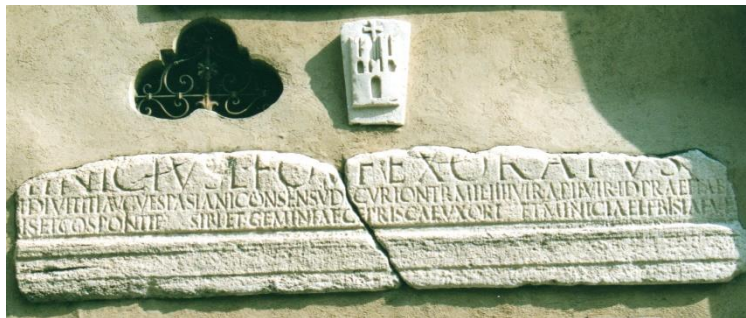
Fig. 5 Grafsteen in Musso marmer uit de 1e eeuw n.C. op de gevel van de kerk van S. Marta in Menaggio

Al bij de Romeinen was Musso bekend om zijn marmergroeven. De eerste groeve lag op vrijwel dezelfde plaats als het kasteel, later werd ook een hogere groeve in gebruik genomen. De marmerader zet zich overigens voort aan de overkant van het meer bij Olgiasco op het schiereiland van Piona. Het witte marmer van Musso werd onder andere door de Romeinen gebruikt voor de 16 zuilen bij de basiliek van San Lorenzo in Milaan en voor vele grafstenen en herdenkingsstenen die we in de dorpen langs het meer tegenkomen. Een mooi voorbeeld van zo'n grafsteen kunnen we zien ingemetseld in de buitenmuur van de S. Marta kerk in Menaggio. Deze steen dateert al uit de eerste eeuw n.C. In de marmergroeve werd ook nog een medaille gevonden met de beeltenis van keizer Galba (68-69 n.C.).