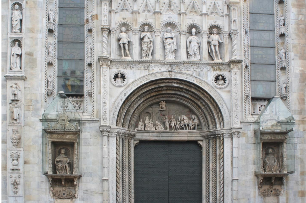
Fig. 6 Voorgevel van de Dom in Como uit 1452, geheel uitgevoerd in Musso marmer

is de marmervinging voortgezet, daarna werd nog tot 1970 marmer vermalen. Een deel van het marmerpoeder werd gestookt in de grote kalkoven die aan het meer stond. De definitieve sluiting van de mijn betekende het verlies van een baan voor ongeveer honderd arbeiders uit de omgeving van Musso. Door de marmerwinging zijn ook veel van de overblijfselen van het kasteel van Musso verdwenen.