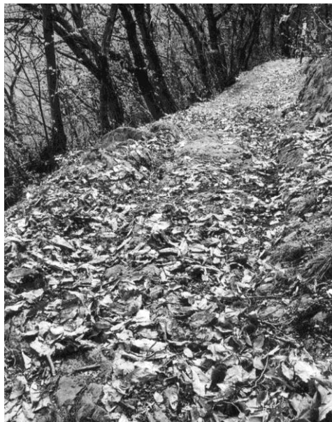
Fig. 8 Pad met uitgesleten karresporen uit de Middeleeuwen of misschien zelfs de Romeinse tijd

u eens op de appel die in bas-reliëf in het kozijn is gegraveerd. Meer van dergelijke figuren zijn ook gevonden in de rotsen van de Mereltuyn (zie hieronder). Ook in de borstwering rond de kerk zijn inscripties te zien. Boven deze plek zien we de steile wanden van de groeven waar het prachtige witte Musso marmer werd gewonnen. Van het oude kasteel staan alleen nog wat resten van muren.