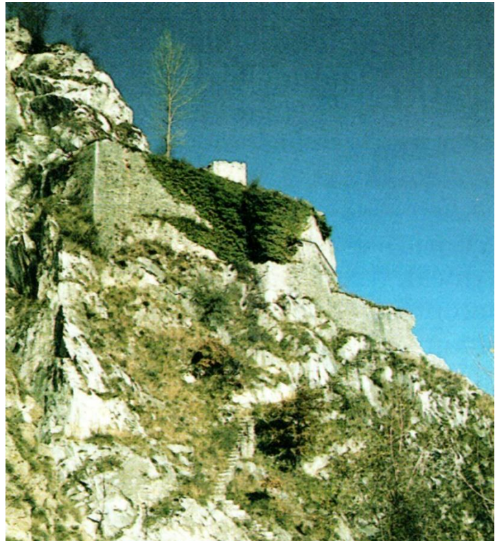
Fig. 2 Links: Het wapen van Musso; rechts: het kasteel van Musso