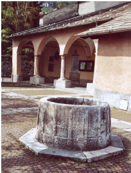
Fig. 1 Links: De marmeren doopvont naast de kerk van St. Biagio; rechts: De zuilengang aan de haven van Musso

De parochiekerk van S. Biagio (St. Blasius) ligt aan een kleine hof met een mooie marmeren vaas. Waarschijnlijk is het een oud doopvont uit de tijd dat de doop nog plaats vond door totale onderdompeling. Aan de kant van de weg wordt het pleintje afgegrensd door de 17 e -eeuwse, losstaande klokkentoren met wapens van Biagio Malacrida, de leenheer van Musso. De kerk werd in 1387 gebouwd en in 1507 verbouwd. De buitenzijde is versierd, maar van de oorspronkelijke kleuren is weinig meer te zien. Aan de kant van het pleintje is een zuilengang. Op twee pilaren werden tijdens de restauratie in 1985 twee afbeeldingen van 15 e -eeuwse heiligenfiguren gevonden: St. Antonio links en St. Defendente rechts. Dit zijn de resten van een uitvoeriger decoratie die waarschijnlijk is verdwenen onder de fresco's die Tagliaferri in 1883 heeft aangebracht.