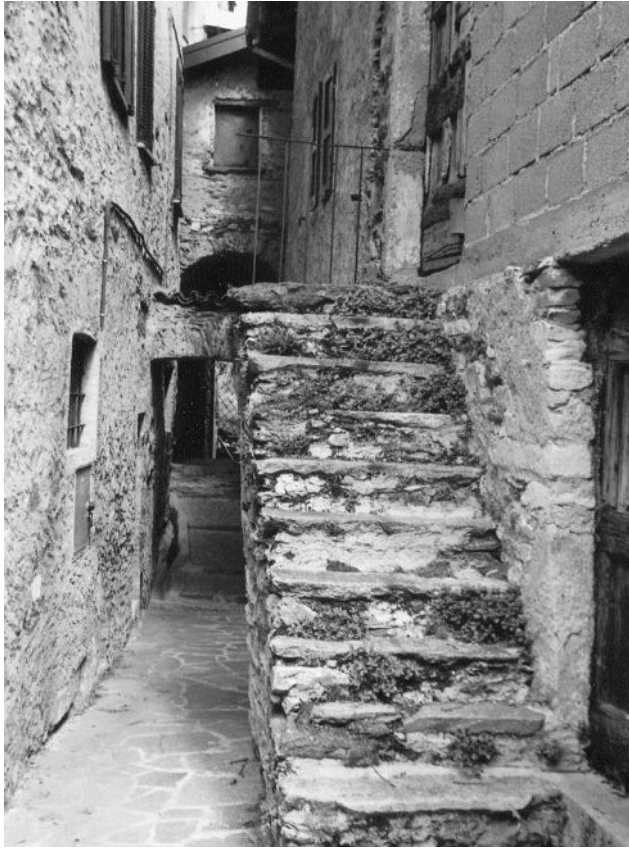
Fig. 7 Een straatje in Genico

maakte deel uit van de vroegere Strada Regina, die we ook bij de volgende dorpen zullen tegenkomen.