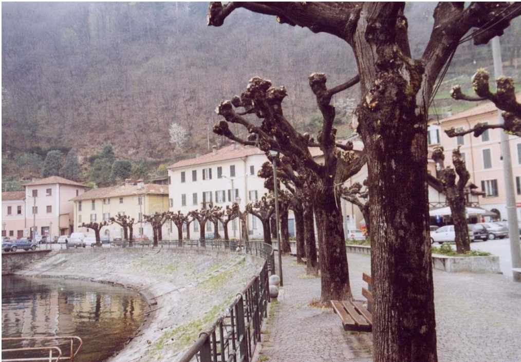
Fig. 10 Dongo - tegenover palazzo Manzi waar de fascisten werden gefusilleerd