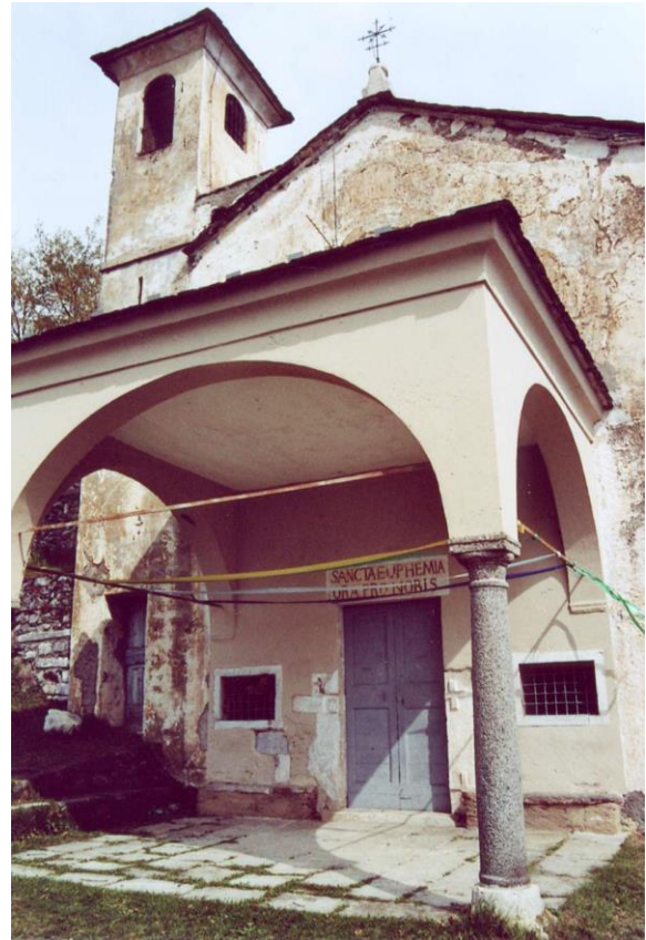
De kerk van S. Eufemia