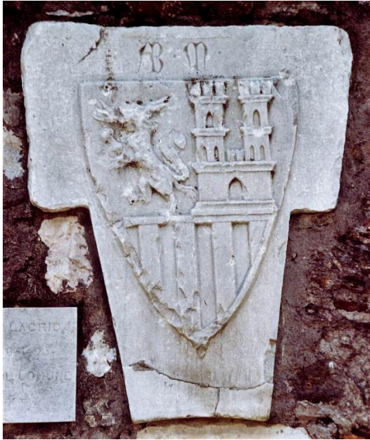
Fig. 3 Links: Het wapen van de Malacrida rechts: grootmaarschalk Trivulzio