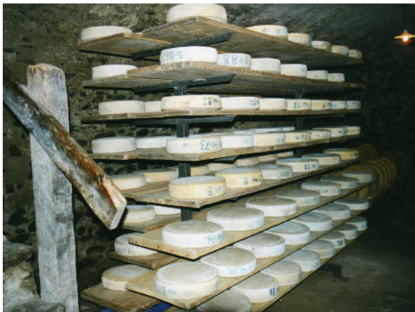
Kelder met Bittokazen