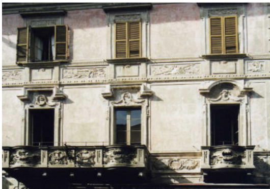
Piazza III Novembre nr. 37