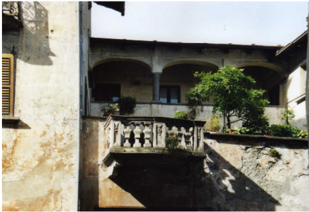
Piazza S. Pietro nr.6

Door het smalle straatje S. Pietro komen we op het plein van Marconi met een fontein uit 1880. Aan dit pleintje staan meerdere oude huizen. Huis nr. 8/9 heeft een mooi gedecoreerde gevel en op 21/22 zien we boven het balkon een groot fresco. Vervolgens slaan we de via S. Marco in, in dit straatje begon de weg over de gelijknamige pas (de via Priuli), die het Valtellina met de Republiek Venetië verbond. We komen hier in het oudste deel van de stad. Deze contrade (wijk) heet 'Cimacà' d.w.z. cimacase, huizen