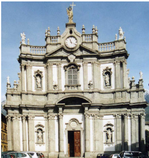
Kerk van S. Giovanni Battista

In de tekst van de rondwandeling beschreven we al de buitenzijde van de kerk en in deze paragraaf komt het interieur aan de orde. We komen binnen in een zeer grote ruimte met een indrukwekkend gewelf met aansluitend het priesterkoor met koepel. Er zijn acht kapellen met ieder een marmeren altaar.