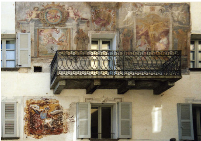
Piazza Marconi nr.21/22

begonnen in 1479 na een gelofte gedaan bij een pestepidemie. Bij dit kerkje eindigde vroeger de bebouwing en stond er een poort waar men de toegang tot de stad controleerde. Iets verder komen we op het plein van S. Rocco, aangelegd in 1819 toen men het plan had hier een triomfboog voor de Oostenrijkse keizer te bouwen. De boog is er echter door geldgebrek nooit gekomen.