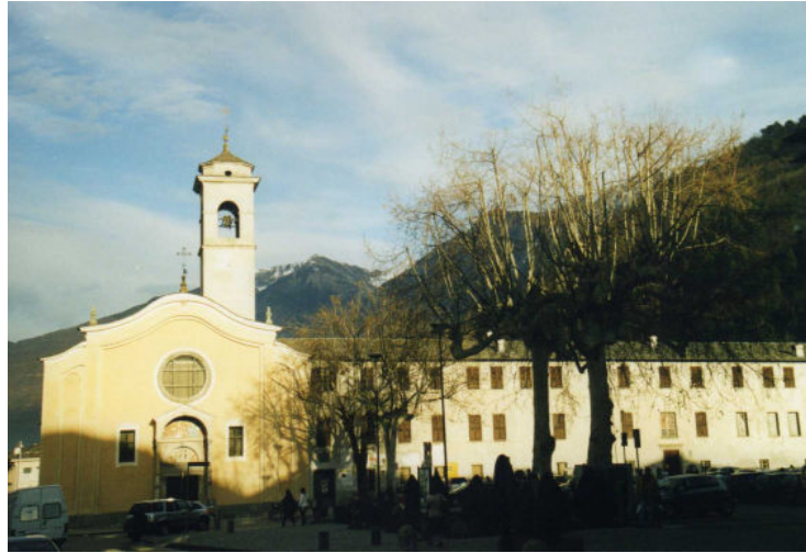
Kerk van S. Antonio en Dominicaner klooster