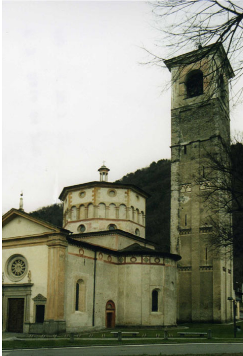
De kerk van de Assunta

1440. Op de bovenste rijen zien we de Twaalf Apostelen , Musicerende Engeltjes en tenslotte de Glorie van de Maagd . Het geheel is omgeven door een barokke houten rand, gemaakt in 1712 door Andrea Albiolo uit Bellagio.