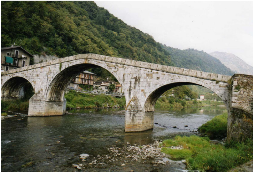
De Adda met de Ponte di Ganda

Een bezoek aan de Ponte di Ganda, daterend uit 1778 mag u beslist niet overslaan. Als u vanaf de provinciale weg de via Merizzi geheel afloopt of rijdt bereikt u na circa 800 m de brug over de Adda. De weg komt aan de noordzijde van de brug uit op de SP4, de Valeriana Occidentale. Deze vrij rustige weg loopt geheel parallel aan de drukke SS38 en is in westelijke richting een prettig alternatief als u even voorbij Dubino op de SS36 (Lecco-Chiavenna) wilt uitkomen. Overigens is het niet nodig om de smalle brug echt over te steken, want een paar honderd meter westelijk ligt de normale verkeersbrug over de Adda. Deze leidt over de via Forestale naar de provinciale weg SS38 in de stad.