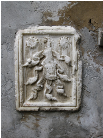
Afbeelding van het kasteel van Menaggio op een muur in een hofje aan de via Caronti

linkerkant van de kerk inslaan, maar laten we eerst linksaf de tegenover de via Caronti liggende via Delle Rose nemen. Langs dit smalle straatje liggen vele oude huizen. De wijk wordt La Fortezza genoemd; ze lag binnen de muren van het kasteel. Enkele tientallen meters verder ligt voorbij een antiquariaat een hofje met een zuil met een romaans kapiteel. Verder doorlopend zien we links, kijkend door de via Pesce, weer het piazza Garibaldi liggen. Rechtdoor lopend komen we weer uit bij het meer waar onder de portico een viswinkel ligt, waar de vissers vaak hun netten zitten te boeten.