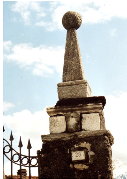
Rechts: zuil bij de ingang van via dei Fabbri 25