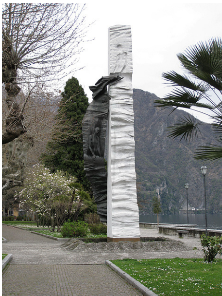
Links: Beeld voor de zijdewerksters

Iets verder, rechts, ligt het imposante hotel Victoria, gebouwd in 1885. We volgen de promenade langs het meer tot we weer bij ons uitgangspunt, het piazza Garibaldi komen, waar u vele terrassen vindt waar u kunt uitrusten van de wandeling.