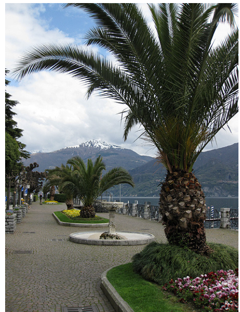
Rechts: De boulevard