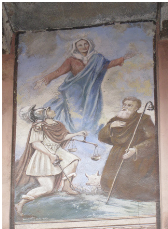
Fresco in de via Leoni

We gaan nu weer terug naar de kerk van S. Stefano, waar we de links naast de kerk liggende via Caronti inslaan. Een groot deel van de linkermuur van dit straatje was vroeger van het palazzo Bolza. Meteen vóór de bloemist aan de linkerkant is een hofje, waaraan de volledig verwaarloosde tuin van het palazzo Magnocavalli grensde. Als u het de vriendelijke dame van de bloemenwinkel vraagt, mag u daar wel even een kijkje nemen. Tegen de rechtermuur van het hofje vinden we een steen van wit Musso marmer uit 1400. U ziet een afbeelding van het kasteel met een groot portaal en drie ramen. Naar men zegt kwam hier een onderaardse gang uit die naar het kasteel leidde.