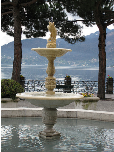
Fontein op het piazza Garibaldi

Als u van het plein de drukke via 4 Novembre inloopt, richting Como, dan passeert u het Grand Hotel Menaggio. Ernaast lag vroeger de Albergo Stazione, want op de plaats van het huidige tankstation lag vroeger het station van de trein naar Porlezza. Nog iets verder is links de aanlegsteiger van de ponten over het meer.