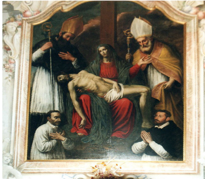
Pietà in de kerk van S. Carlo