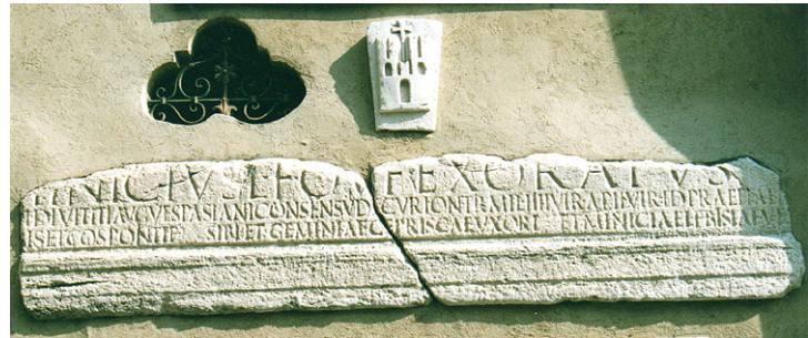
Romeinse grafsteen op St. Martakerk

We laten het meer achter ons en slaan op het plein rechts af de via Camozzi in. Op de hoek vindt u het toeristenbureau, waar u door een Nederlandse dame geholpen kunt worden. We zijn hier in een middeleeuwse wijk met vele oude huizen, vaak met winkeltjes of werkplaatsjes op de begane grond. Al snel nemen we links de via Al Lago en vervolgens weer links de via Porta, welke ons weer terugbrengt op het plein.