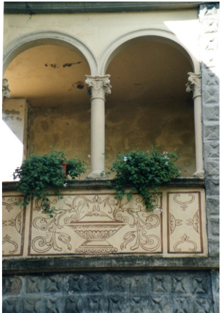
Links: Loggia via Castellino di Castello