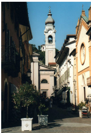
Via Calvi met rechts de kerk van S. Marta en aan het eind St. Stefano