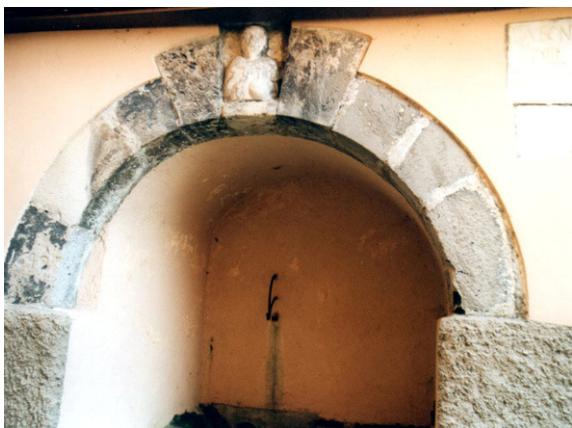
Fontana del Salvatore

We vervolgen de route en zien na een korte afstand op de gevel van huis nummer 56 twee middeleeuwse bas-reliëfs, een gevleugelde kat en twee bustes uit de 11 e eeuw. Ze komen van de verwoeste kerk van S. Giacomo, naast een benedictijns klooster. Dit klooster werd al in 1317 opgeheven, maar de kerk bleef in gebruik tot eind 18 e eeuw.