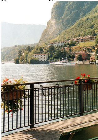
Gezicht op het meer

De plaats ligt op het knooppunt van de verbindingen naar het meer van Lugano en langs het Comomeer. Het is dan ook niet verwonderlijk dat uit opgravingen, o.a. bij Plesio en Breglia, is gebleken dat de omgeving al in de oudste tijden bewoond werd. Er zijn vondsten die tonen dat hier Ligurische stammen woonden en misschien ook Etrusken. Zeker is dat er vanaf ca. 400 jaar vChr. Gallische volken woonden. Men vermoedt zelfs dat de Galliers het eerste kasteel van Menaggio bouwden. In 196 vChr. werden ze verdreven door de Romeinen onder Claudio Marcello. In die tijd kreeg de plaats de naam Menaxium. Uit de Romeinse tijd zijn er tal van graftombes gevonden. De vele grafstenen zijn in de 16 e eeuw door bisschop Lazzaro Carafino van