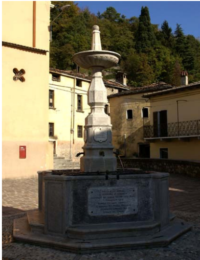
Fontein op het kerkplein in Barna