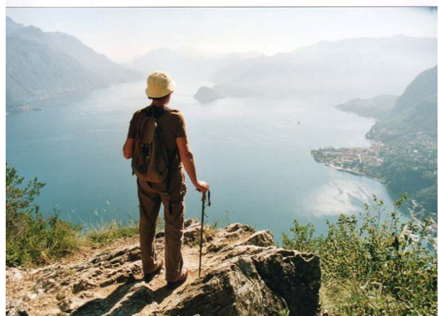
Mijn echtgenote op een uitzichtpunt boven de Sasso Rancio