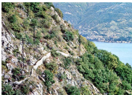
De Via Regina in Nobiallo iets voor het begin van de route over het Sasso Rancio (foto rechts)