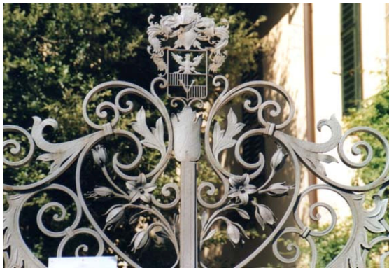
Hek villa Vigoni