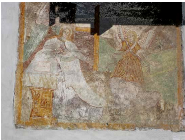
Muurfresco in Breglia

Vanuit Breglia kan men in ruim een uur een aardige en niet te zware rondwandeling maken langs de kerk van S. Domenico. Het pad begint aan de rechterkant van de parkeerplaats naast de parochiekerk. Al snel is er een splitsing waar u links aanhoudt. Onderweg is er een plek waar u een geweldig uitzicht over het meer heeft. Niet lang daarna bereikt u de kerk van S. Domenico, waar u opnieuw een prachtig uitzicht over het meer heeft. Binnen de kerk bewaart men een marmeren standbeeld van de Maagd uit 1740, geschonken door de familie Tatti, geëmigreerd naar Genua.