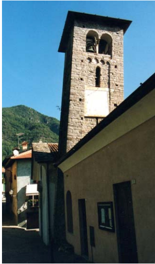
De scheve klokkentoren van Nobiallo

Op korte afstand van het dorp vinden we langs de via Regina het kerkje van de Madonna della Pace, dat gebouwd werd ter ere van de vrede van de Pyreneeën tussen Frankrijk en Spanje in 1658.