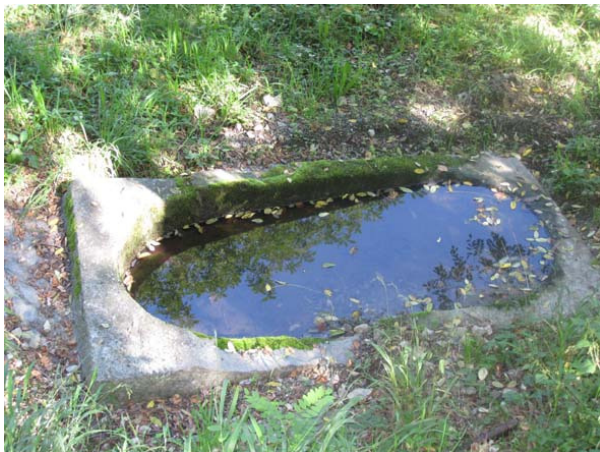
"Masso Avello", een Romeins graf uit de 2 e eeuw nC., ontdekt in 1908 bij Plesio

Iets buiten het dorp staat de parochiekerk van S. Fedele uit 1582 met een klokkentoren uit 1716.