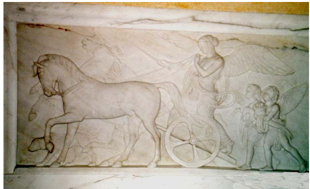
Reliëf in villa Vigoni gemaakt door Thorwaldsen

Tegenover villa Vigoni ligt villa Garovaglio, 19 e eeuws en eveneens omringd door een grote tuin. Ook deze is eigendom van de BRD en wordt vooral gebruikt voor de organisatie van congressen. Ze herbergde een rijke archeologische verzameling, bijeengebracht door Alfonso Garovaglio tijdens zijn reizen. De collectie is nu ondergebracht in het Museo Civico in Como.