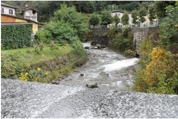
Het riviertje de Lesina aan het eind van de via Verdi