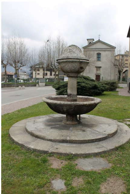
Fontein voor het gemeentehuis met op de achtergrond de kerk van S.Dominicus

Vervolgens gaan we linksaf door de via Lucini tot we naar rechts de via Emanuel II inslaan. Aan het eind hiervan ligt links het gemeentehuis, annex politiebureau, annex postkantoor. Aan de achterkant van het gemeentehuis is een tuintje waarin een middeleeuwse sarcofaag staat die nu als bloemenbak fungeert. Aan de voorzijde staat een elegante fontein uit 1837.