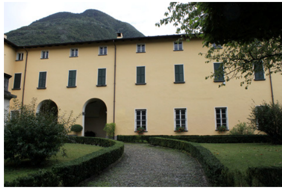
Het palazzo Fumagalli

Meteen links in de via Fumagalli zien we tegen een huis een gedenksteen voor de schilder Fumagalli, die hier geboren werd en stierf (1887-1943).