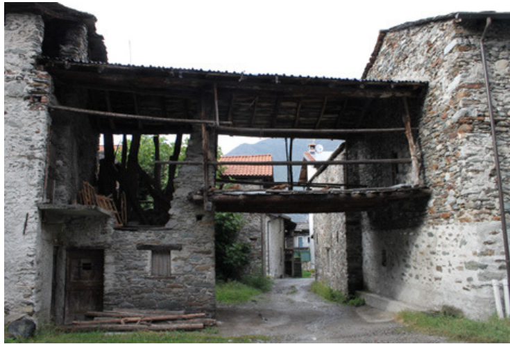
Een van de boerenhuizen en schuren bij de via Torelli

De steeg uitlopend, bereiken we de via Roma. Net voor de kruising is achter de tuinmuur een deel van een ninfeo te zien. In de Grieks-Romeinse tijd was een ninfeo een plaats voor een fontein of bron. Of dit hier ook zo is, heb ik niet kunnen achterhalen – de burens hadden geen idee wat voor bouwsel dit was.