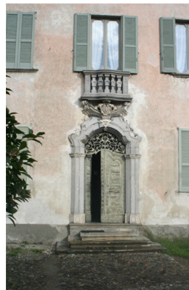
Ingang van het palazzo ex-Bassi

We gaan nu rechtsaf de via Roma in tot we na een meter of twintig links de via Torelli inslaan. We zijn hier in het oudste deel van het dorp met de karakteristieke culundéi . Dit zijn binnenhofjes bij boerenhuizen met aangrenzend de hooischuren. Hier vinden we de overblijfselen van een kleine boerengemeenschap. Uit een kaart uit 1812 blijkt dat er in die tijd wel een zestigtal boerenhuizen waren in Delebio. Hoewel ze intussen andere bestemmingen hebben gekregen, zijn ze op verschillende plaatsen in het dorp nog herkenbaar: in de via Roma tussen via Cavour en via Torelli, de culundél di Bulàt ; de culundél di Iacumantùni , aan de ingang van via Torelli; die van de Lulgiùn , die zich opent aan de via Roma bij de kruising met via Torelli en waar we een huis zien met een loggia zoals van een klooster: Dit zou het laatste gebouw van de cisterciënzers geweest kunnen zijn, tegen eind 1400. De culundèl langs de via Torelli zien er redelijk vervallen uit en enkele zijn verbouwd tot moderne woonhuizen. We passeren opnieuw een wasplaats en zien op een huis nog een fresco afgebeeld. Aan het eind komen we uit op de via Cavour, waar we rechts afslaan en terugkomen op de via Roma.