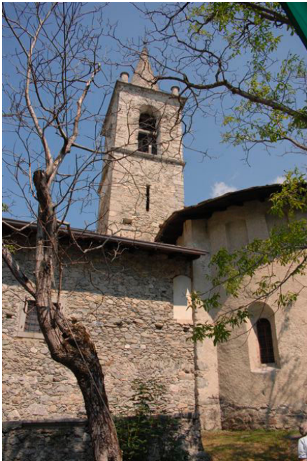
De kerk van S. Fedele in Mello

In de nacht waarop Rusca werd vermoord, werd het dorp Piuro (boven Chiavenna) vrijwel geheel verwoest door een steenlawine. 6 Deze ramp werd door de katholieken gezien als een goddelijke straf voor het tolereren van de protestantse ketterij en deze gebeurtenis wakkerde de haatgevoelens van de bevolking nog verder aan. Een reactie kon tenslotte niet uitblijven.