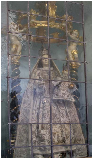
Mariabeeld in Caspano

In 1817 brak er in de parochie een epidemie van vlektyphus uit en al snel waren er vijftig doden in het dorp. De dorpelingen baden tot het Mariabeeld, overigens in afwezigheid van de pastoor die op de vlucht was geslagen naar Ardenno, en beloofden ieder jaar een feest voor de Heilige Maagd te houden als ze een eind aan de epidemie zou maken. Hun gebeden werden verhoord en vanaf die tijd wordt er ieder jaar op de 4 e zondag in juli een processie georganiseerd waarbij de dorpelingen in de oude klederdracht deelnemen. Bij die gelegenheid worden alle 8 klokken geluid. De broederschap loopt in rode kleding in de stoet en draagt het Mariabeeld mee, daarachter de dochters van Maria met een blauwe band om de jurk.