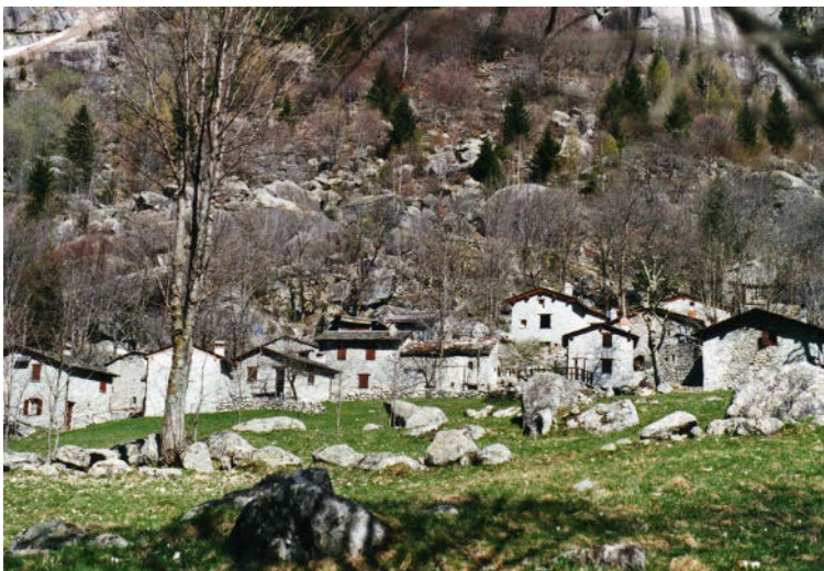
Het Mellodal, weideplaats voor het vee uit de Costa dei Cèch