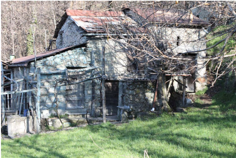
Boerenwoning in de Costa dei Cèch

De dorpen van de Costa dei Cèch hadden in de 15 e eeuw bij herhaling te lijden onder de legers van de hertog van Milaan en van hun vijanden, de Venetianen, de Fransen en de Grigioni, die door het gebied trokken en en passant de dorpen plunderden.