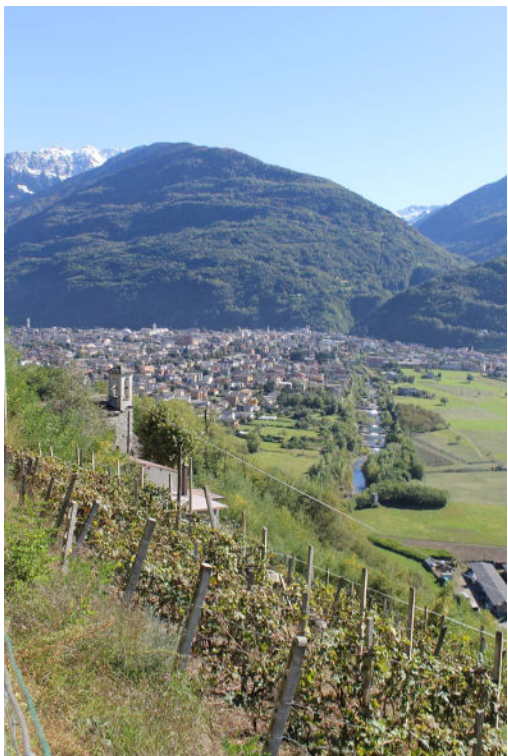
Gezicht van de Costa dei Cèch op Morbegno

Deze levenswijze heeft tot in de jaren zestig geduurd. Tegenwoordig zijn veel van de oude, hoog gelegen huizen in gebruik als tweede woning of agriturismo, vooral voor de liefhebbers van het alpinisme.