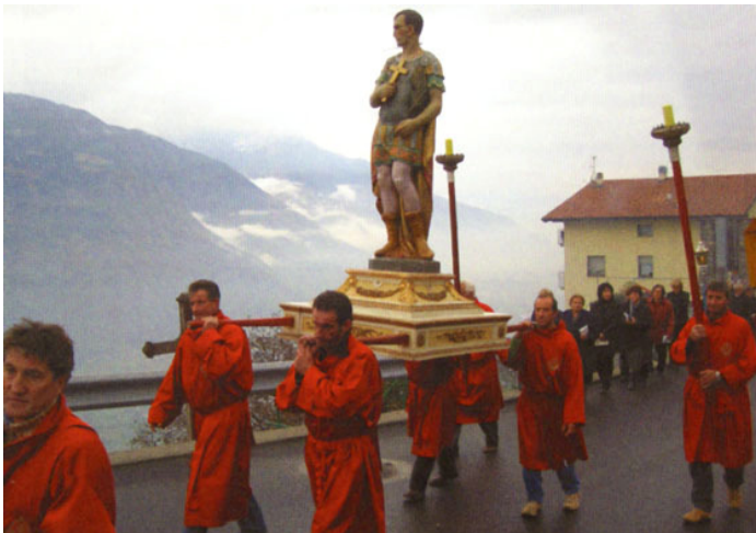
Processie van de broederschap in Mello voor S. Fedele

Uit het midden van de 17 e eeuw dateren ook de lekenbroederschappen. Uit 1640 dateert in Mello een boekje met de Statuten van de Broederschap van het allerheiligste Sacrament. Hoewel deze broederschappen onder Napoleon verboden werden, kwamen ze later weer tot leven. Zo wordt in Mello nog de jaarlijkse processies door deze broederschap georganiseerd. De leden van de broederschap, gestoken in rode jassen.