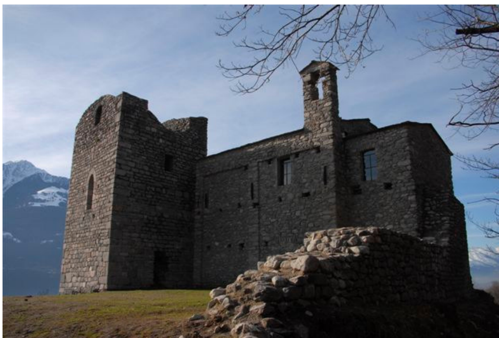
Het kasteel van Domofole van de Vicedomini familie