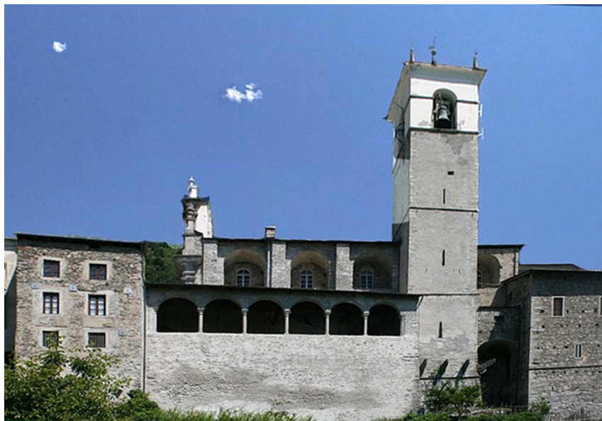
De kerk van S. Bartolomeo in Caspano

Het gedeelde gebruik van de kerk leidde regelmatig tot onenigheden, bijvoorbeeld als de protestanten de klokken luidden. Dit leidde er tenslotte toe dat de katholieken besloten een kerk voor de protestanten te bouwen. Op 6 juni 1608 werd met de bouw begonnen. Alle katholieken moesten hier financieel aan bijdragen en men sloot een grote lening, zodat men in 1612 de nieuwe kerk aan de protestanten kon aanbieden.