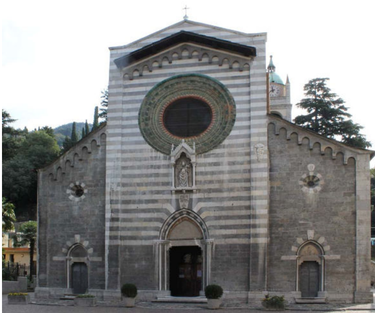
Voorgevel van de parochiekerk

De Romaanse kerk dateert in de huidige vorm uit 1342-1350. De 14 e eeuwse structuur is herkenbaar aan de gevel met zwarte en witte banden in het middenstuk. De kerk heeft een aantal opmerkelijke fresco's tegen het gewelf van het middenschip* en in de kapel links een mooi altaarstuk*, in de kapel rechts een schitterend veelluik** uit ca. 1525 en tegen de linkerwand van het priesterschap een tabernakel* uit de 15 e eeuw.