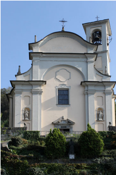
De kerk van de Madonna in Lezzeno