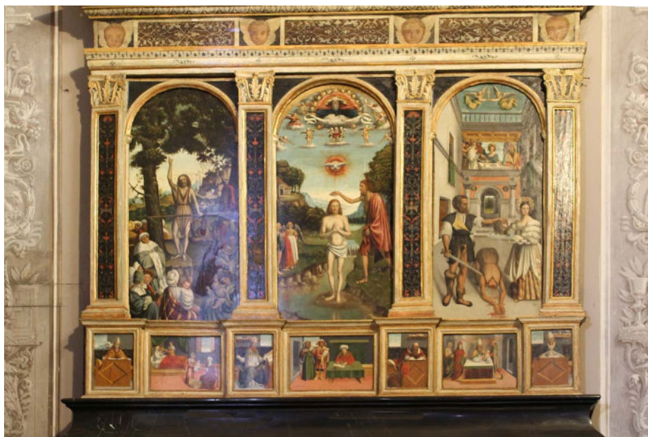
Veelluik in de kerk van de heiligen Nazaro, Celso en Giorgio

De overige werken in de kerk dateren vooral uit de 17 e eeuw, waaronder de notenhouten biechtstoel. De kerk bezit ook vele kostbaarheden, waaronder een groot Processiekruis ** van Pietro Lierni, twee kelken, waarvan één gedateerd 1375 met email, de tweede 16 e eeuws en gegraveerd, en vele barokke gouden voorwerpen.