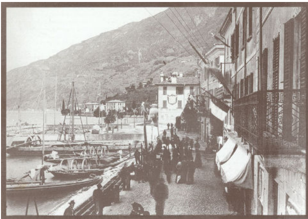
Oude foto van de haven van Bellano