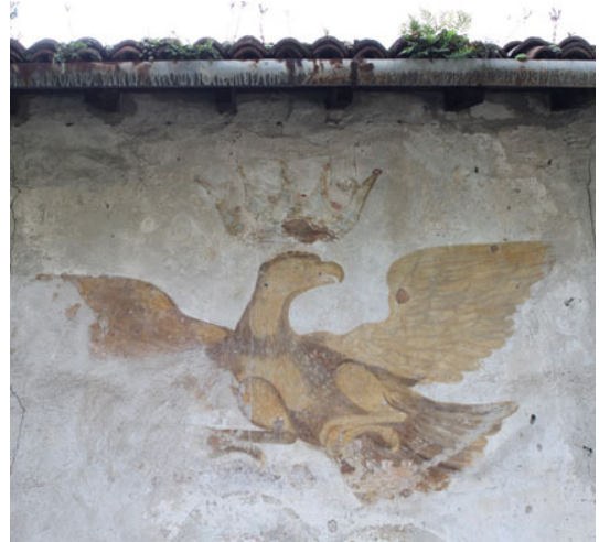
Rechts: Afbeelding op het zgn. Huis van de Duivel aan het eind van de kloof

In 1998 kocht de gemeente het gebied van de Orrido aan, liet er voetpaden langs de rotsen aanleggen en verlichting, waardoor het een voor toeristen buitengewoon aantrekkelijk punt is geworden.