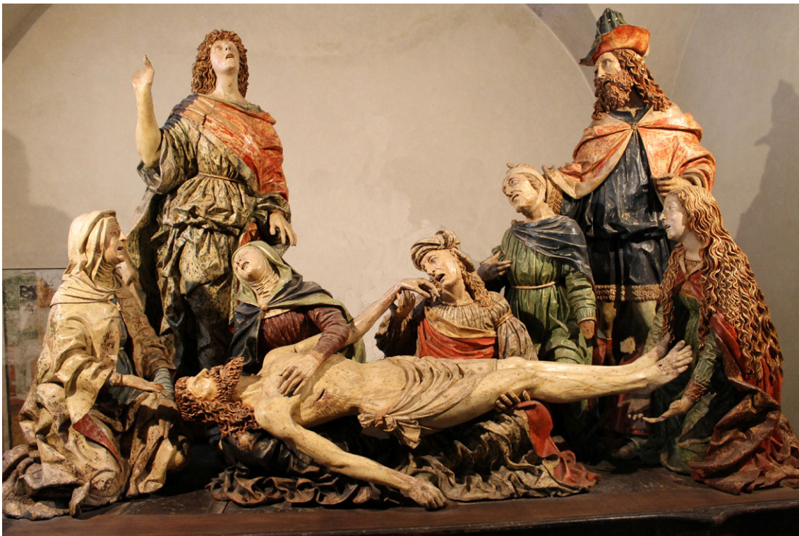
Pietà in de kerk van St. Marta

Tegenover de parochiekerk staat de kerk van S. Marta naast de vroegere, gelijknamige Broederschap, die nu het parochiecentrum is. De school wordt al in 1387 genoemd en de kerk wordt in 1455 genoemd in het verslag van een pastoraal bezoek. Van de in dit verslag genoemde decoraties zien we op de gevel nog een laat-gotisch Pietà en in de eerste kapel links een fragment met S. Giacomo . Het meest de aandacht trekkend is echter de groep met de Pietà ** uit 1518, gemaakt door Giovanni Angelo Del Maino. De gevel, die ontstond na een draaiing van de as van de kerk, toont nog gotische boogjes en boven het portaal zien we een nis met een standbeeld van de Doper uit 1589. Enkele jaren eerder (1582) werd de prachtige decoratie van de vieringtoren 4 aangebracht: aan de binnenzijde van de twee bogen de Profeten en de Sibillen ; op de pendentieven 5 de Profeten ; op de tamboer 6 de heiligen Nazaro en Celso en Marta en Maria Magdalena ; in de nissen van het gewelf allegorische afbeeldingen en de Engelen met passiesymbolen . Uit de 17 e eeuw dateren de klokkentoren en enkele schilderijen, waaronder in de eerste kapel rechts de verschijning van de Maagd met Kind aan S. Antonius van Padua *; op het hoofdaltaar de Smeekbede van Marta en Maria tot Christus en twee ronde schilderijen met S. Johannes de Doper en S. Johannes Evangelist .