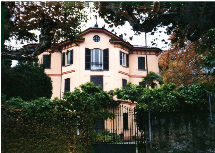
Links: Villa Aureggi

De legende wil dat de handelaren in het dorp sterk protesteerden tegen de overgang naar een nieuw stelsel van gewichten en een delegatie met een smeekeschrift naar de Gouverneur, de graaf van Fuentes, stuurden. Het hele dorp zat in spanning over de afloop van de missie en er had zich een grote menigte verzameld aan de oever van het meer. Toen men eindelijk de gondel met de afgevaardigden over het meer zag naderen, riep men zo luid mogelijk “Pesa vegia o pesa nova”? (het oude gewicht of het nieuwe?). Toen er werd teruggeroepen “Pesa Vegia!” brak er een luid gejuich los. Iemand bedacht dat het Driekoningen was en men maakte van de optocht met de Drie Wijzen een groot feest waaraan het hele dorp tot diep in de nacht deelnam.