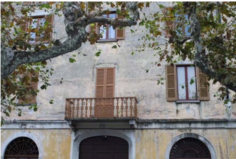
Links: het vroegere hotel Posta

Op de andere hoek van het Piazza Verdi, tegenover de kiosk, is het restaurant Pesa Vegia, genoemd naar het traditionele feest dat op Driekoningen in Bellano wordt gevierd.