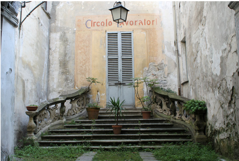
Circolo dei lavoratori in de via Manzoni