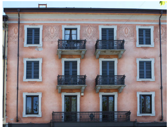
Vroegere villa van de familie Redaelli, nu appartementengebouw