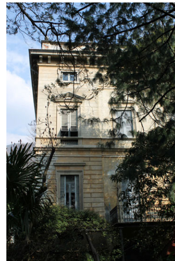
Rechts: Villa Bertarini Monti

In de via Loreti staat tegenover de villa Castelli, de grote villa Bertarini met een tuin vol zeer oude bomen. De ingang ligt aan de via Statale 10. De villa werd eind 1800 gebouwd voor de familie Pensa in neoklassieke stijl; het is nu het zomerverblijf van de familie Bertarini Monti. Ook de andere huizen dateren uit het eind van de 19 e eeuw, en voor zover ze niet omgebouwd zijn tot appartementencomplexen worden ze voornamelijk als zomerverblijf gebruikt.