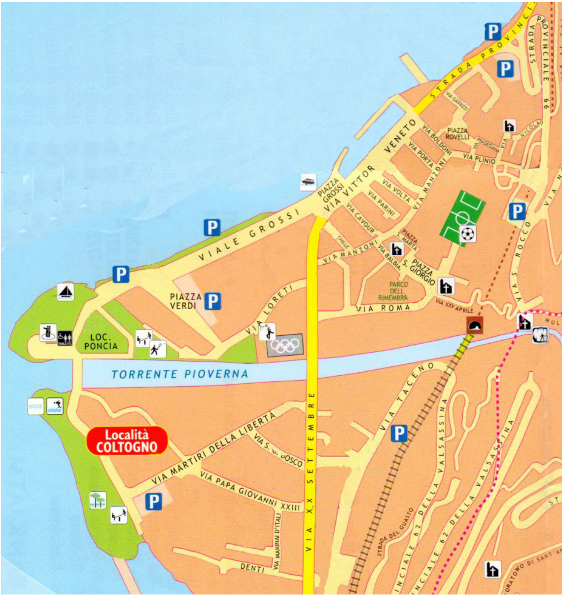
Plattegrond van Bellano