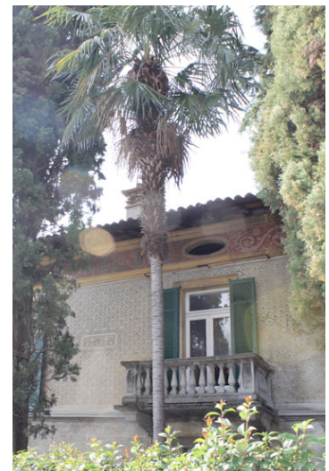
Rechts: Casa Castelli