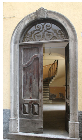
Deur van een oud palazzo op de hoek van het piazza S. Marta en doorkijkjes in de via Manzoni

Weer terug onder de boog door, slaan we links af en volgen we de via Manzoni. Al snel is er rechts een hof waar een trapje met een fraaie balustrade naar de ingang van het Casa dei Lavoratori leidt. Dit was de sociëteit van de arbeiders in de katoenfabriek. Het is al vele jaren niet meer in gebruik en begint al tekenen van verval te tonen. Binnen moeten mooie kamers zijn met prachtig gedecoreerde plafonds. Nog iets verder rechts, bij nr. 70, passeert u met binnenplaats met een hoge palmboom, Aan het eind buigt de via Manzoni naar rechts naar de via Plinio, waar de vroegere kerk S. Nicolaas ligt. De kerk is niet meer als zodanig in gebruik en wordt door de gemeente nu als cultureel centrum gebruikt. Ze bevat enkele mooie fresco's. Voordat u bij de kerk komt is er rechts een zijstraatje, de via Plinio, waar meteen de boog in het midden van de straat opvalt. Boven de boog is de Madonna met Kind afgebeeld. Men onderstelt dat ze is opgericht omdat dit de oude route is die naar de bedevaartskerk van Lezeno leidt (zie onder).