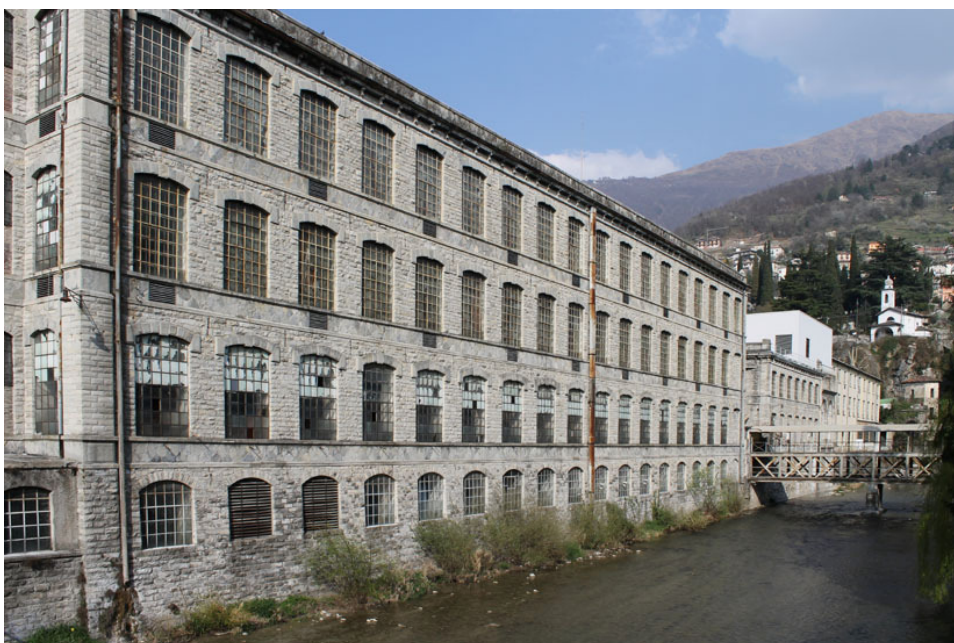
De ‘Cotonificio’, tot 1985 was deze textiel­fabriek een belangrijke werkgever voor Bellano. Nu worden er af en toe culturele evenementen in georganiseerd, bijv. een opera-uitvoering

Aan het eind van de viale Grossi bereiken we de zeilvereniging Circolo Vela Bellano. Deze vereniging, opgericht in 1970, zet een oude traditie voort door jaarlijks de Coppa Bellano te organiseren. Deze zeilwedstrijd werd voor het eerst georganiseerd in 1871 tussen Bellano en Dervio en is daarmee de oudste van Italië