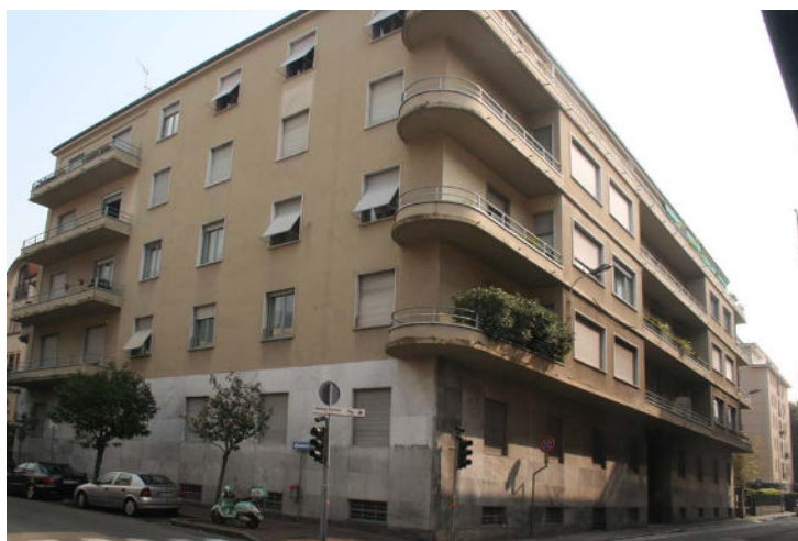
Fig. 5 Casa Said

Huisnummer 17 is het Casa Said, uit 1944 van Gianni Mantero. Het is een typisch rationalistisch ontwerp, sober en licht met grote ramen.