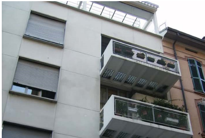
Fig. 4 Casa Pedraglio

Op Via Mentana nummer 6 staat het Casa Pedraglio uit 1937, een ontwerp van Giuseppe Terragni. In feite omvat het gebouw slechts twee-derde van het originele ontwerp, zoals zichtbaar in de asymmetrie van de façade. Het ontbrekende deel moest het tegenwicht vormen van de balkons en terugwijkende delen aan de gevel. Op iedere verdieping vinden we twee appartementen, bereikbaar via een centrale binnentrap. Oorspronkelijk was de gevel gemaakt van blauw gekleurde betonplaten met stukjes marmer, maar dat is nu veranderd. De vloer van de balkons bestaat uit glasplaten gevat in een betonnen rand, waardoor het geheel transparant wordt, hetgeen nog wordt versterkt door de vensters die tot het plafond reiken. Helaas is ook de beneden verdieping later veranderd: de openingen zijn veranderd en er is een stenen rand omheen gezet.