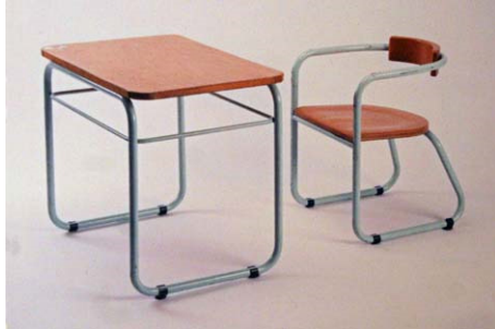
Fig. 9 Meubilair voor de kleuterschool Sant'Elia, ontworpen door Giuseppe Terragni

Terragni speelt hier ook met kleuren: azuur voor de gepleisterde muren en kristallijn kwarts tussen de ramen en slaagde erin het hele gebouw een grote transparantie te geven. Hij bemoeide zich met ieder detail tot en met het meubilair, dat deels is afgeleid van dat voor het Casa del Fascio. Het gebouw is vrij recent gerestaureerd door Studio Terragni, waardoor het weer zijn oorspronkelijke staat heeft teruggekregen.