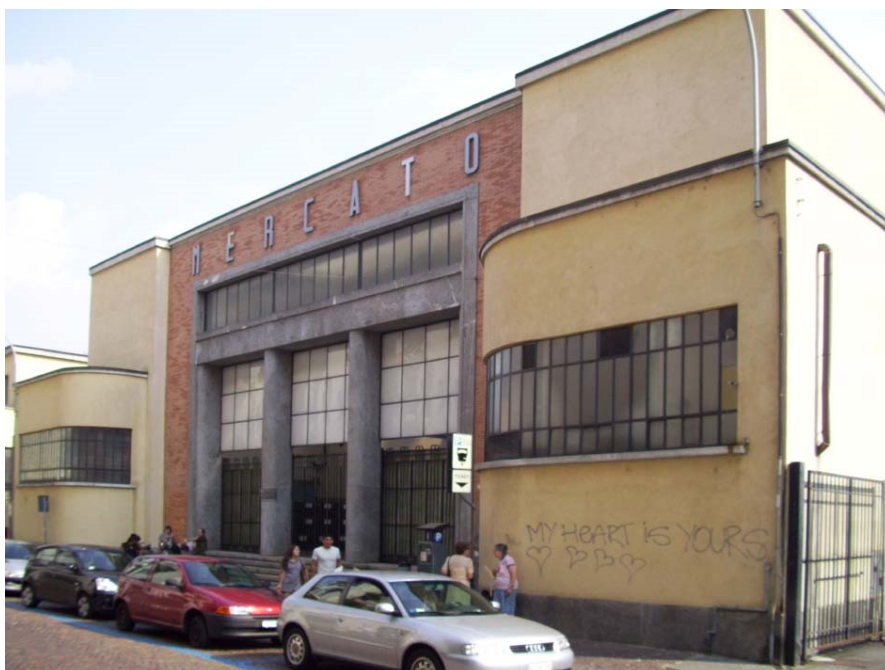
Fig. 3 De overdekte markthal in de via Mentana 5

Op Via Mentana nr. 5 (met een andere toegang in de Via Sirtori) vinden we de grote, overdekte markthal uit 1934, van de Milanese architect M. Levacher.