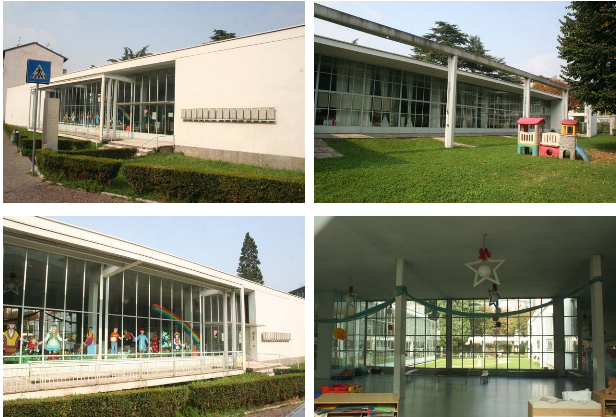
Fig. 8 De kleuterschool Sant'Elia

Zoals het Casa del Fascio een glazen huis was voor het fascisme, is de kleuterschool Sant'Elia een glazen leerhuis. Overal waar je kijkt zijn er transparante wanden. Het midden van het gebouw heeft glazen tussenwanden die zorgen voor de visuele continuïteit zowel als voor geluidsisolatie. Het dak is, in stijl met de ideeën van Le Corbusier, ontworpen als dakterras.