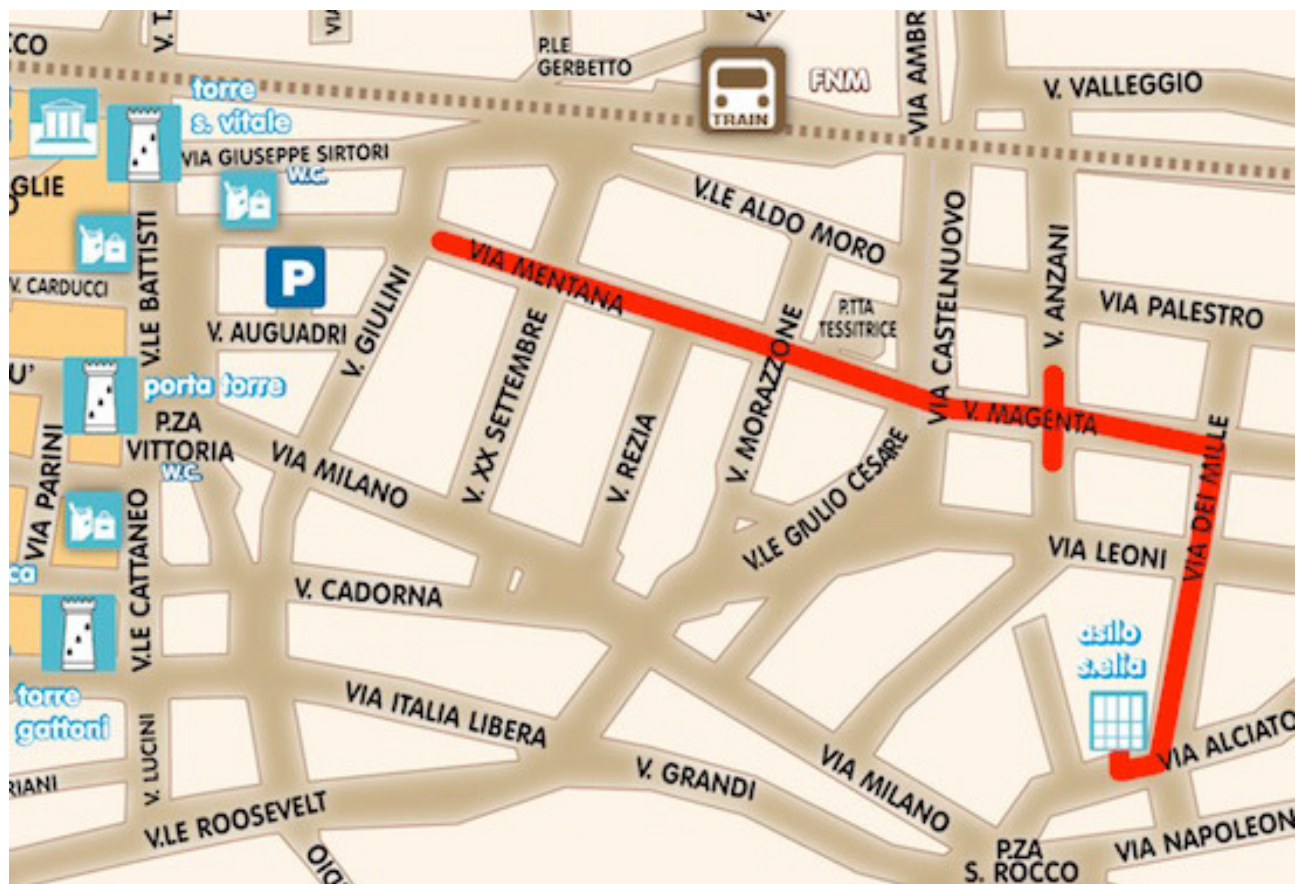
Fig. 1 Plattegrond met wandeling 2 langs de rationalistische gebouwen

In de Nieuwsbrief 6(2014) beschreef ik een wandeling langs de rationalistische gebouwen in het centrum van Como, dicht bij het meer. Er zijn echter nog meer gebouwen in de stijl van het rationalisme, gelegen net buiten de stadsmuren. Voor het geval u er nog niet genoeg van heeft gekregen, beschrijf ik deze in een volgende wandeling, eveneens van ongeveer 2 uur.