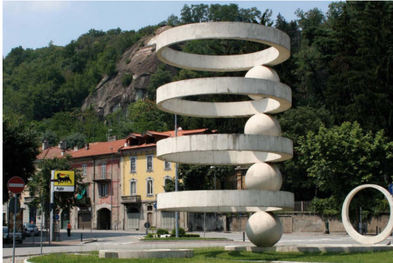
Fig. 11 Fontein op piazzale Camerlata