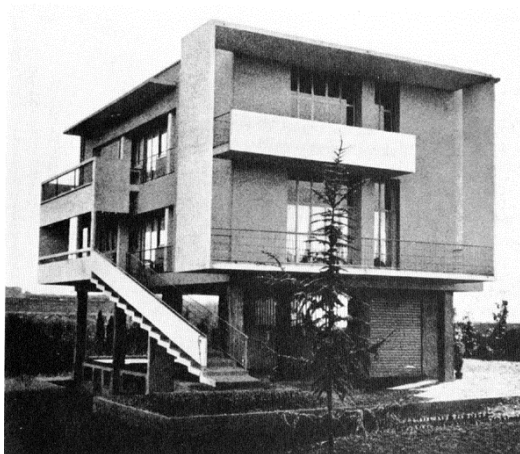
Fig. 12 Villa del floricoltore (oorspronkelijk)

De villa werd gebouwd door G. Terragni in 1935-'37. De geschiedenis van het ontwerp voor de villa verliep zeer moeizaam omdat de eigenaar het project iedere keer weer opnieuw wilde vereenvoudigen omdat hij het te duur vond. Het huis is vooral interessant omdat hier de invloed van Le Corbusier op Terragni zo duidelijk zichtbaar is. Het huis staat op pilaren ( de 'pilotis' van Le Corbusier) en de begane grond is leeg, waardoor het gebouw als het ware zweeft in de ruimte. De belangrijkste gevel ligt aan de zonkant met grote ramen en door de overhangen en balkons ontstaat een spel van licht en schaduw. Er loopt een buitentrap naar de eerste verdieping en er is een binnentrap naar de bovenste verdieping. De bouw duurde lang omdat Bianchi zoveel mogelijk door eigen werknemers wilde laten uitvoeren om kosten te besparen. Ook voerde hij een lange strijd om het huis te laten inschrijven als boerenhuis i.p.v. als villa omdat hij daarmee volgens een wet belastingvrijstelling kon krijgen op de bouwmaterialen.