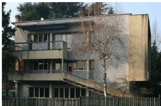
Fig. 13 Villa na de verbouwing