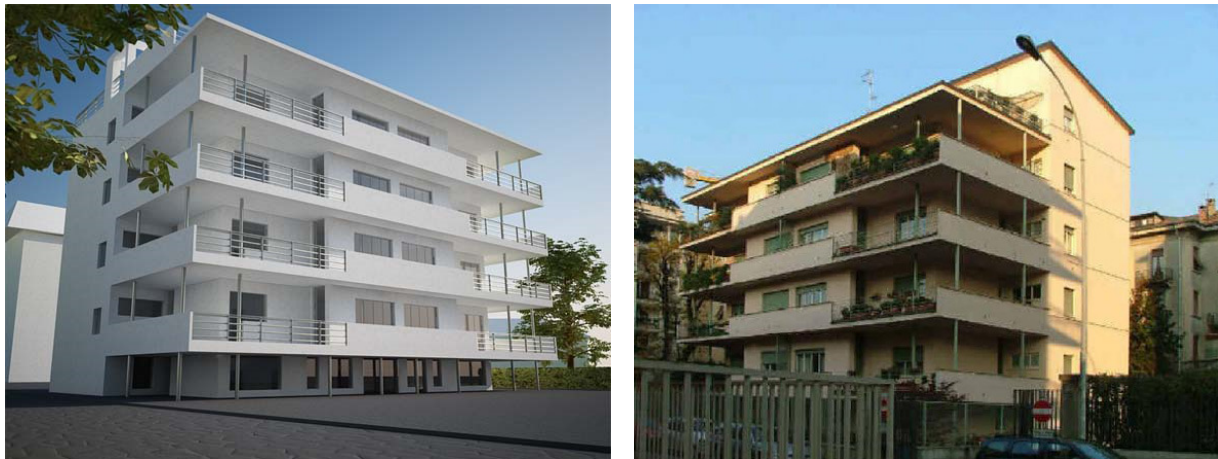
Fig. 6 Links een model van het casa Cattaneo Alchieri, rechts de huidige gedaante

Daar vlak bij, op nummer 25, zien we het casa Cattaneo Alchieri uit 1936, ontworpen door Pietro Lingeri. Dit gebouw wordt wel een gestapelde villa genoemd omdat er per verdieping slechts twee zeer ruime appartementen zijn. Lingeri ontwierp dit voor de families Cattaneo en Alchieri, aan wie hij verwant was. We zien weer een perfect symmetrisch parallelipedum. Omdat de voorgevel op het zuidwesten ligt, zijn er als bescherming tegen de zon grote balkons aangebracht met lichte metalen zuilen. Deze combinatie van horizontale lijnen en de dunne kolommen geeft het gebouw een opvallend decoratief effect. De oorspronkelijke bouw is het best te zien op het afgebeelde model. In de jaren vijftig heeft Lingeri een extra zolderverdieping aangebracht en maakte hij het dakterras toegankelijk voor alle bewoners. Het oorspronkelijk karakter van het gebouw is hierdoor wel verloren gegaan.