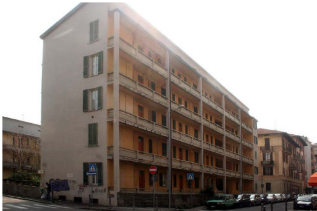
Fig. 7 Case Popolari Rechts: achterzijde

Als we iets verder doorlopen, passeren we de kruising van de via Mentana met links de via Ambrosoli en rechts de via Giulio Cesare en komen vervolgens bij de via Anzani. Op nr. 34 staan de Case Popolari IACP, ontworpen in 1939 door G. Terragni en A. Sartoris. Zoals eerder genoemd, ontwierpen deze twee architecten in 1938 de modelstad Rebbio voor arbeiders; een integraal plan voor een nog onbebouwd gebied aan de zuidkant van Como met flatgebouwen van zes verdiepingen, lage huizen met één of twee verdiepingen met scholen, een kerk, een stadion, sportvelden, groene gebieden op een orthogonaal stratennetwerk. Het plan is echter nooit gerealiseerd. Echter uit dit project zijn wel de case popolari in de via Anzani voortgekomen. Van de drie gebouwen die hier zouden komen, zijn er twee gerealiseerd, één met vier verdiepingen, het andere met twee verdiepingen boven de parterre.