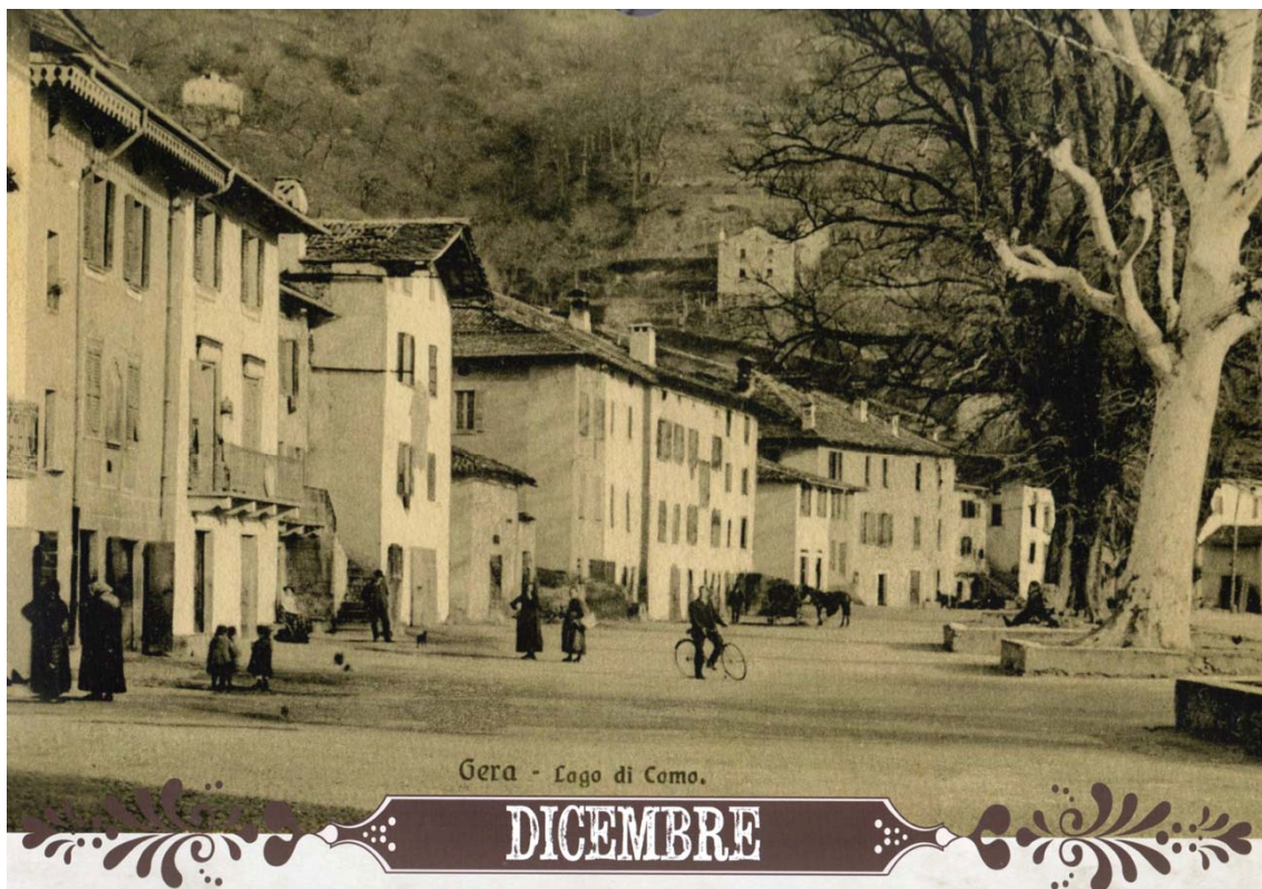
December. Foto genomen staande voor de kerk. Let op de grote olm op beide foto's.