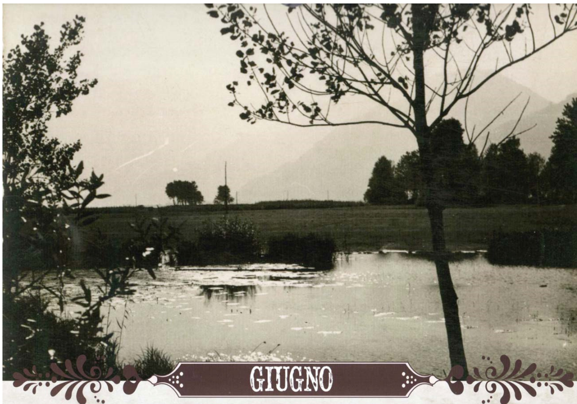
Juni. Foto bij S. Agatha, genomen in de richting van huidige winkelcentrum Fuentes.