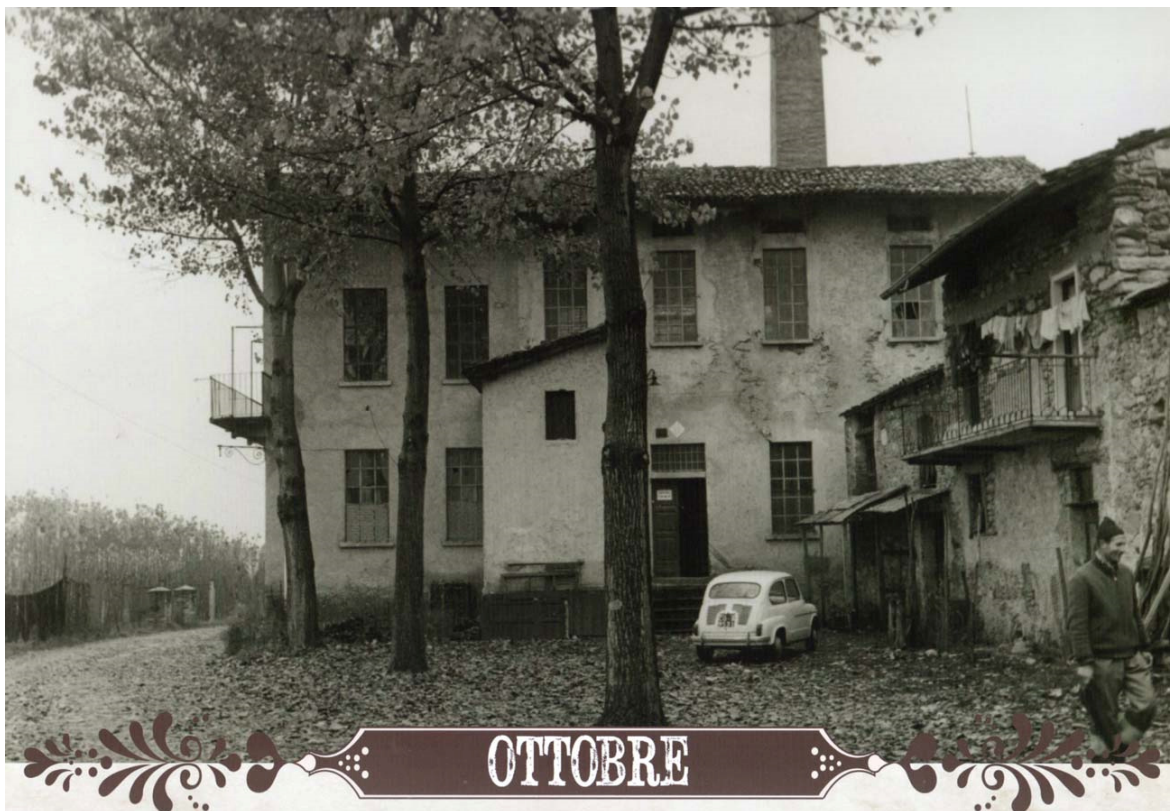
Oktober. De duidelijk herkenbare hoek bij het parkeerterrein naast de haven. Links loopt de Via Al Pontile naar de bootsteiger.