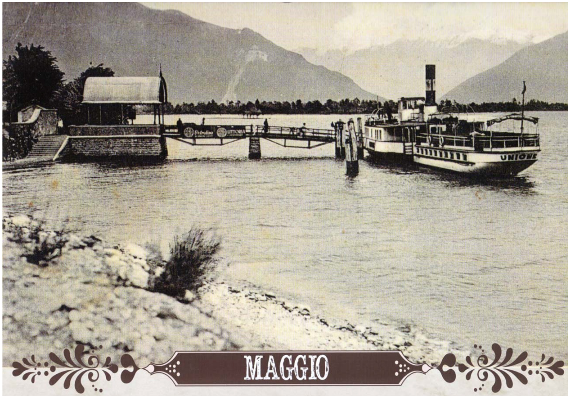
Mei. De nog altijd aanwezige steiger voor de schepen van de Navigazione Lago di Como. Het achterdek van deze zgn. 'piroscafo' is overdekt met tentdoek tegen de zon. Tot ca. 1980 legde de draagvleugelboot (de 'aliscafo') hier nog aan. Nu is Colico het eindpunt.