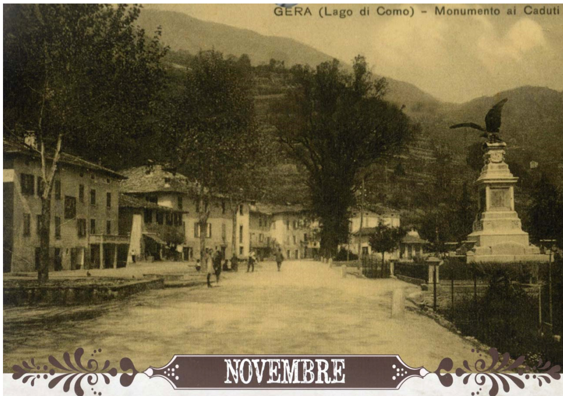
November. Foto genomen ter hoogte van de kerk. Behalve het monument voor de gevallen is er geen bebouwing aan de rechterkant van de weg. De weg ligt ook op vrijwel de zelfde hoogte als het dorpsplein en is pas verhoogd na de overstroming in 1951.