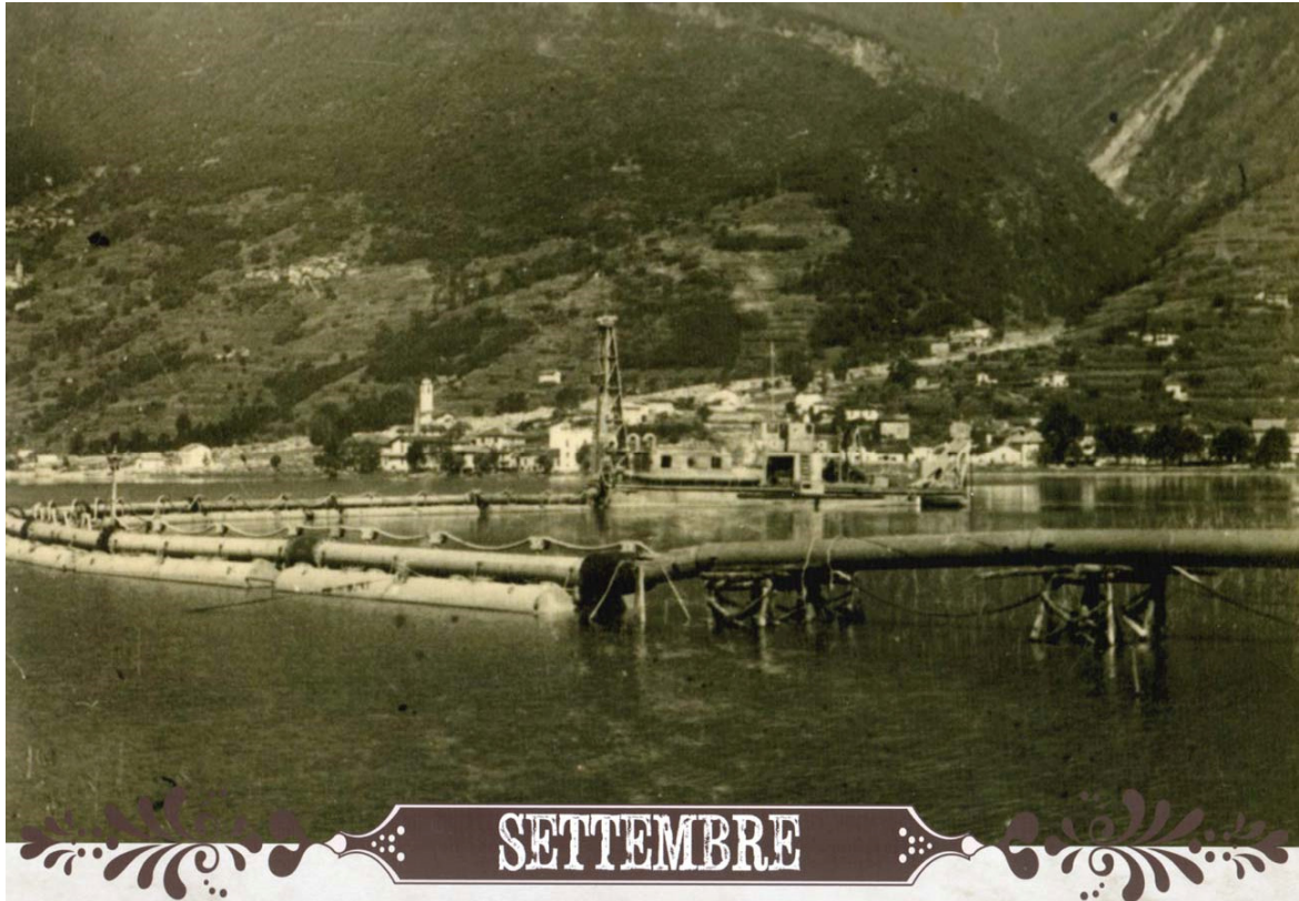
September. Het opsputten van het Pian di Spagna in 1945.