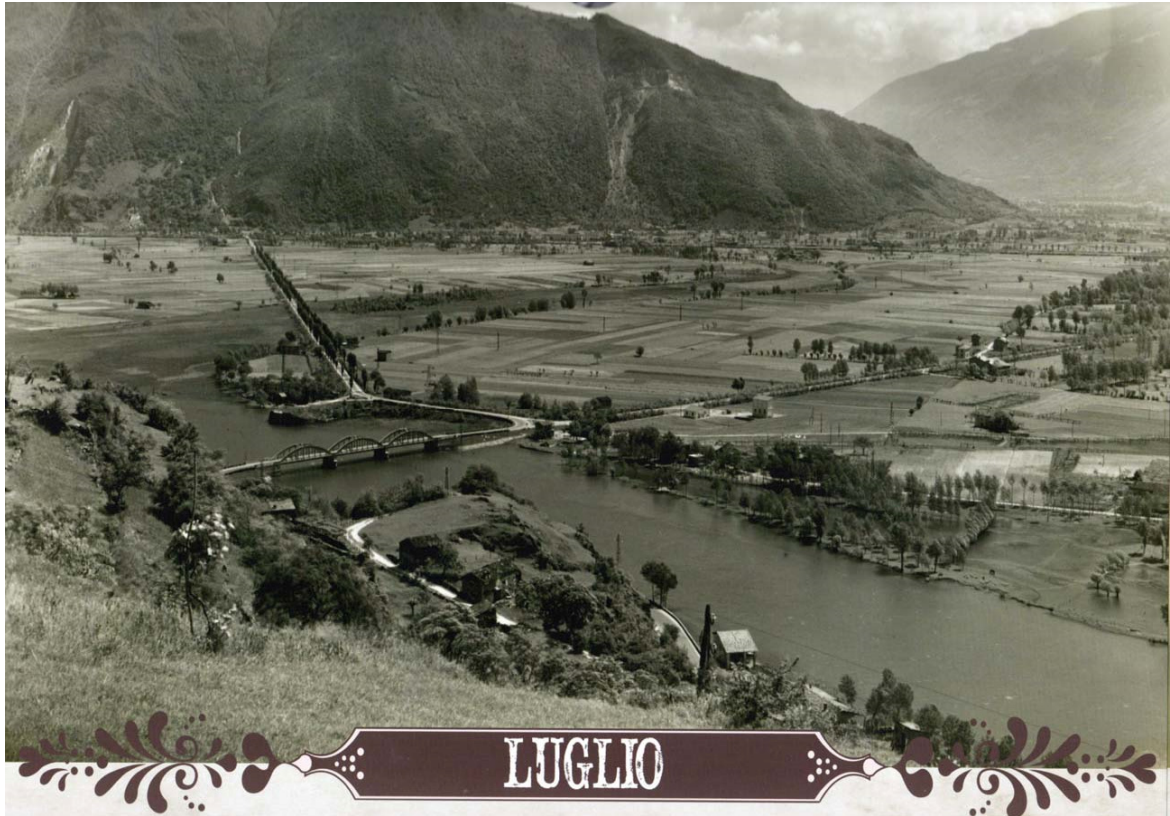
Juli. Het Pian di Spagna en de Ponte del Passo.