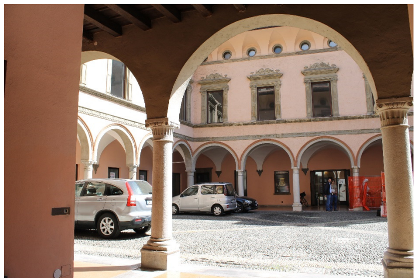
Links: Casa Vittani; boven: Palazzo Rusconi binnenplaats