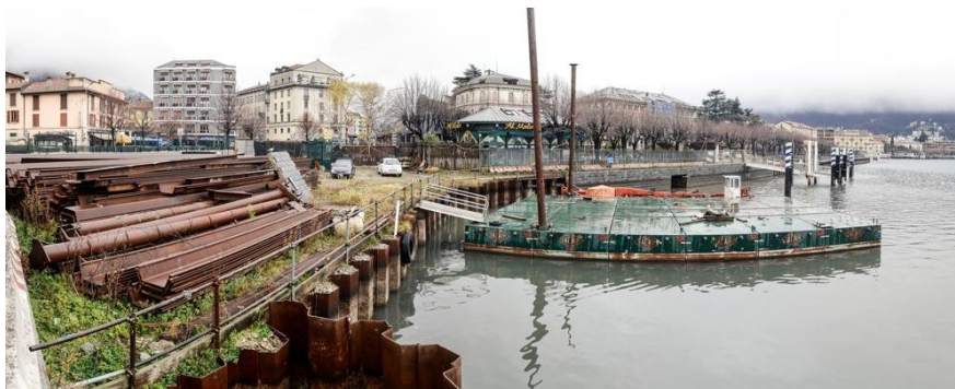
De situatie aan de haven sinds najaar 2013

In de tweede helft van het jaar werd begonnen aan een tweede variant, maar al snel kwam er een nieuw probleem: het Piazza Cavour verzakte 10 cm en toonde 5 m lange scheuren in de bestrating. Het werk werd gestaakt en in december 2011 werd besloten eerst een stalen damwand te slaan om verdere schade aan gebouwen en bestrating te voorkomen. De kosten van het project, oorspronkelijk begroot op 12 M€, waren op dat moment opgelopen tot 19 M€ en het was onduidelijk hoe men verder moest gaan. In december 2012 kwam het bericht dat het zeker tot het najaar van 2013 zou duren eer men het onderzoek had afgerond en met een nieuw plan zou komen. Een Zwitserse firma stelde een jaar later een opblaasbare waterkering voor, maar na rijp beraad werd dit plan verworpen.