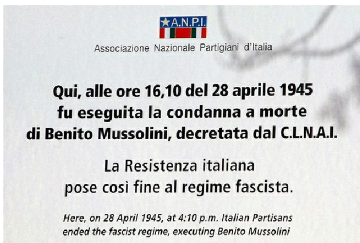
De gedenkplaat naast het hek van de villa waar Benito Mussolini en Clara Petacci gefusilleerd zouden zijn