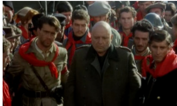
Rechts: de arrestatie van Mussolini in Dongo