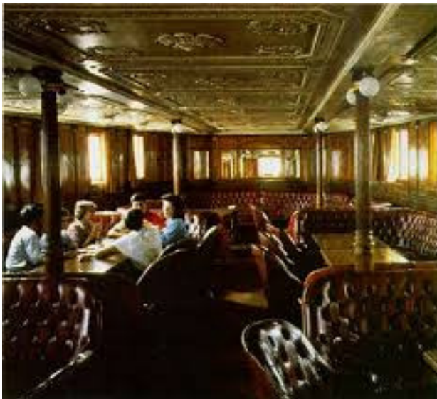
De salon van het schip

Het schip werd in 1902 gebouwd door de Zwitserse firma Escher&Wyss uit Zurich. De Plinio kon 500 passagiers vervoeren en 9 personeelsleden, bestaande uit de kapitein, stuurman, drie matrozen, vier man in de machinekamer en de kaartjes controleur. Het had een lengte van 53,16 m en breedte 11,50 m en was met 29 km/uur een van de snelste stoomschepen op het meer. Het interieur was luxueus, de wanden van de salon geheel in eikenhout afgewerkt met versieringen in donker mahoniehout. Ook was er een bar/restaurant aan boord. Die eerste jaren tot aan de 1 e Wereldoorlog was de periode van ongekennde activiteit en groot optimisme over de toekomst, die bekend staat als de Belle Époque. Stelt u zich het schip voor met op het dek onder een zeil tegen de directe zonnestrallen, de dames in hun lange witte japonnen met kantwerk en met fraaie hoeden, de heren in een chique kostuum, die een tochtje over het meer maakten om bij aankomst in de koetsjes te stappen die klaar stonden bij de aanlegsteiger.