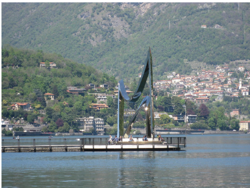
Het monument in de haven van Como

En om te eindigen met positief nieuws uit Como kan ik melden dat het monument van Liebeskind, dat in het begin zeer omstreden was, inmiddels is voltooid en op een prachtige plek, aan het einde van de golfbreker voor de haven is geplaatst. Rond het monument zijn bankjes geplaatst vanwaar je een prachtig gezicht op de stad en het meer hebt.