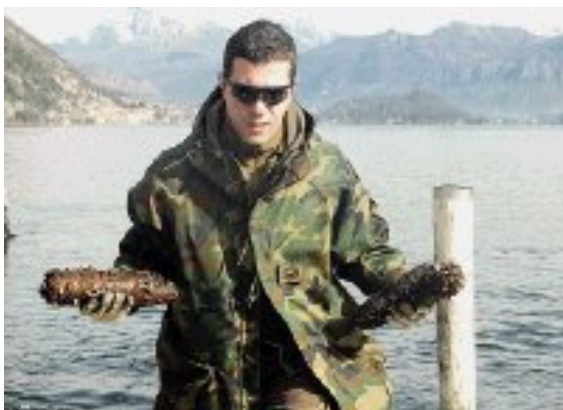
Iemand van de explosieven opruimingsdienst met in het meer gevonden bommen

In de loop van twintig eeuwen scheepvaart op het meer zijn er natuurlijk vele schepen gezonken. De enorme waterdiepte en de dikke laag modder op de bodem maken het vrijwel onmogelijk hier iets van terug te vinden. Wel zijn er bij onderwater opgravingen bij het eiland Comacina vele vondsten gedaan, die nu in het museum Antiquarium in Ossucio worden bewaard. Voor de haven van Menaggio liggen enkele gondels en een comballo en hetzelfde geldt voor Nobiallo, Dongo, Gravedona en Varenna. Tijdens de 2 e wereldoorlog is ook een postvliegtuig in het meer verdwenen. Voor het Grand Hotel Villa d’Este in Cernobbio lag een grote platte schuit die als zwembad diende, maar die eind jaren zestig is gezonken en nu op meer dan 40 m diepte ligt. Ook moeten er grote hoeveelheden wapens en munitie in het meer liggen in het gebied tussen Cernobbio en Dongo. Bij Blevio ligt een vliegtuig op 150-200 m diepte en in de buurt van Villa d’Este zijn enkele 200 tot 300 kg bommen in het water terechtgekomen. Bekend is ook dat toen Mussolini naar Zwitserland probeerde te vluchten er een 8 m lange motorboot met verwanten ter hoogte van Torno is gezonken.