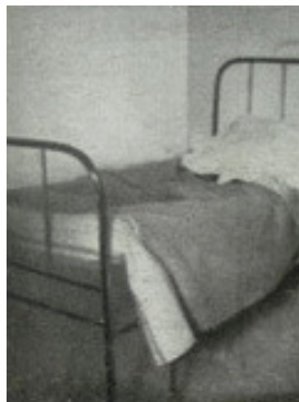
Links: het bed uit de kazerne in Germasino

Zoals ik beschreef in mijn boek “De geschiedenis van de tweede wereldoorlog aan het Comomeer”, werden Mussolini en zijn minnares Clara Petacci in de middag van 27 april naar Germasino gebracht nadat ze in Dongo uit de Duitse kolonne waren gehaald. De eigenaar van de enige herberg in het dorp bereidde het avondmaal voor de gevangenen die daarna naar de gevangenis in de kazerne werden gebracht. Het is de vraag of ze daar ook werkelijk hebben geslapen want om 1.30 u werden ze alweer uit hun cel gehaald. U had een bod kunnen uitbrengen van ten minste 5000 €, het bedrag dat een Zwitser al aan Chiaroni heeft geboden. Hoe het met het bed is afgelopen heb ik niet kunnen achterhalen.