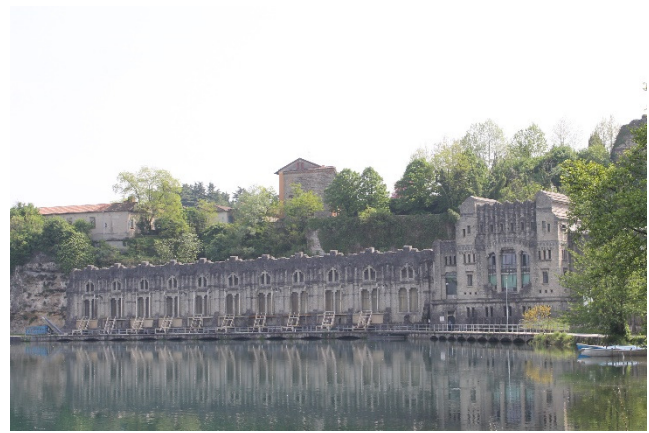
De centrale Taccani

Tussen de brug over de Adda en het Best Western hotel, gevestigd in de villa Appiani, loopt een voetpad omlaag, dat u ook naar het kasteel en de centrale brengt. Vanaf de brug heeft u ook een goed gezicht op de 42 m hoge kasteeltoren en de muren .