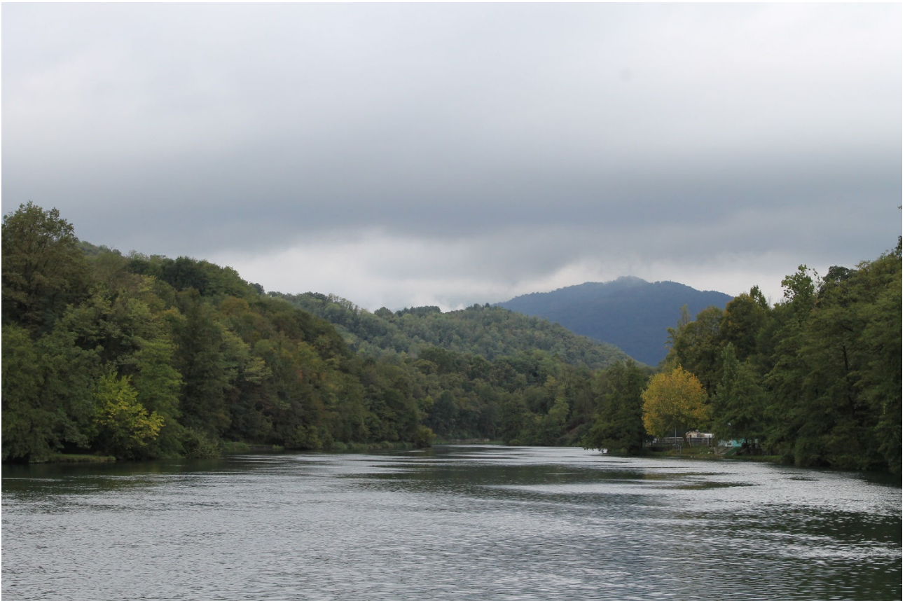
De Adda bij Imbersago

Het bevaarbare deel tussen Concesa en Canonica is landschappelijk bijzonder mooi. Leonardo heeft hier vele schetsen in Oost-Indische inkt en sepia gemaakt, die zich nu in de verzameling in Windsor Castle en de Bibliotheek Ambrosiana in Milaan bevinden als onderdeel van de Codice Atlantico.