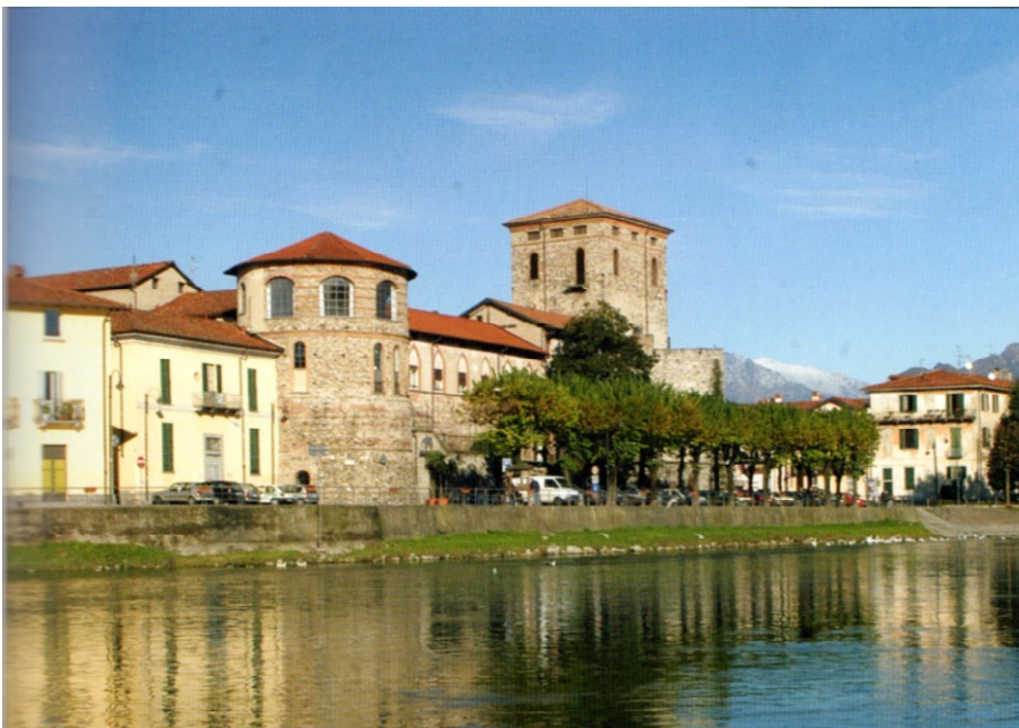
Kasteel in Brivio

In de Romeinse tijd kwam in dit dorp een kasteel dat een grote rol speelde bij de verdediging tegen de invallen van de barbaren in de 10 e eeuw. In die tijd was het eigendom van de graven van Lecco, in de 11 e eeuw van de bisschoppen van Bergamo en in de 13 e en 14 e eeuw van Visconti. Er staan nu nog twee ronde en één vierkante toren. In de 19 e eeuw werd het na jarenlange verwaarlozing in gebruik genomen als zijdefabriek.