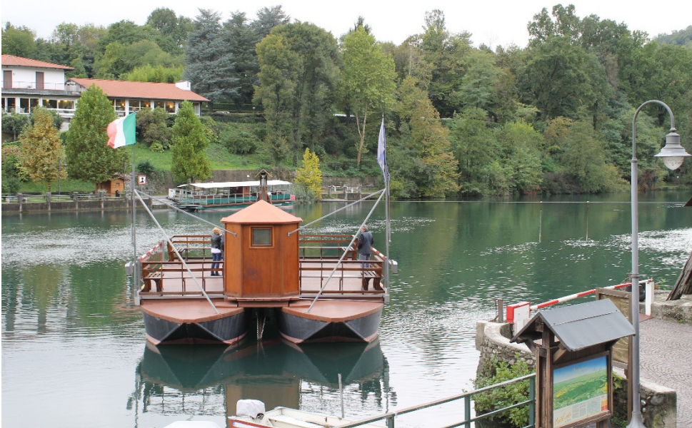
De pont van Leonardo

Bij de pont kunt u ook fietsen huren om het interessante, vernauwde stuk van de Adda met stroomversnellingen te volgen naar Trezzo.