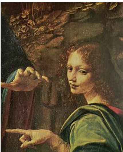
Leonardo's schilderij van de "Maagd van de Rotsen", nu in het Louvre in Parijs

De Forra is een grote canyon die door de rivier is uitgeslepen door de harde rotsen. Het natuurschoon tussen Robbiate en Trezzo heeft ook indruk gemaakt op Leonardo. In de buurt van het heiligdom Santa Maria della Rochetta, bij Cornate, maakte hij het befaamde schilderij La Vergine delle Rocce .