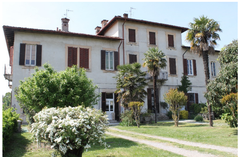
Links: De poort van villa Simonetti Archinto, het huidige gemeentehuis van Vaprio d'Adda