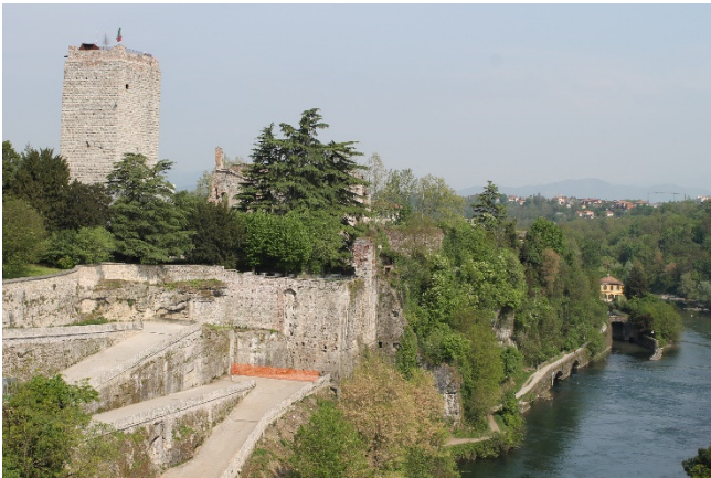
Het Visconti kasteel in Trezzo d'Adda

Als we vanaf Paderno de autoweg volgen via Cornate en Colnago komen we in Trezzo. Dit dorp werd al in de 4 e eeuw v.C. gesticht door de Kelten, waarna het zeven eeuwen lang onder Romeins gezag kwam. De Romeinen werden verjaagd door de Longobarden, die er een versterkte burcht van maakten. In opdracht van keizerin Teodolinda werd er in de 7 e eeuw een kasteel met torens gebouwd. Dit werd later verwoest, maar op dezelfde plaats ook weer herbouwd en in de 12 e eeuw bezet en aanzienlijk uitgebreid door Frederik Barbarossa. In 1167 namen de Milanezen het kasteel in en werd het gedeeltelijk verwoest en weer herbouwd tot het in 1324 definitief door Bernabò Visconti werd ingenomen. In 1385 werd hij door zijn schoonzoon Gian Galeazzo bij Milaan gevangen genomen en opgesloten in zijn kasteel in Trezzo, waar hij na enkele maanden overleed, waarschijnlijk door vergiftiging. Het kasteel bleef een belangrijke rol spelen in de verdediging van het gebied en werd onder de Spanjaarden ook gevangenis. Nadat het eeuwenlang werd verwaarloosd, werd het in 1891 gekocht door Cristoforo Benigno Crespi, die aan de voet van het kasteel de elektrische centrale Taccani liet bouwen. Op de Crespi familie kom ik in deel 2 van deze Nieuwsbrief uitgebreid terug. Sinds 1982 is het kasteel in bezit van de gemeente en kunt u het parkje er omheen binnenlopen. U kunt met de auto vanuit het dorpscentrum omlaag rijden tot aan de oever van de rivier en de centrale.