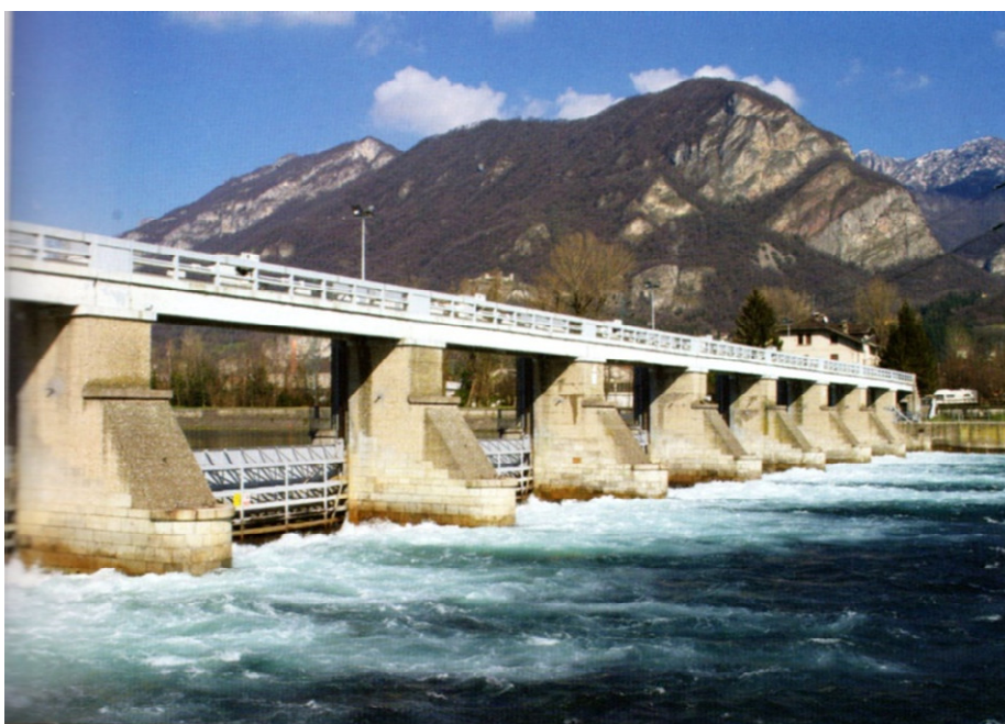
De dijk van Olginate

Informatie over het park kunt u, behalve op de website, ook krijgen in het bureau van het park in Concesa di Trezzo op de via Padre Benigno Calvi 3.