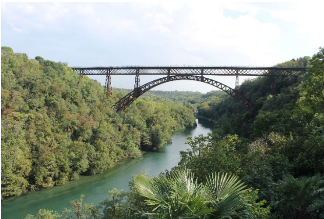
De Ponte San Michele