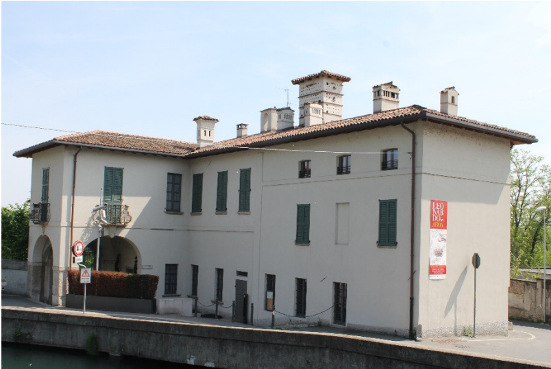
Het “casa del Custode delle Acque”

heeft veel bekende personen gehuisvest, o.a. de prinses van Savoie en de Nederlandse schilder Gaspar van Wittel die in 1719 door Noord-Italië trok en tijdens zijn verblijf in Vaprio schetsen van het huis maakte, die hij later uitwerkte in zeven prachtige schilderijen met “gezichten op Vaprio”. In 1740 maakte een schilder uit de Veneto hier in opdracht van graaf Simonetta vier “gezichten op Vaprio en Canonica”, waarvan er één nu in het Metropolitan Museum in New York hangt. Het huis is in 2010 geheel gerestaureerd en herbergt sinds 2014 de galerij “Leonardo in Adda” en ook het toeristenbureau. Tegen het plafond van de portico bij de ingang zien we nog een fraai fresco.