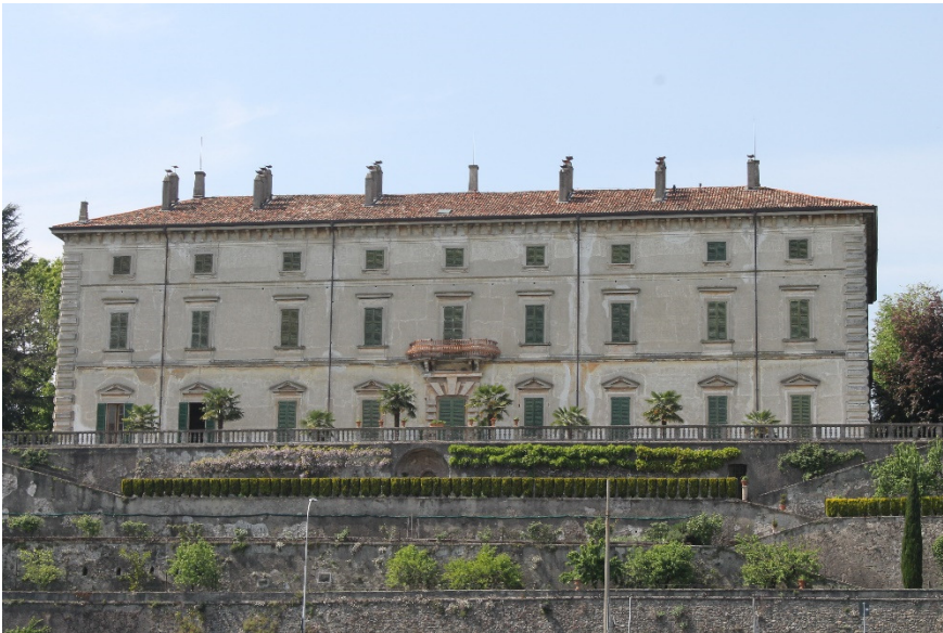
Villa Melzi gezien vanaf de Adda

aan de overwonnene liet hij een brug bouwen die hij de naam Pons Aureoli gaf. Het is niet bekend wat er met de brug is gebeurd, maar in 1160 werd een nieuwe brug, die door de Milanezen was gebouwd, door Frederik Barbarossa in brand gestoken. Meerdere houten bruggen die op deze plaats lagen, werden bij hoge waterstanden van de rivier door de stroom verwoest. In de eerste helft van de 19 e eeuw kwam er een ijzeren en daarna een betonnen brug. De huidige brug met een enkele boog heeft een lengte van 90 m. In de 13 e eeuw was Vaprio een belangrijke aanlegplaats voor de boten die over het Naviglio della Martesana voeren. De familie Melzi had van 1663 tot 1800 de concessie voor deze aanlegplaats.