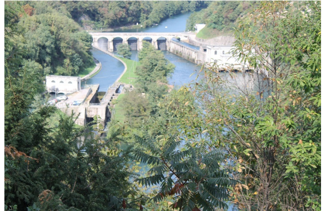
Gezicht op de centrale Semenza vanaf de Ponte San Michele