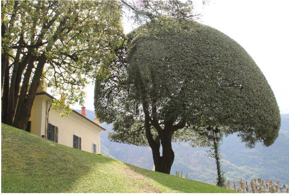
8. De kamferboom naast de villa