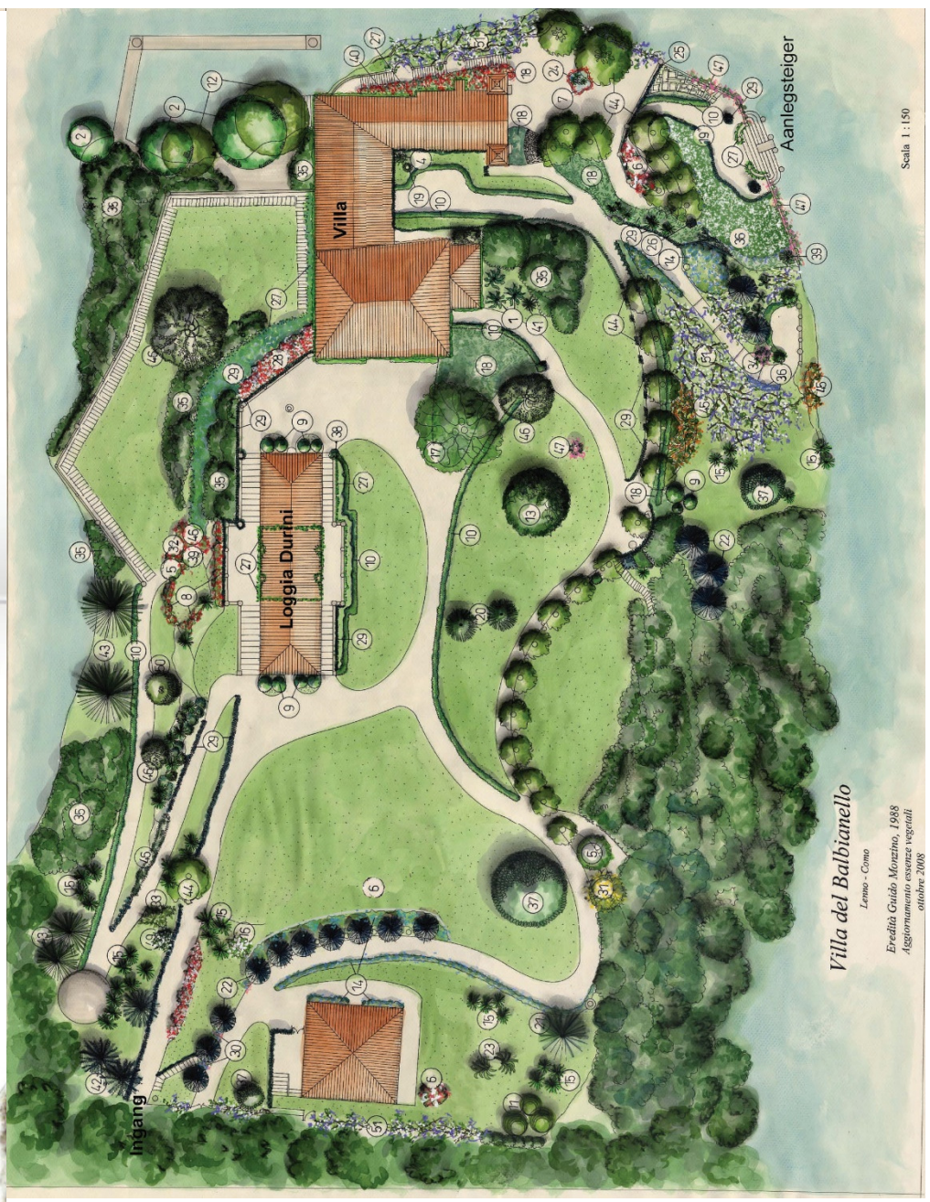
Plattegrond van de tuin – tekening van Giulia Trabella, beschikbaar gesteld door de Fondo Ambiente Italiano (FAI)