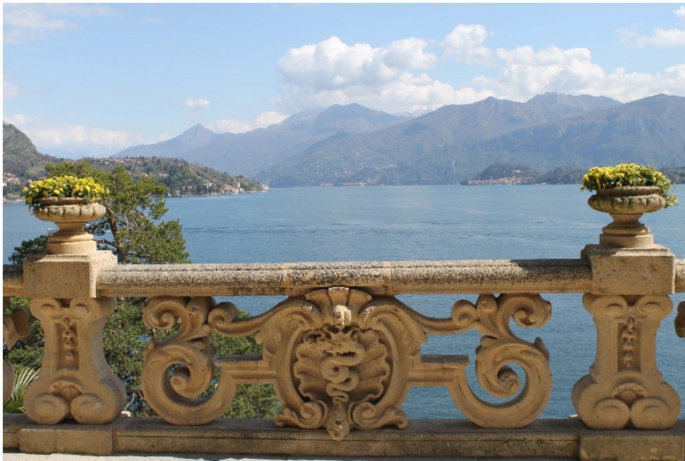
6. De balustrade van de loggia met het wapen van Arconate Visconti

Op het plateau achter de loggia staat een oude, altijd groene steeneik en links voor de loggia naast de villa een grote kamferboom, gesnoeid in parasolvorm.