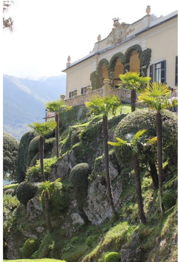
12.. Rechts: de steile helling bij de loggia van Durini met palmen

de kandelaber gesnoeide platanen. Staaltjes van vormsnoei ziet u op vele plaatsen, niet alleen bij de platanen maar ook bij de in parasolvorm gesnoeide kamferboom en bij de steeneik bij de ingang van de villa. Het was overigens Monzino die opdracht gaf om deze eik zo te snoeien omdat hij vanuit zijn studeerkamer de besneeuwde top van de Monte Legnone wilde zien. Door de ligging van de tuin tegen de steile helling hebben we op ieder punt een adembenemend uitzicht over het meer. Opvallend zijn de vele klimplanten, zoals die rond de zuilen van de loggia en rond de zuilen bij de bootsteiger. In het voorjaar wordt al het groen onderbroken door de prachtige blauwe regens op verschillende plaatsen in de tuin, bijvoorbeeld op het terras voor de ingang van de villa en in het "Liefdesnest", waar u een tweehonderd jaar oud exemplaar kunt bewonderen. Tegen de zijgevel van de villa staat een zoetgeurende sterjasmijn. Kardinaal Durini liet op vele plaatsen beelden zetten en Monzino voegde hier nog een aantal aan toe. Monzino was zo verknocht aan de villa dat zijn laatste wens was om hier ook begraven te worden. U vindt zijn graf in de voormalige ijspuit, de plaats waar men vroeger ijs en sneeuw bewaarde voor de warme dagen in het voorjaar en de zomer.