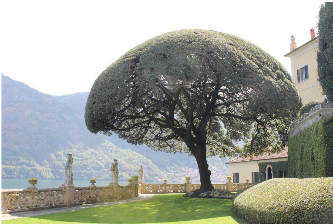
10. Het terras achter de villa met de groenblijvende steeneik en een balustrade met beelden

Geheel beneden is een moderne, ruime keuken met daarnaast nog een klein gastenverblijf met woonkamer, slaapkamer en bad. Deze mooie kamers waren voor de moeder van Monzino als die een enkele keer vanuit haar villa in Padua naar Balbianello kwam.