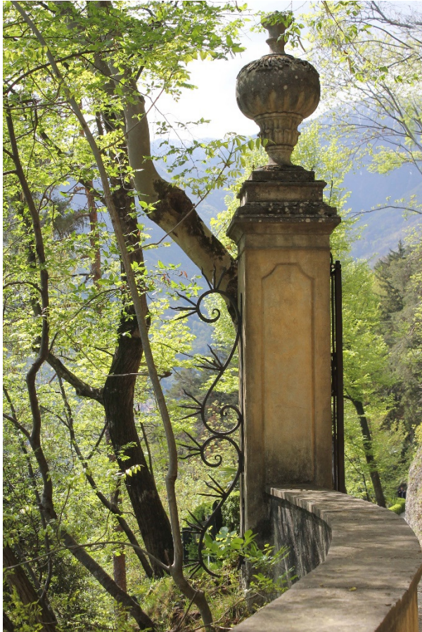
3. Het hek bij de ingang