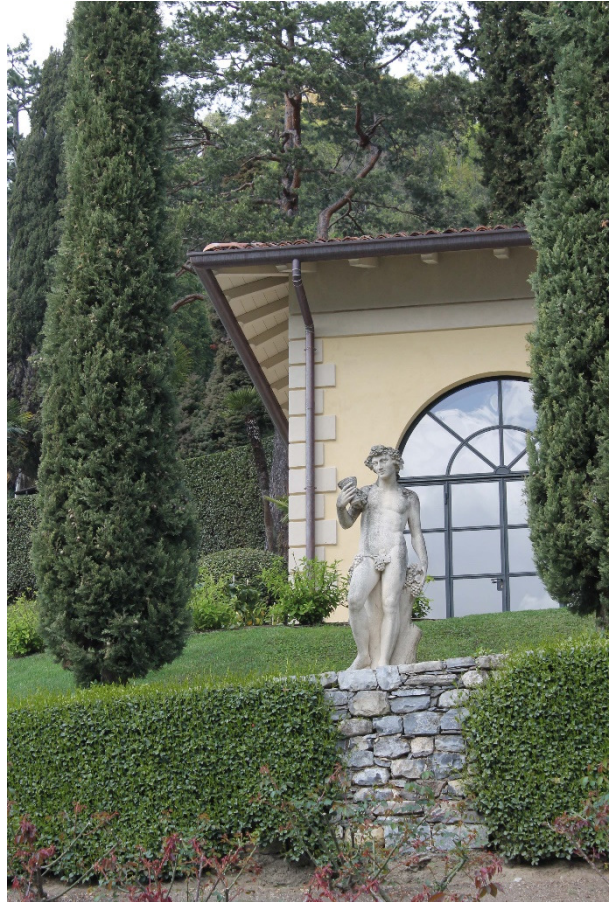
4. De loggia Segrè naast de ingang