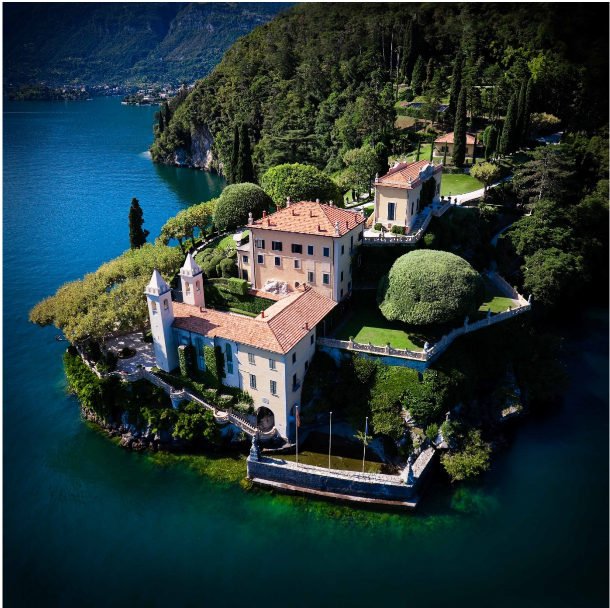
1. Luchtfoto van de villa - Foto Alesso Mesiano 2009 ©Fondo Ambiente Italiano