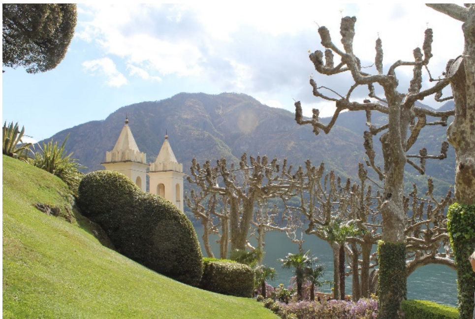
7. De rij platanen met de villa op de achtergrond