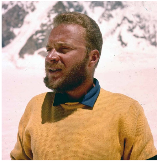
2. Guido Monzino tijdens de poolexpeditie Kamjuit 1959.