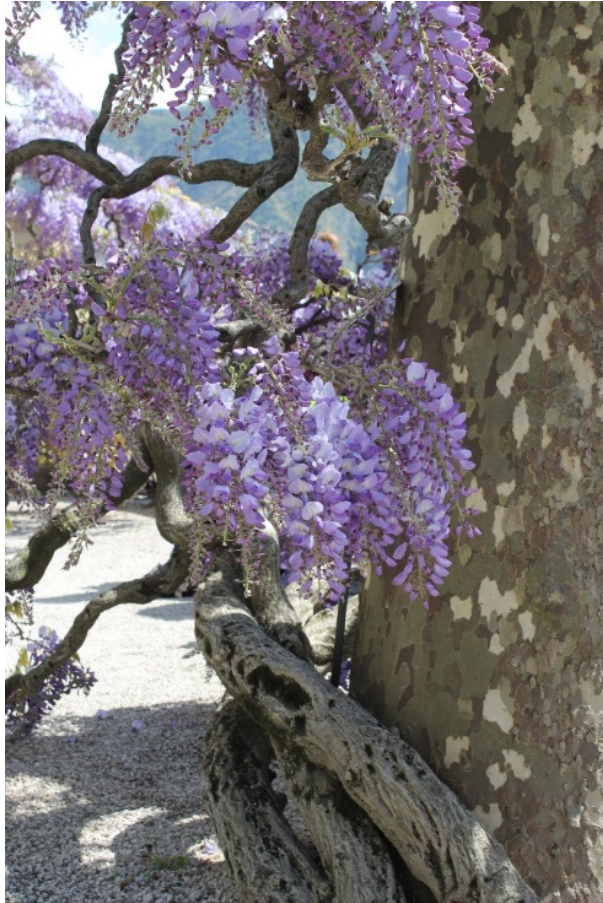
11. Links: één van de vele oude wisteria's;