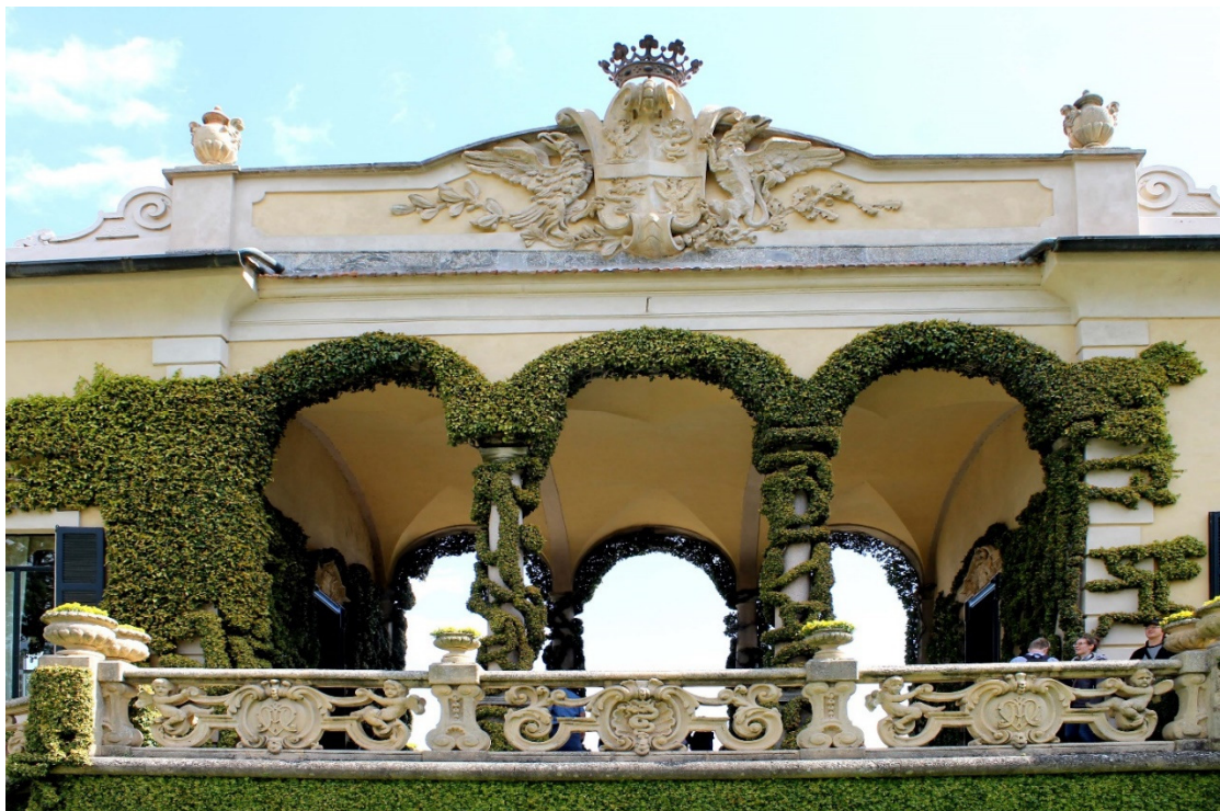
5. De loggia van kardinaal Durini