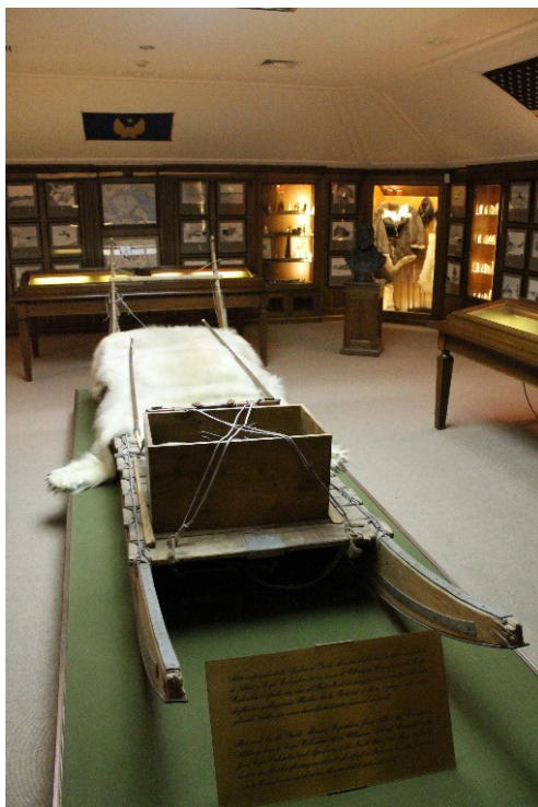
9. De slee van Monzino's Noordpoolreis

De eerste zaal, de “zaal van de primitieven”, bevat een verzameling Afrikaanse en Midden-Amerikaanse kunst met o.a. vele terracotta figuren van de Maya's .