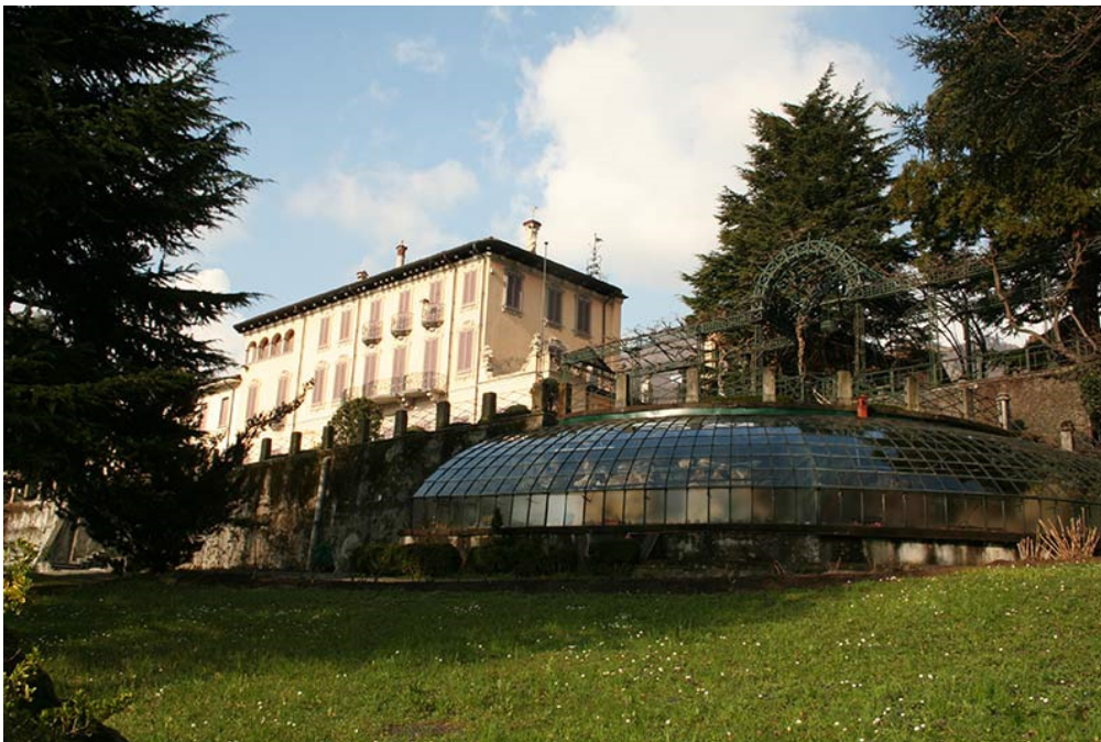
Gezicht op de achterzijde van de villa met pergola en plantenkas

Het mooist zijn echter de tuinen, met een oppervlak van circa 7000 m 2 verdeeld over drie niveaus. De niveaus zijn door trappen met elkaar verbonden met aan het eind een fontein die versierd is met mozaïek van stenen. Door de tuinen lopen paden met aanduidingen van de vele soorten vegetatie. Er is ook een met gele pijlen aangegeven wandeling uitgezet. Al we omlaag gaan komen we in de Italiaanse tuin met bossages en kunstwerken. Nog een niveau lager bereiken we het grootste deel van de tuin met wandelpaden die een goed gezicht bieden op alle bijzonderheden: de oude plantenkas, de ondergrondse tunnel, de majestueuze ceders en beuken, de karakteristieke fontein Portaluppi. In het centrum van de formele tuinen staat de fontein Ballabio met de decoratie die in geen 19 e eeuwse tuin mocht ontbreken, de ninfeo, een kunstmatige grot. De oude plantenkas wordt onderhouden door de CFA, Centro Flora Autoctona, een stichting die zich ten doel stelt oude, inheemse planten te beschermen. Maar waar u zich bevindt in de tuin, vrijwel altijd heeft u een prachtig uitzicht over het Lago d'Annone.