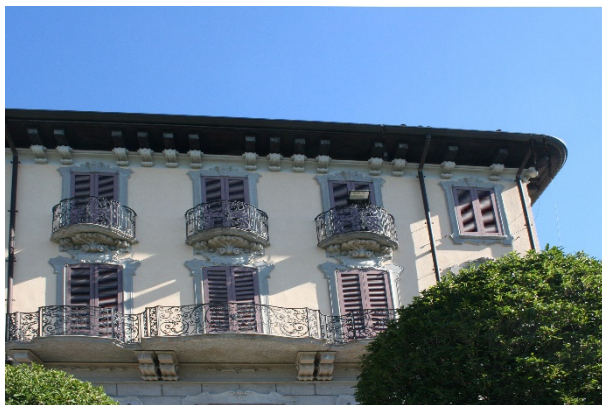
Achtergevel en loggia