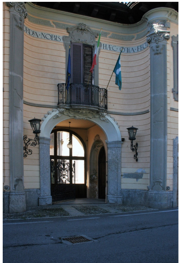
De entree van de villa Bertarelli