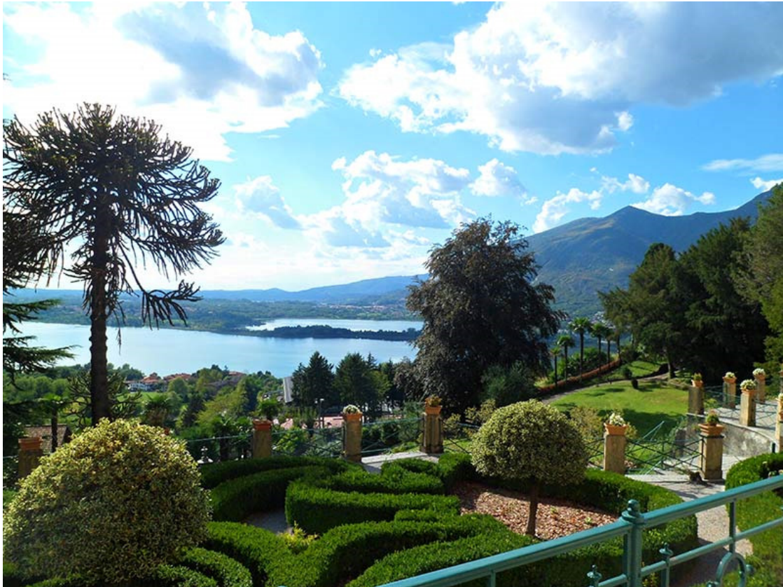
De tuinen met op de achtergrond het meer van Annone