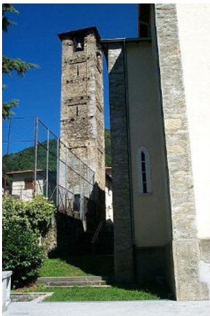
De campanile van de San Bartolomeo-kerk

In de apsis zien we de gebruikelijke afbeelding van de Eeuwige Vader , geflankeerd door de vier Evangelisten . Tegen de zijmuren zien we vijf fresco's die oorspronkelijk op de gevels van huizen in het dorp zaten: links een 15 e -eeuws triptiek met de Madonna met Kind op de troon en Johannes de Doper en Sint Rocco aan de linker en rechterkant . Binnen de kerk zijn veel van de oorspronkelijke decoraties bewaard gebleven. In het priesterkoor zien we een 18 e -eeuws altaar in veelkleurig marmer met daarnaast een fresco uit 1710 met de Kroning van de Maagd tussen Heiligen . Naast een aantal 17 e -eeuwse schilderijen vinden we in de kapel links een 17 e -eeuws doek met S. Bartolomeo en twee 17 e -eeuwse houten beelden van S. Rocco en S. Sebastiaan .