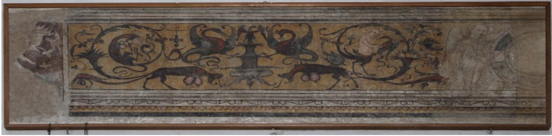
Fries in de kerk van Johannes de Doper in Cusino

Na Cusino komen we in de gemeente San Bartolomeo, bestaande uit een zestal buurtschappen. Wat lager gelegen, iets links van de doorgaande weg, ligt Sora vlak bij het riviertje de Cuccio; de parochiekerk staat wat hoger, in Vora. Deze parochiekerk, gewijd aan S. Bartolomeo, wordt al in 13 e -eeuwse geschriften genoemd. Sora is bekend om zijn kerststal met levende beelden.