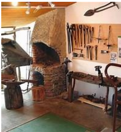
De zaal met het verhaal over de ijzerwinning en fabricage in het museum in Cavargna

Uit San Nazzaro zien we in westelijke richting het dorp Cavargna al liggen aan de voet van de Monte Garzirola, waar op de kam het kerkje van S. Lucio staat. De weg gaat nu over de Cuccio, we passeren de afslag links naar het Val Rezzo en komen in Cavargna (1071 m), de hoogst gelegen gemeente in de provincie Como. We kunnen hier voor het gemeentehuis parkeren. Vanuit het dorp leidt een voetpad in circa 1,5 uur naar de S. Luciopas en het gelijknamige kerkje (1541 m). Het kerkje, daterend uit de 15 e eeuw, staat op de Zwitsers-Italiaanse grens en is gewijd aan de herders en kaasmakers. De verering van S. Lucio uit Cavargna dateert al uit de 13 e eeuw en in de 15 e eeuw komen er al pelgrims uit heel Noord-Italië naar het kerkje.