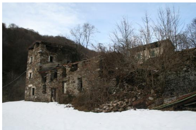
Forni Vecchi