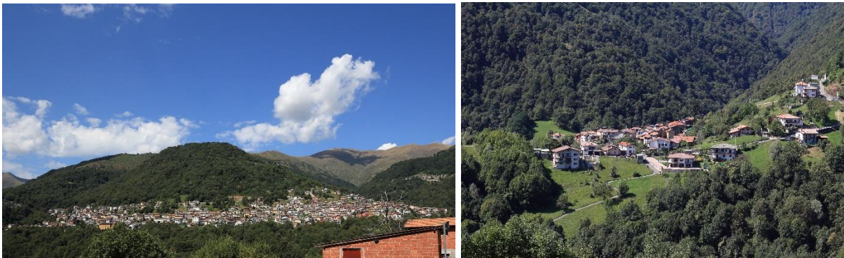
Gezicht op San Bartolomeo (links) en op Sora (rechts)

Na Cusino komen we in de gemeente San Bartolomeo, bestaande uit een zestal buurtschappen. Wat lager gelegen, iets links van de doorgaande weg, ligt Sora vlak bij het riviertje de Cuccio; de parochiekerk staat wat hoger, in Vora. Deze parochiekerk, gewijd aan S. Bartolomeo, wordt al in 13 e -eeuwse geschriften genoemd. Sora is bekend om zijn kerststal met levende beelden.