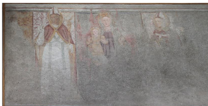
Links: De kerk van Johannes de Doper in Cusino, Boven: fresco van de Maagd tussen twee heiligen