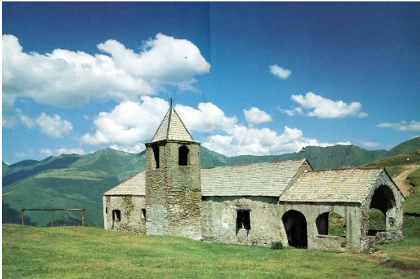
Links het kerkje van San Lucio, rechts een schilderij van de heilige die kaas uitdeelt aan de behoeftigen

Het kerkje ligt op de grens tussen Italië en Zwitserland. Zeer waarschijnlijk was hier al een Romeins tempeltje voor de reizigers die over de pas gingen. De typisch Romeinse naam Lucio werd teruggevonden op een grafscript of herdenksteen op deze plaats. Het kerkje werd gewijd aan de heilige (een herder) Luguzzone, Uguzo of ook Uguccione, die in de 13 e - 14 e eeuw hier werd vermoord. Oorspronkelijk had het een enkel schip, maar in de 18 e eeuw werd het vergroot. Binnen zijn verschillende fresco's bewaard gebleven o.a. een scenes uit het leven van San Lucio en een 18 e -eeuws fresco met de Glorie van San Lucio , toegeschreven aan Giovan Battista Pozzo, een schilder uit het naburige Valsolda. Het verhaal gaat dat San Carlo Bartolomeo een pastoraal bezoek bracht aan het kerkje en vastbesloten de steile klim naar het kerkje voltooide. Onderweg echter werd de tas met zijn etenswaar gestolen en sindsdien worden de inwoners van het dal wel aangeduid als "de eters van de snacks van San Carlo".