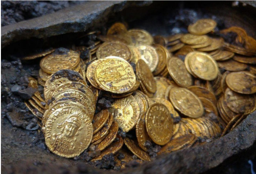
De goudschat van Como

Bij graafwerkzaamheden in de Via Diaz in Como werd in september een amfoor gevuld met gouden, Romeinse munten gevonden. Naast de munten lagen er ook drie gouden oorringen en werden er drie ringen aangetroffen waarin een steen had gezeten. De munten zijn intussen met water schoongemaakt en na telling blijken het er precies 1000 te zijn met een gewicht van circa 4,5 gram per stuk. De jongste van de munten zijn uit de periode 472-474 n.C. , de oudste zijn uit de eerste periode van het keizerrijk. Op de plaats waar de munten werden gevonden stond een 19 e -eeuws theater maar uit een eerste verder onderzoek is al duidelijk dat er eerder een veel groter gebouw heeft gestaan.