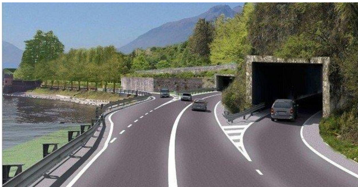
Zo moet de tunnel bij Griante er uit gaan zien

Vele van u zullen hebben ondervonden dat het stuk van de Via Regina in de gemeente Tremezzina een enorme hindernis voor het verkeer oplevert. Als vrachtwagens of autobussen elkaar tegenkomen in een van de smalle bochten dan staat alle verkeer vast. Al sinds 2007 wordt er gepraat over de aanleg van een tunnel van 9,8 km lengte die bij Colonno zou moeten beginnen. Na jarenlang overleg met provincie, rijk en milieugroepen lijkt het project, dat 330 miljoen Euro moet gaan kosten, dichterbij te komen. Als de goedkeuring nog dit jaar wordt verleend zal men begin 2020 aan het werk kunnen beginnen.