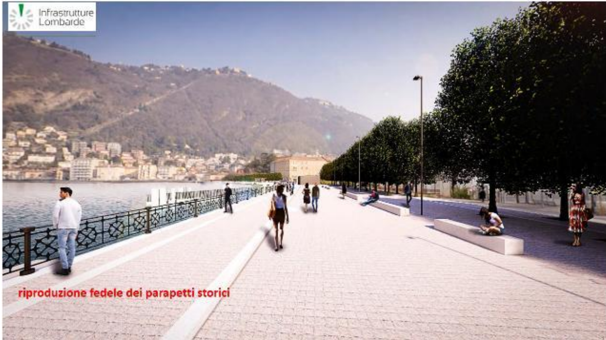
Impressie van de wandelboulevard langs het meer

Dat de waterkering niet overbodig is, bleek nog zeer recent. De waterstand in het Comomeer was in het voorjaar al laag en door de uitzonderlijk droge zomer is het peil vanaf 1 juni alleen maar verder gedaald. In één maand tijd was de daling 80 cm. Dit leidde tot krantenberichten waarin verschillende gemeenten klaagden dat er door de lage waterstand allerlei schade optrad: wegzakkende oevers en funderingen van kademuren die boven water kwamen (zie bijvoorbeeld de foto van het monument bij de oude haven van Gera Lario). Het probleem bleef bestaan tot het laatste weekend van oktober, toen er boven heel Lombardije een noodweer losbarstte en er in korte tijd enorme hoeveelheden water omlaag kwamen. Dit resulteerde in een water instroom in het meer van 1189 m 3 /s, terwijl er bij geheel geopende sluisen in Olginate, slechts 364 m 3 /s door de Adda kon worden afgevoerd. Het gevolg was dat het peil op 31 oktober 121 cm was gestegen en klotste het water al over het trottoir van het Piazza Cavour in Como.