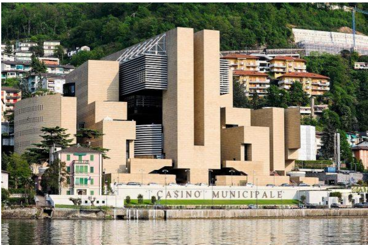
Gezicht vanaf het meer van Lugano op het casino

Het gemeentebestuur heeft zijn ontslag aangeboden en het is tot nu toe geheel onduidelijk wat er gedaan zal worden. Deze onzekerheid heeft al geleid tot vele demonstraties en een bezetting van het gemeentehuis door boze inwoners.