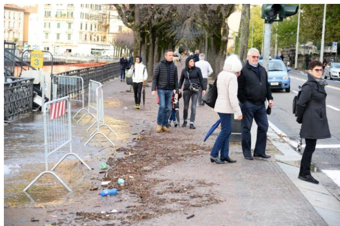
Links: Gera Lario tijdens de extreem lage waterstand op 18 oktober 2018; rechts: op 30 oktober begint het water al over het trottoir aan de waterkant van het piazza Cavour in Como te stromen