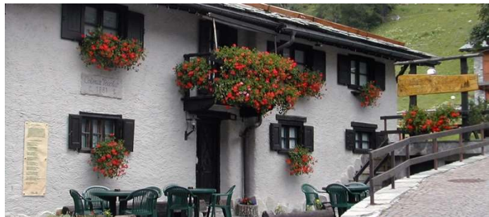
Links: gedenkplaat die in 1907 op Villa Adele werd aangebracht; rechts: Osteria Vegia