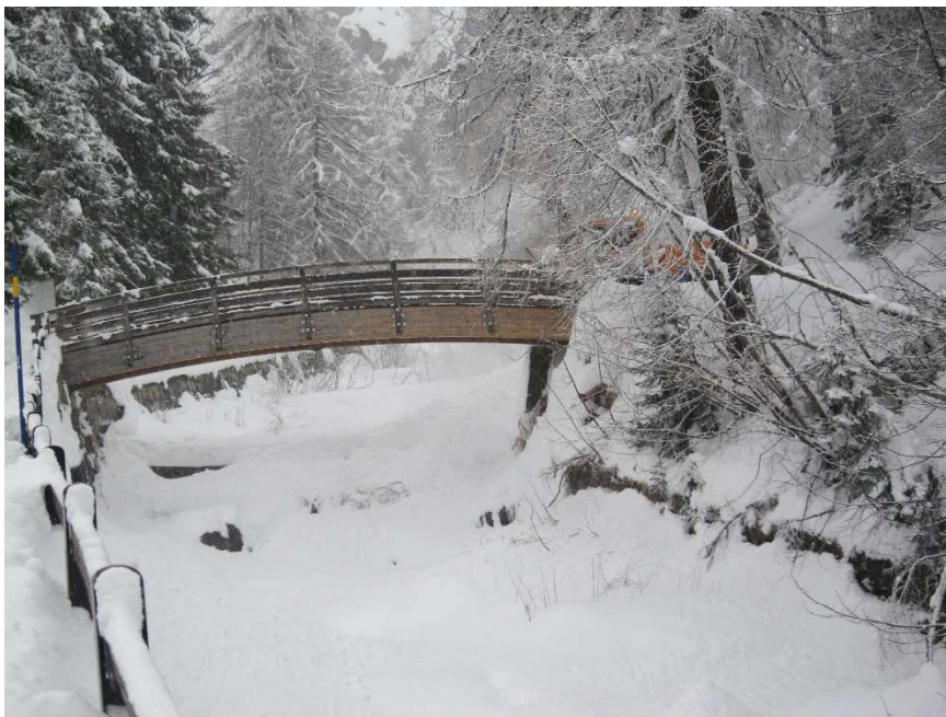
Winters beeld van het riviertje Scaleoggia in Madesimo

In de Sala Mostra is een permanente tentoonstelling over Carducci te zien.