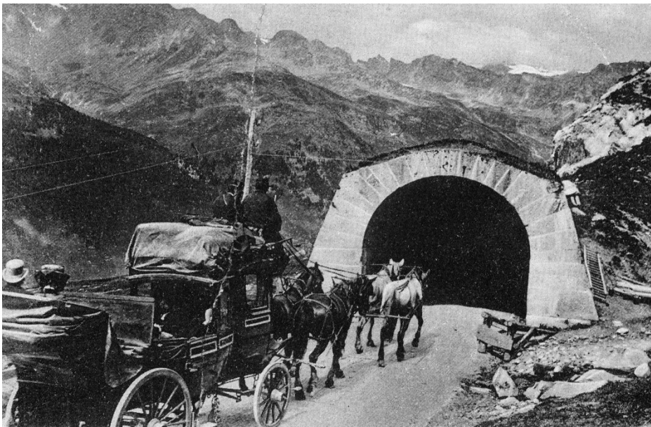
Een landauer getrokken door vier paarden op de weg naar de Spluga

In de grote krans van de Alpen, over het graniet Verlaten en kleurloos, over stralendwitte gletsjers Heerst met intense en oneindige rust Het middaguur, in zijn grote stilte. Dennen en sparren onberoerd door de wind Gericht naar de zon die er doordringt Als met het geluid van snaren beweegt slechts Het water dat slingerend tussen de stenen stroomt