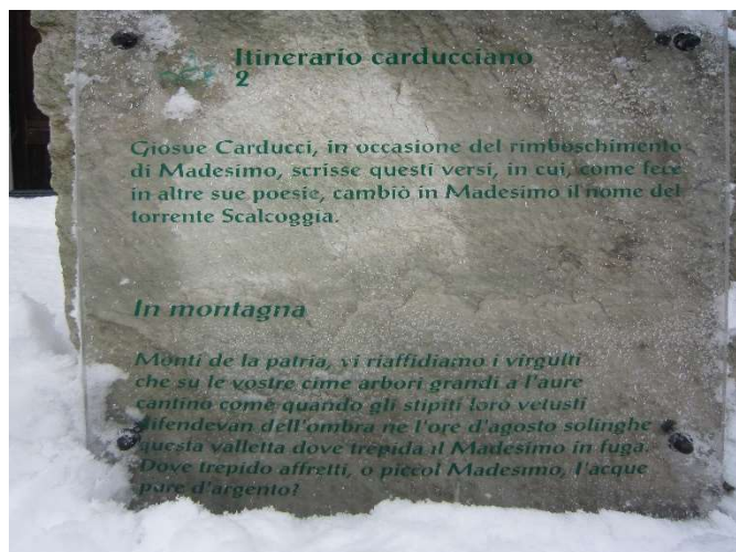
Herinneringen aan de dichter langs het “sentiero Carducci”

Een beslist aan te raden tochtje begint op de grote parkeerplaats in Campodolcino (1082 m). Daar neemt u de kabelbaan, de ‘Sky Express’ naar Motta (1721 m). Hier begint een aardige wandeling over het ‘Sentiero Carducci’ dat u in ruim 20 minuten door de bossen naar Madesimo brengt, een wandeling die de dichter ook graag maakte en waarbij U ook de plaats van de zgn. Carducci stoel passeert. Na de wandeling zou u, zoals Carducci regelmatig deed, een glas wijn