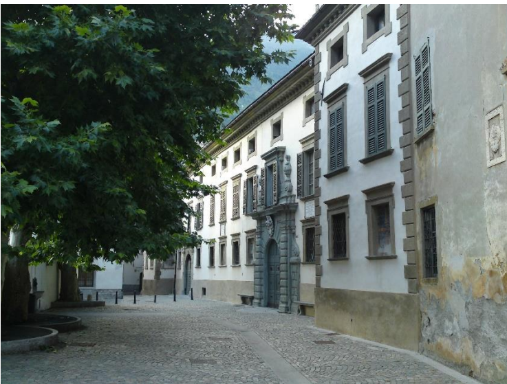
De voorgevel van het palazzo Salis, nu museum