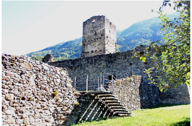
Links: Een van de oude stadspoorten, de Porta Milanese met daarachter een kapel; boven het kasteel van S. Maria

Als we rechts de via Trivigno volgen komen we op nr. 6 bij een portaal met een rondboog en bij een splitsing een kapelletje tegen het huis op nr. 5, met vier openingen. Op het altaar staat een doek uit de 17 e eeuw met de Aanbedene aan de voet van het kruis met twee huilende, geknielde engelen en in vier ovalen Episoden uit de passie . De via Trivigno volgend bereiken we de resten van het kasteel van S. Maria, ook wel Castellaccio genoemd. Dit was een belangrijk onderdeel van het verdedigingssysteem van de stad, waarvan nu alleen nog de massieve toren en wat steenresten staan. We lopen nu weer terug, nemen de via S. Maria, overgaand in de via Ludovico il Moro en komen dan weer op de via Pergola tot het piazza Parravicini, waaraan het gelijknamige 17 e -eeuws palazzo ligt. Er tegenover staat in een nis een fontein met achthoekig bassin. Aan dezelfde kant staat het kerkje van de Addolorato, waarin enkele kostbare schilderijen en stucwerk uit de 17 e -18 e eeuw. Vroeger was dit de kapel van de Parravicini en nu is het eigendom van de familie Merizzi.