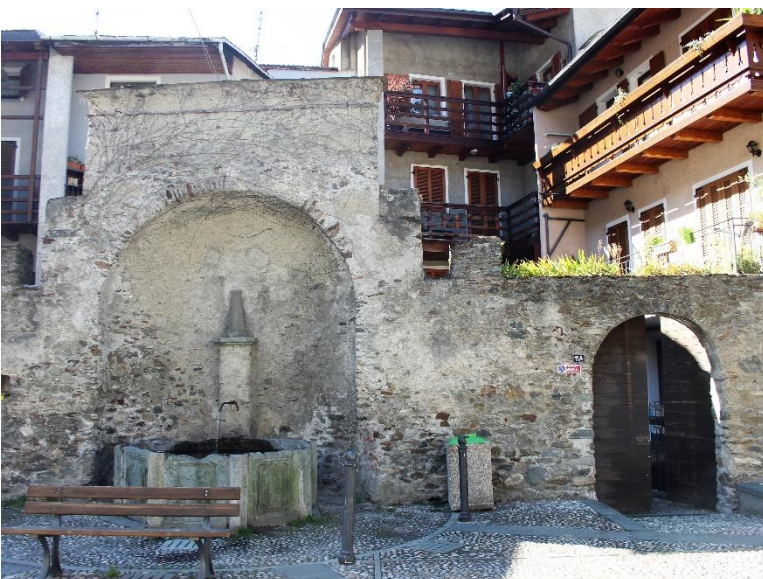
Achthoekige fontein op het piazza Parravicini

Als we rechts de via Trivigno volgen komen we op nr. 6 bij een portaal met een rondboog en bij een splitsing een kapelletje tegen het huis op nr. 5, met vier openingen. Op het altaar staat een doek uit de 17 e eeuw met de Aanbedene aan de voet van het kruis met twee huilende, geknielde engelen en in vier ovalen Episoden uit de passie . De via Trivigno volgend bereiken we de resten van het kasteel van S. Maria, ook wel Castellaccio genoemd. Dit was een belangrijk onderdeel van het verdedigingssysteem van de stad, waarvan nu alleen nog de massieve toren en wat steenresten staan. We lopen nu weer terug, nemen de via S. Maria, overgaand in de via Ludovico il Moro en komen dan weer op de via Pergola tot het piazza Parravicini, waaraan het gelijknamige 17 e -eeuws palazzo ligt. Er tegenover staat in een nis een fontein met achthoekig bassin. Aan dezelfde kant staat het kerkje van de Addolorato, waarin enkele kostbare schilderijen en stucwerk uit de 17 e -18 e eeuw. Vroeger was dit de kapel van de Parravicini en nu is het eigendom van de familie Merizzi.