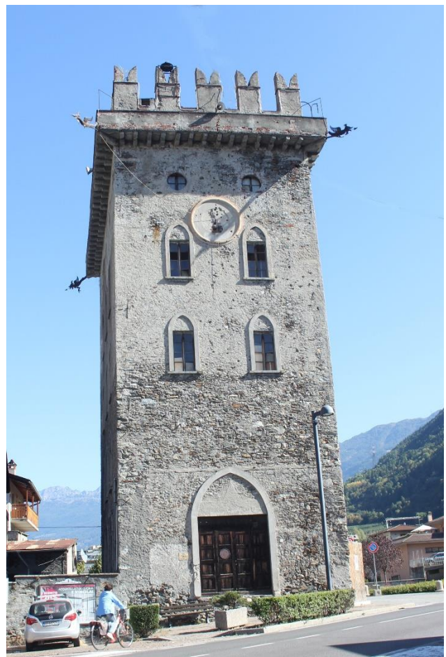
Links: palazzo Torelli, rechts Torre Torelli