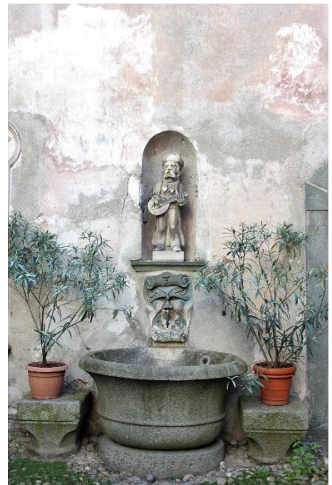
Boven: binnenplaats van palazzo Merizzi, met rechts de fontein op de binnenplaats

Aan het eind van de straat staan twee opmerkelijke huizen; links het vroegere huis van de gedeputeerde Merizzi; rechts, op nr. 52, dat van de vroegere familie Omodei-Ciboldi, nu Noli-Pradella, met een elegant hof uit de 18 e eeuw en mooi smedijzeren balkon.