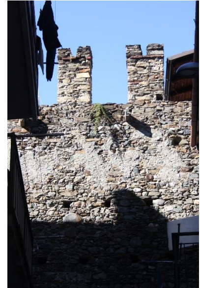
Foto's uit via Torelli; links een mooie waterspuwer, rechts een stukje stadsmuur

Iets verder op de hoek met de via della Repubblica, staat de indrukwekkende Torre Torelli, met een neo-middeleeuws uiterlijk, gebouwd in de tweede helft van de 19 e eeuw. Aan het eind van de via Torelli, rechts, in een kort steegje, vinden we de resten van een muur met zogenaamde ghibellijnse kantelen (d.w.z. met de bovenkant in de vorm van een V), waar een gebouw staat met een brede entree, twee spitse vensters en hoger een driehoek met dekplaten van serpentijn op meer verdiepingen. Dit gebouw, dat nu verwaarloosd is, heeft zijn hoofdingang in de via Bellotti nr. 17, waar we nog een hoog portaal met spitsboog zien en het wapen van de Quadrio familie. Het complex dateert uit de tweede helft van de 15 e eeuw en behoorde waarschijnlijk aan Serafino Quadrio. Op nr. 16 van dezelfde straat is nog een Quadrio huis, het laatste dat deze familie bezat; dit heeft een portaal met stenen architraaf en houtsnijwerk, dat leidt naar een hofje met twee vensters met een wapen van de Quadrio boven twee monochroom geschilderde engelen met tuba's en vlaggen. De arcade daaronder leidt naar een volgend hof met rechts een balkon waaronder een portaal met geruwde steen (bossage) en vensters met elegante smeedijzeren roosters. Een uitgang aan het eind van het hof leidt naar de via Stelvio 25.