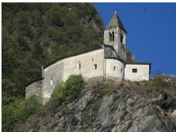
Het kerkje van S. Perpetua

Ernaast ligt de ruïne van een zgn. xenodochio, een overnachtingsplaats voor reizigers en pelgrims. Langs de oostkant van het plein lopen de rails waarover de Bernina Express van de Retische Bahn vanaf het station Tirano door de vallei van Poschiavo langs de Berninagletsjer naar Sankt Moritz gaat. In de zomermaanden is dit een zeer aantrekkelijk uitstapje, waarbij u ook op verschillende stations onderweg kunt uitstappen.