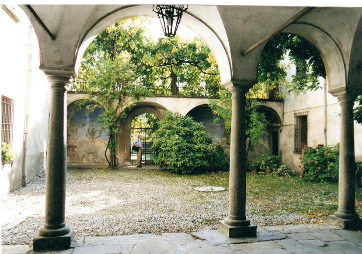
Binnenplaats in Via Venosta

Verder doorlopend in oostelijke richting komen we in de via Visconti Venosta, een van de interessantste en karakteristiekste straten van het oude Tirano. Op nr. 1 ligt het palazzo Visconti Venosta, met ervoor een tuin; hier woonden in hun jeugd de broers Emilio en Giovanni Visconti Venosta, waarvan de eerste een befaamd politicus en de tweede een bekende schrijver werd. Het huis heeft een prachtige grote trap (18 e eeuw) en daarboven een portaal met een balkon.