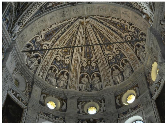
De kerk van de Madonna en rechts de koepel van de kerk