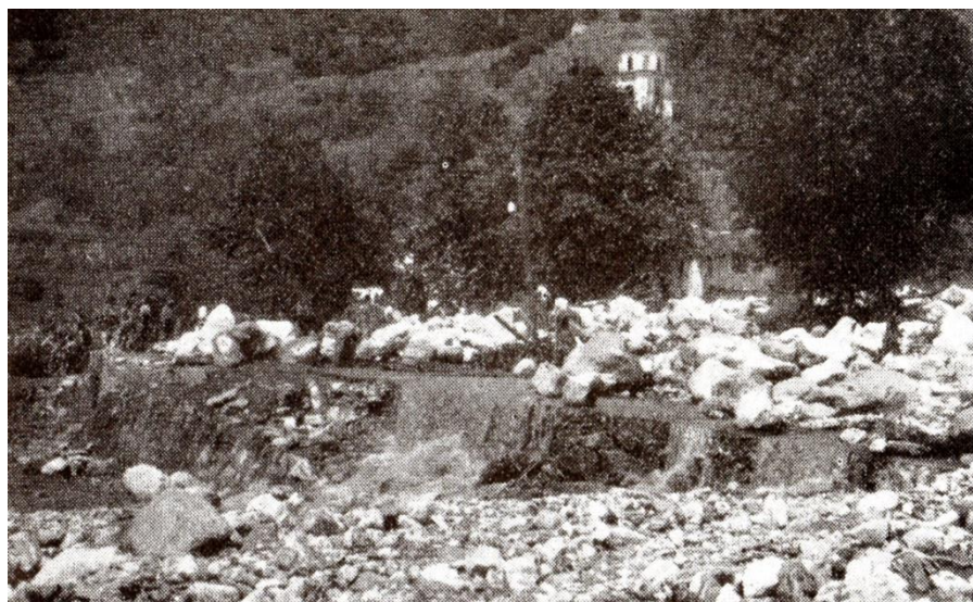
Fig. 1 De brug over de S. Vincenzo volkomen versperd door rotsblokken

Op 8 augustus 1951 werd het dorp Gera Lario getroffen door de ernstigste overstromingsramp uit haar geschiedenis 1 . Dagenlange regens in het najaar 1950, overvloedige sneeuwval in de winter en sterke regenval in het voorjaar hadden de ontboste terreinen ernstig ondermijnd. Op 7 augustus goot het de hele dag van de regen. Gedurende de nacht en vroege ochtend van de 8 e was er een ware wolkbreuk in de bergen, waardoor het riviertje de S. Vincenzo in Gera grote hoeveelheden water en modder te verwerken kreeg. Nog slechts enkele jaren eerder was het bed van de S. Vincenzo over 500 m versterkt met gemetselde stenen. Toch werd dit bed al spoedig zwaar beschadigd door de grote steenmassa's en andere meegesleepte materialen. Grote rotsblokken dreigden de doorgang bij de brug over de provinciale weg te versperren en binnen een uur raakte ook de monding van het riviertje verstopt. Vele mannen uit het dorp probeerden met behulp van balken de massa te verschuiven, maar het was onbegonnen werk. Wat hoger op begon ook de gemetselde muur langs de rivier af te breken. Om 11 uur luidden de noodklokken. Tegen de middag hield de regen even op en nam ook de hoeveelheid water door de rivier wat af. Men haalde opgelucht adem.