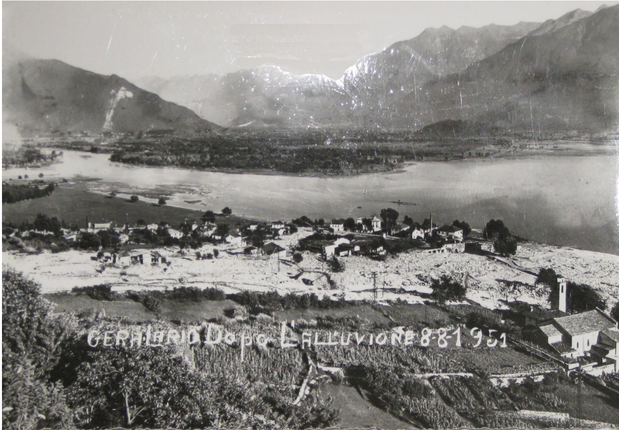
Fig. 3 Overzichtsfoto van het dorp na de ramp