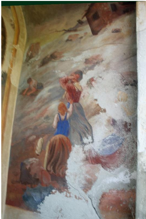
Fig. 7 Fresco in de kapel aan de Via Antica Regina dat de overstroming uitbeeldt

De vraag rijst natuurlijk waarom men niet tijdig vluchtte. Ook in 1920 was er een enorme overstroming geweest, waarbij een groot gebied bedekt werd met stenen en modder, de weg versperd raakte en water de huizen binnenstroomde. Daarbij werd echter niemand gewond en omdat het al zo lang geleden was, verwachtte niemand zo'n grote ramp. Er kwam nog bij dat de rivier op zich, hoewel sterk gezwollen en flinke schade aanrichtend aan de omgeving, niet in staat geweest zou zijn om de huizen te verwoesten. In feite was de waterstroom zelfs minder verwoestend dan in 1920. Ook de riviertjes de S. Miro in Sorico, de Livo in Domaso, de Liro in Gravedona en de Albano in Dongo traden ver buiten hun oevers, maar hier bleef het water stromen terwijl de ramp in Gera werd veroorzaakt door de vloedgolf die het gevolg was van de toestand diep in de vallei.