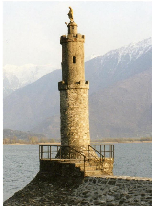
Fig. 6 Links de herdenkingskapel uit 1954, rechts het Mariabeeld op de havenpier uit 1957