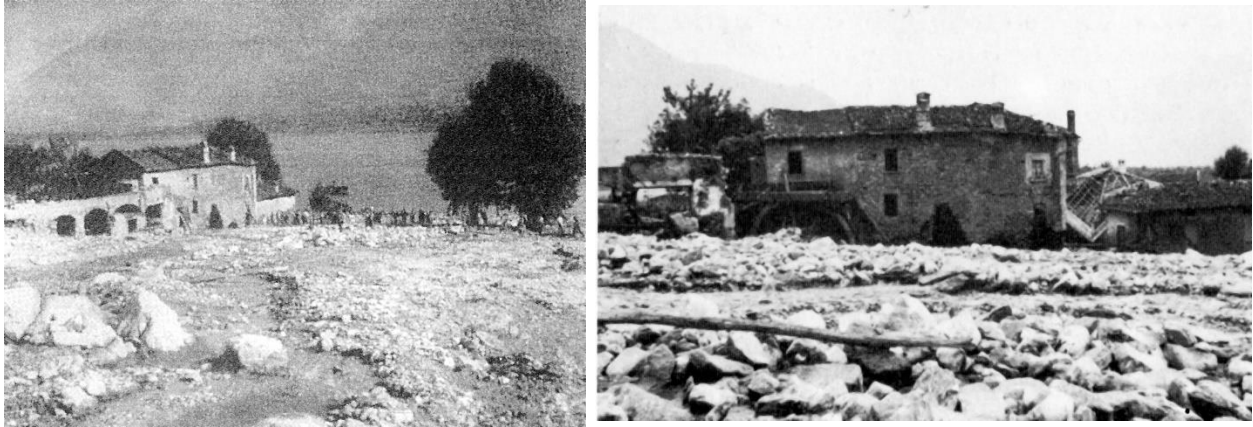
Fig. 2 Na de doorbraak

doen en men probeerde nu alleen nog de deuren van de huizen te barricaderen tegen het water en de stenen. Wat niemand in de gaten had, was dat hoger in de bergen bij Trezzone en Montemezzo, door de wolkbreuk de rivier versperd raakte en er meertjes werden gevormd. Om 14.15 uur brak een van de gevormde dijkjes door en kwam er een vloedgolf omlaag die alles op zijn weg meesleepte met een bulderend geraas dat tot in Colico was te horen. Aan de kant van de kerk was een rotswand die de kerk beschermde, maar aan de andere kant was er niets dat het geweld tegenhield. Huizen en stallen werden meegesleurd het meer in. Enorme rotsblokken kwamen omlaag en verpletterden telefoon- en elektriciteitspalen, waardoor alle verbindingen werden verbroken.