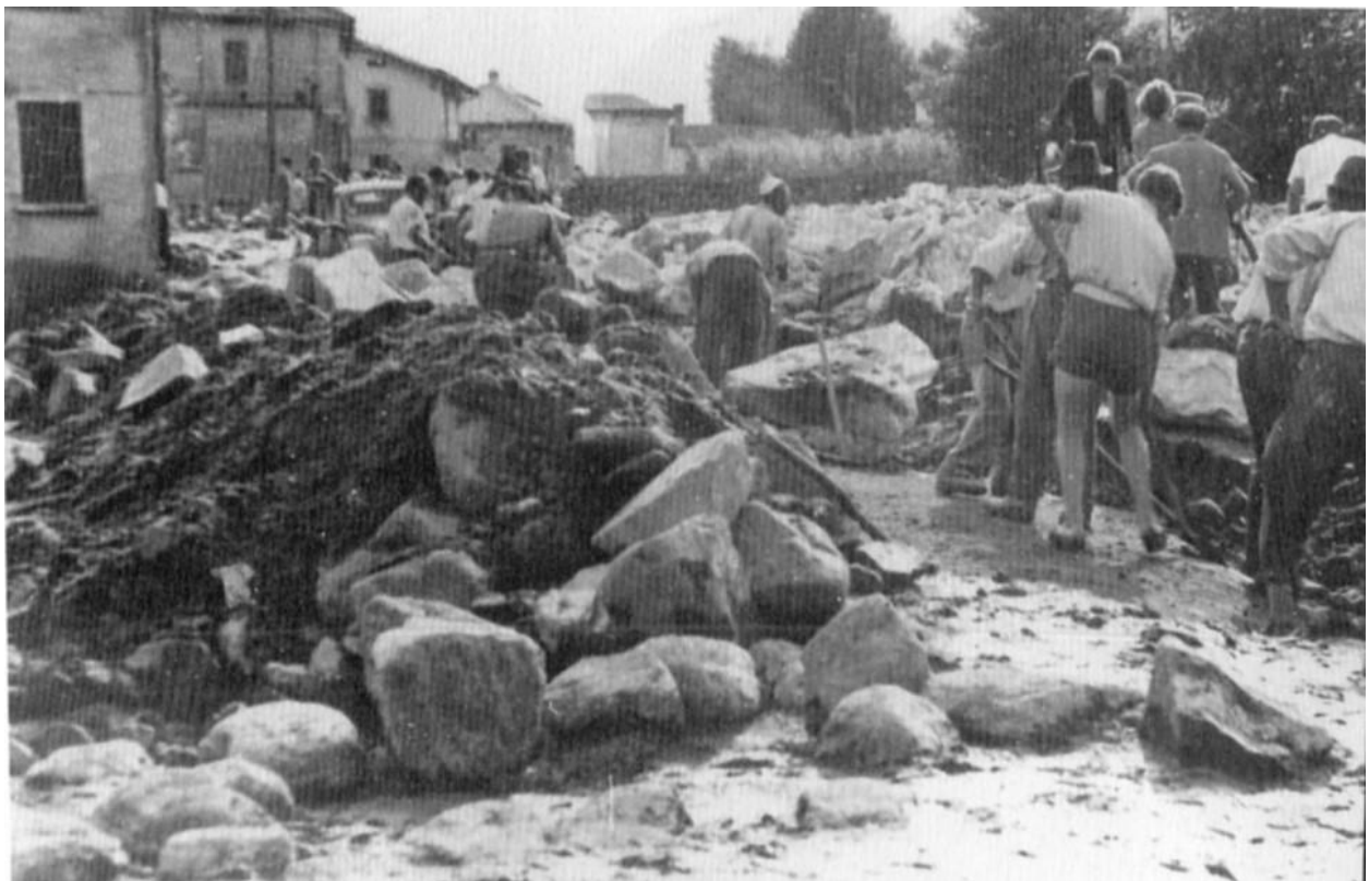
Fig. 4 Iedereen uit het dorp hielp bij het opruimen