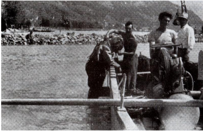
Fig. 5 Duikers vonden twee lichamen terug

Zes huizen, zeven stallen, een kantoor en een werkplaats zijn verdwenen. 27 mensen werden meegesleurd, 13 werden nooit meer teruggevonden, twee overleden in het ziekenhuis en van twee werd het lichaam later door duikers teruggevonden. In totaal werden er 12 mensen door vissers gered, zei het vaak met zware verwondingen. Vele instanties kwamen te hulp om de zwaar getroffen gezinnen te helpen.