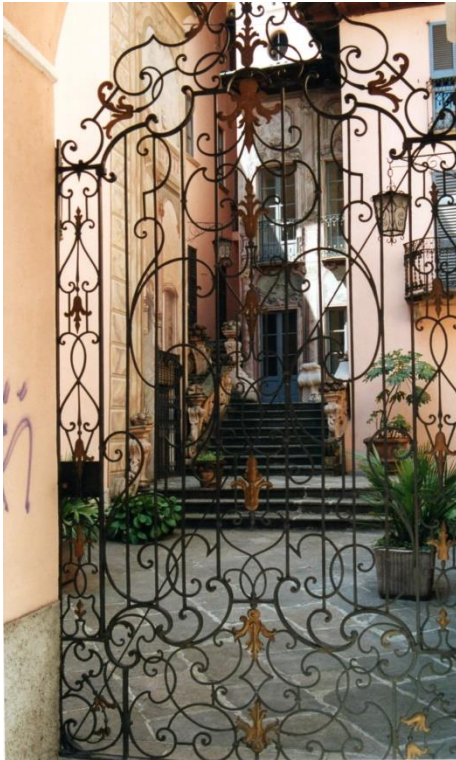
Via Sabati palazzo Giulini 18 e eeuw

van de Umiliati. Deze orde wordt al vermeld in een document uit 1243 en bleef tot 1775 in Gravedona. Ze was zeer bekend door de vervaardiging van ruwe wollen kleding, vooral voor de bewoners van de bergdorpen.