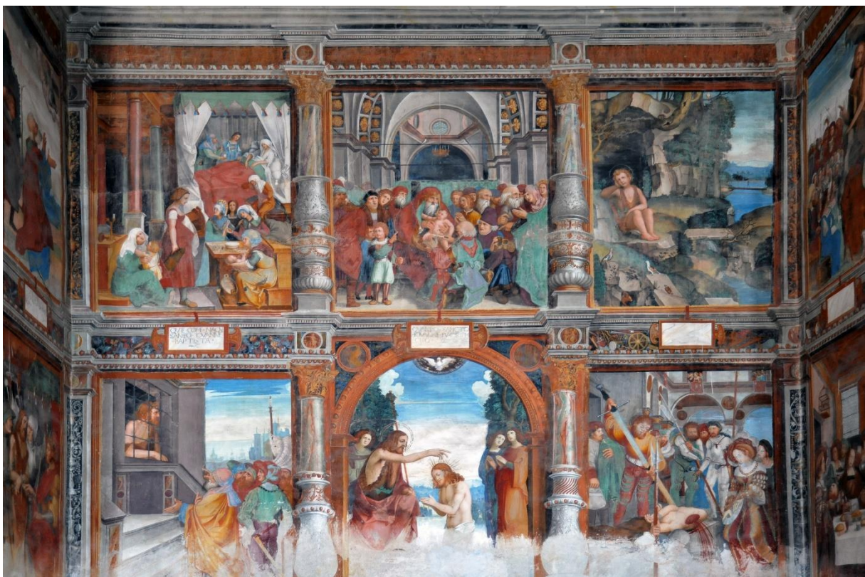
Het leven van Johannes de Doper

Op de pijler links van het priesterkoor is een Kruisiging * uit 1519 te zien. In de kerkvloer vinden we diverse grafstenen van belangrijke families in Gravedona, die ook de decoraties in de kerk financierden, o.a. de Curti, Stampa en Justoni.