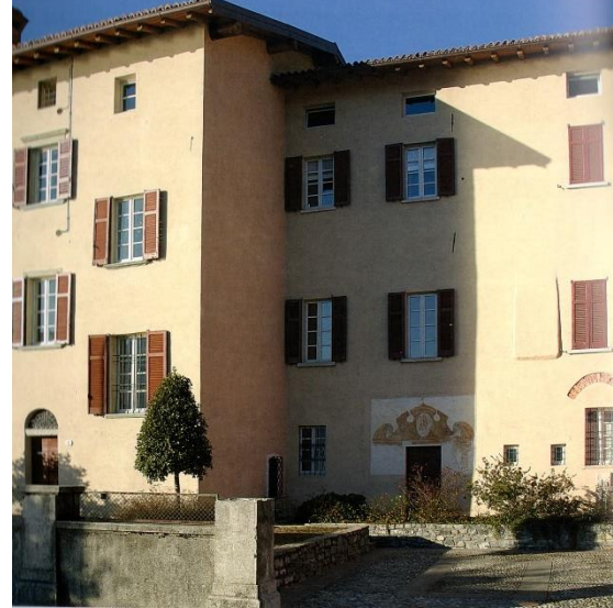
Parochiehuis, ex-palazzo Cazzola, 15 e eeuw

De straat uitlopend komen we op het Piazza Motta. De naam van dit plein komt van “el mot”, dat in het dialect een verhoogde plaats aanduidt. Op deze plaats werd namelijk het vee bijeengebracht dat tijdens een belegering van het kasteel als voedsel voor de bevolking moest dienen. Aansluitend op het plein komen we in de Via Volta. We zien aan de linkerkant een gedenksteen ingemetseld in de gevel van het huis dat de beroemde fysicus Alexander Volta erfde van de familie Stampa. Hij bracht hier zijn huwelijksreis door, woonde er in de zomermaanden en voerde er zijn eerste experimenten uit die leidden tot de naar hem genoemde batterij.