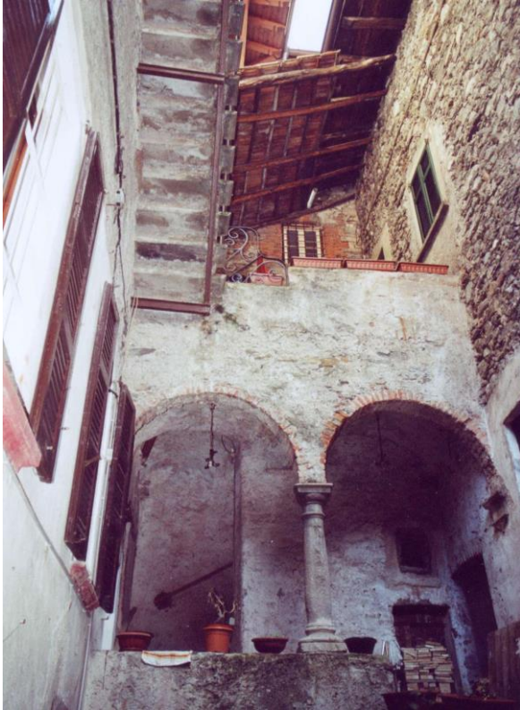
Binnenhof met loggia's aan de via Peter