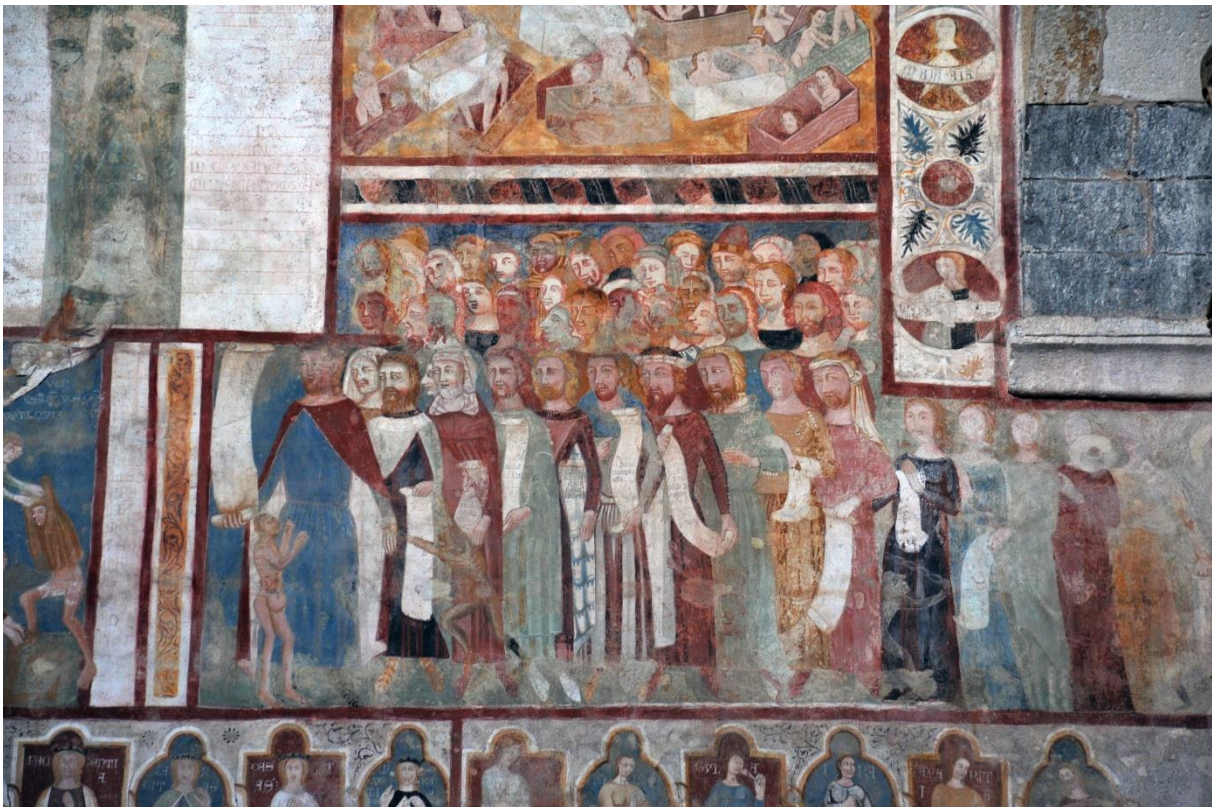
Het laatste oordeel, fresco in de Santa Maria del Tiglio