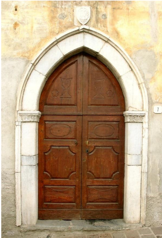
Links: Via Dosi e Segna nr.4, 15 e -eeuws portaal

We volgen deze maar kort want het drukke verkeer op dit smalle stuk veraangenaamt ons verblijf niet. Er zijn echter in dit deel van de vroegere via Regina meerdere oude huizen. Achtereenvolgens noem ik de huisnummers 1, het palazzo Scotti met mooie smeedijzeren balkons, en op nummers 3 en 5 het palazzo Curti Maghini met het wapen van de familie boven de ingang. De Curti behoorden tot de belangrijkste families in Gravedona in de hele zestiende en zeventiende eeuw. Het wapen toont een klimmende leeuw en een kasteel met twee torens onder een gekroonde adelaar. Tegenover het palazzo Scotti ligt het gemeentehuis.