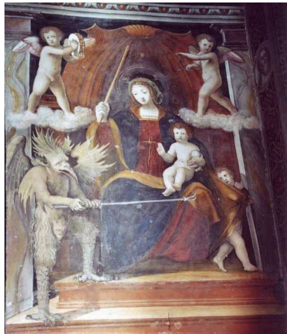
De Madonna met het duiveltje