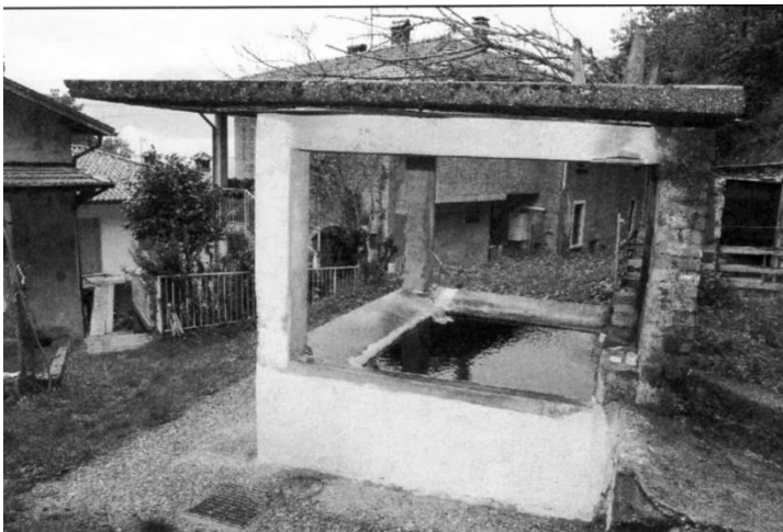
De lavatoio in Segna

Neem vanaf de provinciale weg de via Dosi e Segna omhoog tot een splitsing waar een bord staat met opschrift “Sentiero del Gubileo 2000/via Pessina”. (Als u hier linksaf slaat komt u bij de kerk Santa Maria delle Grazie). Voor onze wandeling nemen we de via Pessina en nemen dan bij de volgende splitsing het oude voetpad richting Segna. Na de eerste bocht buigt het pad onder de weg door die van Gravedona naar Peglio en Dosso del Liro loopt. Blijf het pad dat steil omhoog gaat volgen en ga voor de tweede keer onder de straatweg naar Peglio door en kort daarna onder de leiding van de waterkrachtcentrale. Aan het eind van de klim slaan we af naar rechts en komen nu langs de huizen van het gehucht San Carlo, waar we kort na een kapelletje over wat trappen de asfaltweg bereiken, waar we naar rechts gaan. Volg de weg en na een paar bochten komen we in Segna (390 m) 2 . De klim eindigt naast het kerkje van San Lorenzo met een mooi fresco in de apsis. We volgen de weg door Segna tot de laatste huizen en een lavatoio (wasplaats).