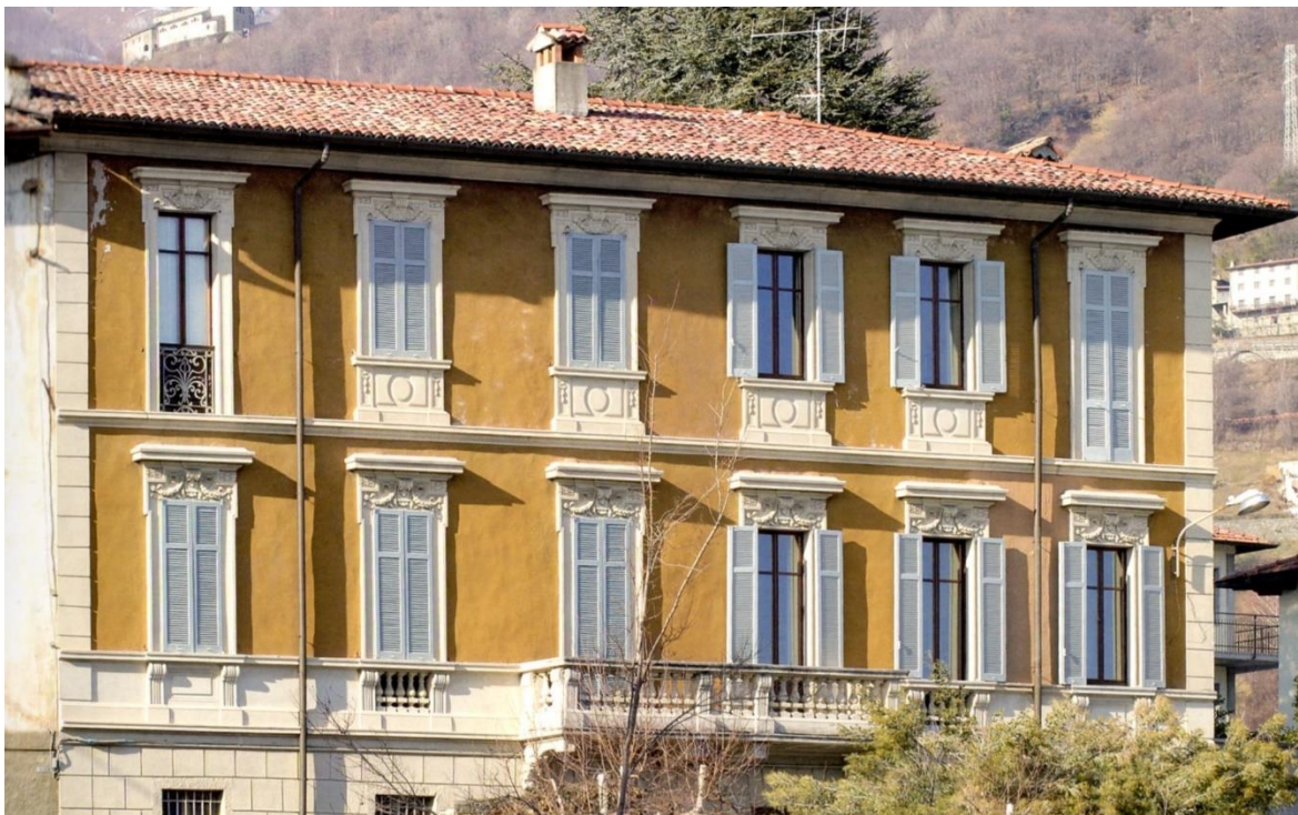
Casa Bellati in via Suanappa