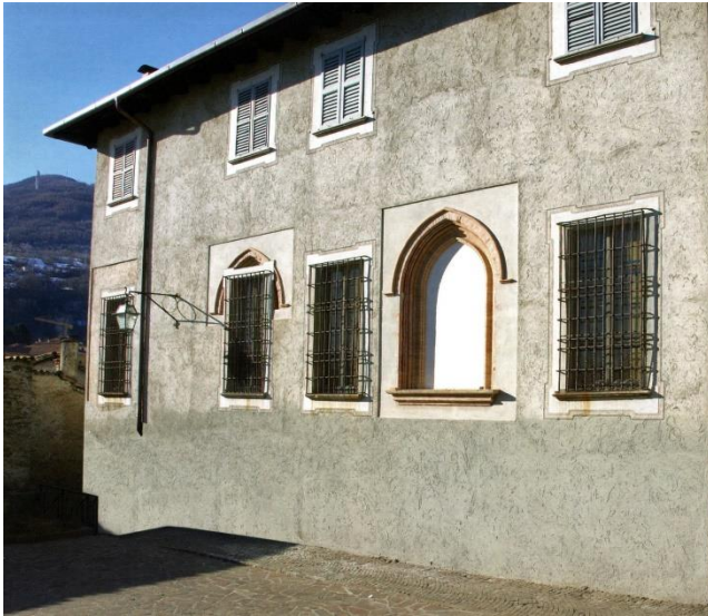
Palazzo Zanuso op Pra'Castello

zilverwerk bewaard gebleven in diverse kerken langs het meer. Zo maakte hij in 1508 een processiekruis van zilver, goud en edelstenen voor de parochiekerk van S. Vincenzo in Gravedona. Helaas werd het in 1920, tegelijk met een zilveren schaal van dezelfde maker, gestolen en in 1928 vervangen door een getrouwe kopie, die nu achter slot en grendel wordt bewaard. Ook in de kerken van Pianello en Dongo vinden we processiekruizen van zijn hand.