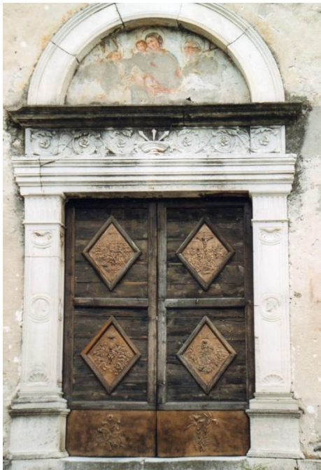
Deurportaal S. Maria delle Grazie

De kerk heeft een prachtig deurportaal in wit marmer met daarboven een lunet in fresco