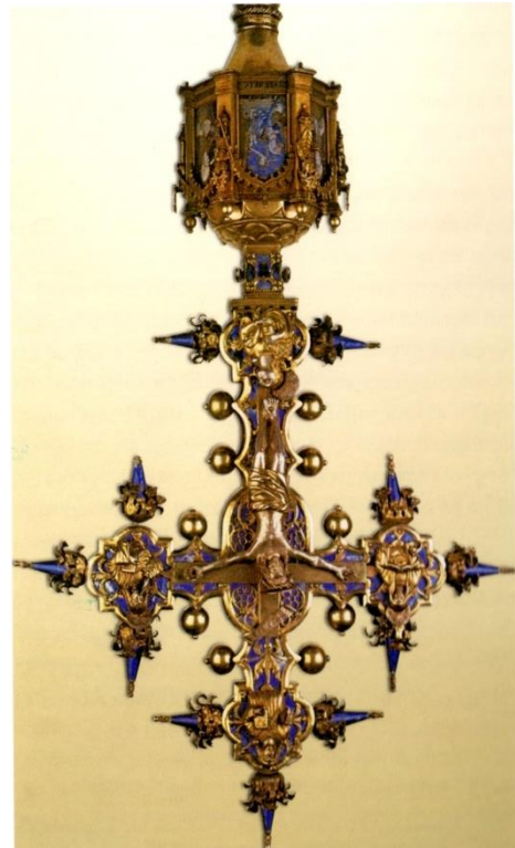
Rechts: Processiekruis van Ser Gregori

Tussen de via Vittorio Veneto en piazza Motta en San Rocco ligt op nummer 8 het vroegere Casa Stampa. Het huis heeft nog vijf van de oorspronkelijk zes vensters, uitgevoerd met spitsbogen die aan de 15 e eeuw doen denken. Er was ook nog een tak van de familie Stampa die in de 17 e eeuw op nummer 19 van de via Carate woonde.