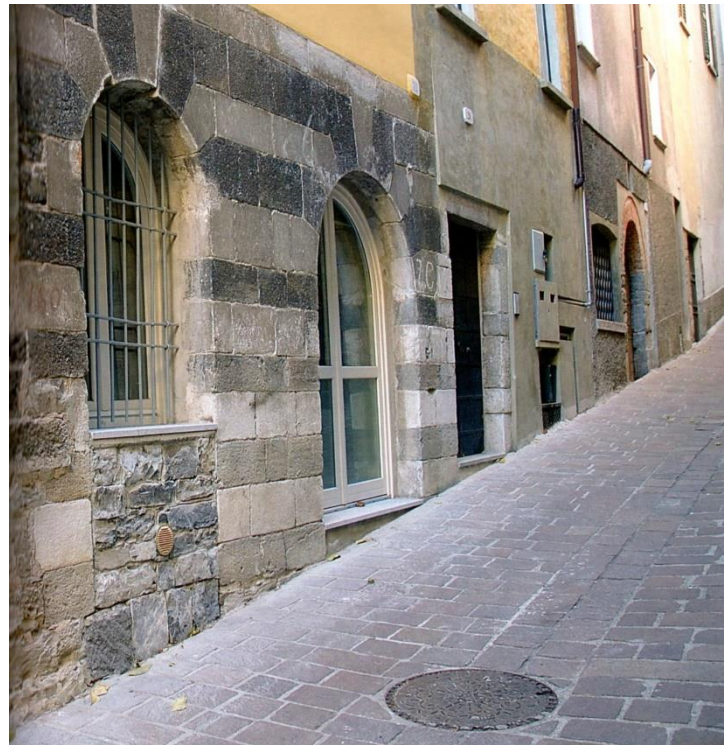
Via Sale met 13 e -eeuws huis

We keren terug naar de via Sabbati en vervolgen de weg naar Piazza Cavour, genoemd naar de Turijnse diplomaat die zo'n grote rol speelde bij de éénwording van Italië. Tijdens de wandeling passeren we op vele plaatsen oude huizen met mooie deurportalen.