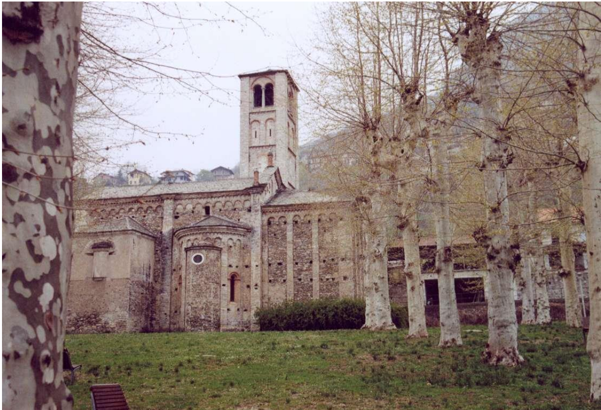
Kerk van SS. Gusmeo en Matteo

De twee schutpatronen van Gravedona worden nog ieder jaar op 11 september herdacht.