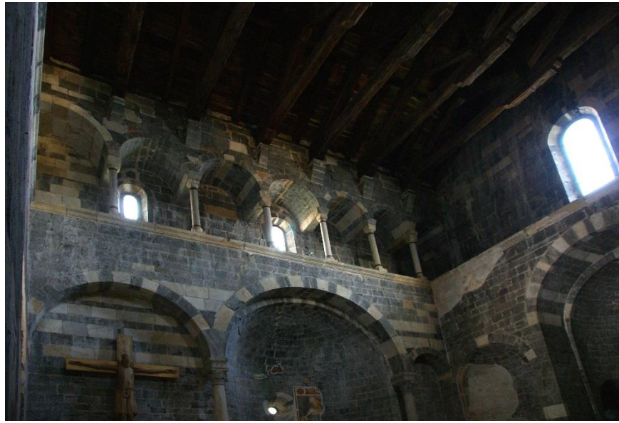
Kerk van S. Maria del Tiglio