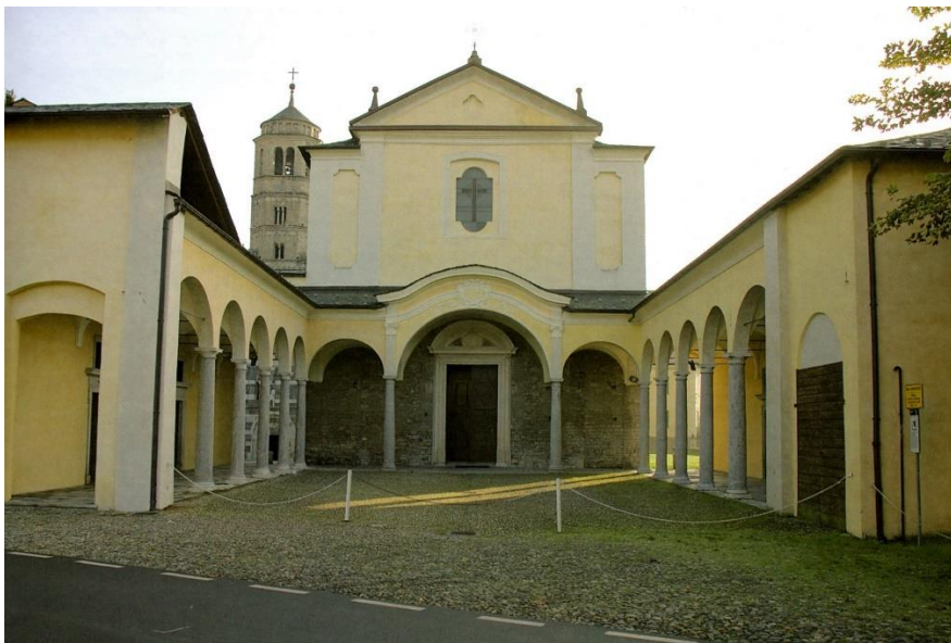
Voorgevel en portico SVincenzo

Van de oorspronkelijke complexe muurdecoraties zijn slechts enkele resten zichtbaar, ze dateren uit de eerste helft van de 14 e eeuw. Een voorbeeld hiervan is een deel van het Laatste oordeel op de achterwand. In de apsis aan de noordkant zijn er decoraties uit de 15 e eeuw, waaronder delen van een cyclus van Johannes de Doper en de Drie Koningen bij het priesterkoor en de Kruisiging in de zuidelijke apsis. Een fresco met de Maagd tussen S. Nicola, een opdrachtgever en een andere heilige dateert uit de tweede helft van de 15 e eeuw. In het priesterkoor domineert het fresco van de Aanbidding van de koningen , dat herinnert aan een legende uit 823, die verhaalt dat hier oorspronkelijk een fresco was met hetzelfde onderwerp en dat licht uitstraalde. Uit de 14 e eeuw is ook de afbeelding van S. Stefano op de zuil in de centrale apsis, waaronder waarschijnlijk nog oudere fresco's zijn verborgen. In het priesterkoor is ook een zeer kostbaar houten Kruisbeeld ** uit de 12 e eeuw te bewonderen. Aan de buitenkant van de kerk is in de lunet van het zijportaal een elegante Pietà geschilderd.