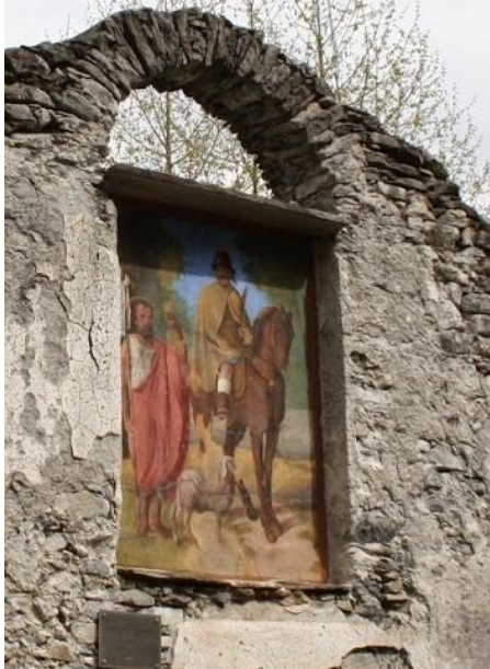
Fresco op het kerkje van S. Giovanni all'Archetto

Meteen na de brug is links de afslag naar Casenda waar de wandelroute naar het kerkje S. Fedelino begint (Zie voor een beschrijving van deze wandeling mijn Nieuwsbrief 2021-4). Helemaal aan het begin van deze wandelroute ligt de ruïne van het kerkje van S. Giovanni all'Archetto.