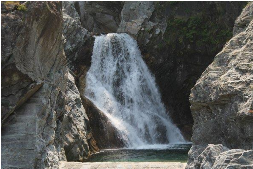
De Cascata della Boggia

Ook interessant bij Gordona is de waterval in de Boggia, op een richtingwijzer is aangegeven in bruine letters: met "Cascata della Boggia". Iets verderop is de waterkrachtcentrale "Centralino dell'Edipower", die in 1927 werd aangelegd en toen als de grootste in heel Europa gold.