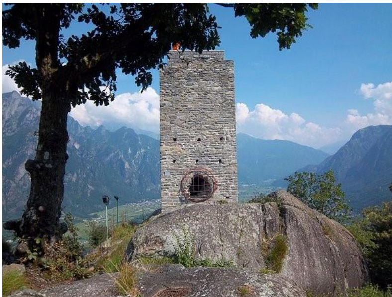
Torre di Segname

naar Gordona. Op deze route zien we links boven ons de op 655 m hoogte gelegen Torre di Segname , één van de laatst bewaard gebleven signaaltorens van het Valchiavenna. De toren, die 's avonds verlicht wordt, is vanuit het dal zichtbaar. Het is mogelijk de toren te bezichtigen; de sleutel van het hek is verkrijgbaar bij het gemeentehuis van Gordona.