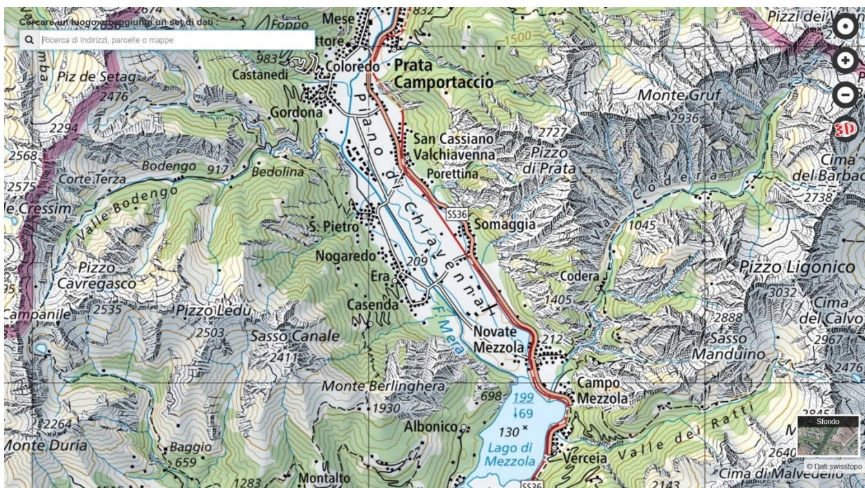
Wandelkaart van het Piano di Chiavenna met de belangrijkste valleien

Na de tunnel komen we direct in het dorp Verceia. Het ligt aan het begin van de vallei van de Ratti met de gelijknamige rivier. Vanuit het dorp loopt een voetpad, het 'sentiero Italia', steil omhoog. Na circa twee uur bereikt u, op 1287 m hoogte, een groep niet meer bewoonde huizen van Frasnedo. Bij het dorp ligt het kerkje Madonna della Neve en in de zomermaanden is de Rifugio Frasnedo geopend. Voor de echte bergwandlaars/klimmers zijn er talloze paden beschikbaar. Over de Passo di Primalpia (2476 m) is zelfs de Costa dei Cech bereikbaar.