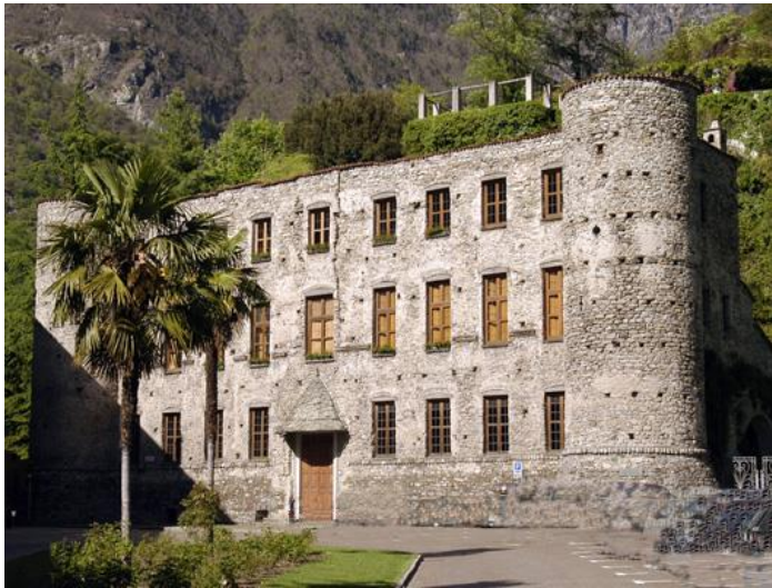
Palazzo Balbiani in Chiavenna

Vanaf het moment waarop Chiavenna de overheersing door de Visconti's erkende, nam de handelsactiviteit sterk toe, hoewel er ook nu niet altijd rust heerste. Zo werd de stad in 1486 door de Grigioni in brand gestoken. Een verbetering trad op toen eind 1500 Ludovico il Moro een muur rond de stad liet bouwen. Overigens moesten de kosten daarvan door de gemeente zelf worden opgebracht. In de eerste decennia van 1500 werd het historisch centrum van Chiavenna gebouwd, zoals we dat nu nog kennen. Men bouwde huizen langs de Mera, tegen de stadsmuur; langs de handelsstraten kwamen de typische huizen van de kooplieden, met winkels en magazijnen op de begane grond en de woning daarboven. In de wijk van de ambachtslieden bewerkte men de pietra ollare en waren er langs de Mera molens en leerlooierijen. Het stadsdeel buiten de muren, Oltremera, ontwikkelde zich al in de 15 e eeuw, toen er herbergen, stallen en magazijnen werden gebouwd.