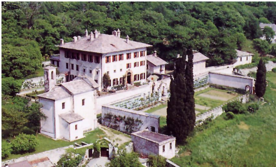
Het palazzo Vertemate

Het palazzo is één van de meest prestigieuze 16 e -eeuwse herenhuizen uit de streek. Het gehele landgoed is omringd door een muur en na aanbellen worden we toegelaten via een poort. Naast het palazzo zien we een kerkje gewijd aan de Heilige Gekroonde Maria met in het priesterkoor de familiegraven. Dat de familie in hoog aanzien stond, wordt ook duidelijk uit het feit dat de wijding van de kerk op 3 juli 1690 werd verricht door kardinaal Carlo Ciceri. Vanaf het voorportaal van de kerk loopt een weg die het landgoed verdeelt in twee delen. Rechts vinden we een bloemen- en moestuin en een grote wijngaard. Links ligt het palazzo met bijgebouwen, waarin een oude wijnpers en een ijskelder en achter het palazzo is een Italiaanse tuin met een grote visvijver en boomgaard.