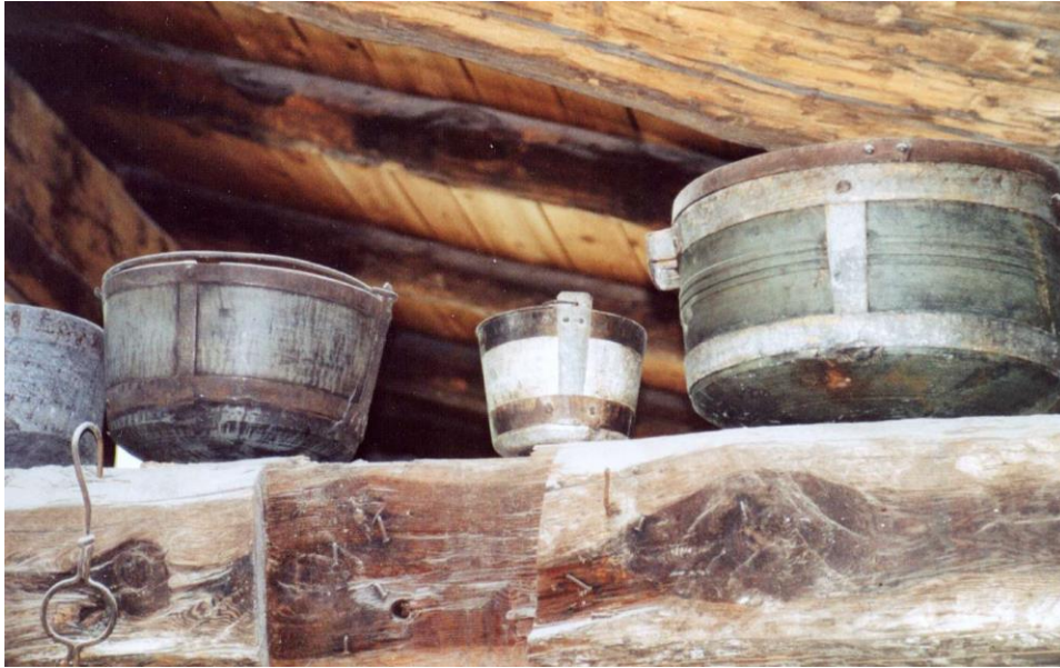
Kookpotten gemaakt van pietra ollare

vrijblijvend, Lucchinetti zal u graag rondleiden en U kunt er ook aardig bewerkte potjes en wandversieringen kopen.