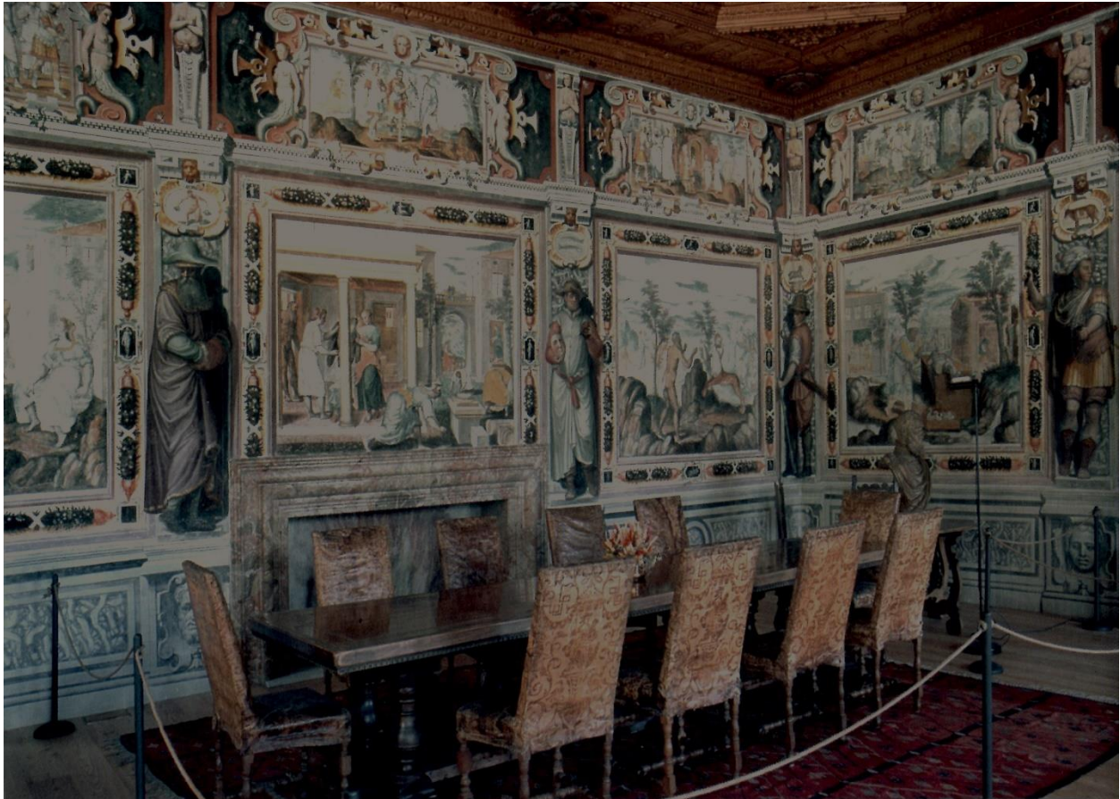
Stijlkamer in palazzo Vertemate Franchi

Helaas is van het oorspronkelijke meubilair weinig behouden. Eind 1800 werd het palazzo verwaarloosd en is er veel van de inventaris verkocht, maar de laatste eigenaars hebben veel gedaan om alles te herstellen. Een bezoek aan het palazzo is dan ook zeer de moeite waard # .