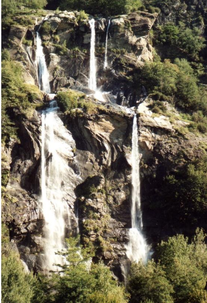
De watervallen van de Acquafraggia

beklimmen, bereikt u Savogno op 932 m hoogte, met het kerkje van S. Bernardino uit 1465. Hier heeft men een schitterend panorama. De klokkentoren uit 1485 is een van de weinigen in het Valchiavenna waarvan de oorspronkelijke structuur bewaard is gebleven. Aan de voet van de kerk het parochiehuis met 16 e -eeuwse bogen en vele rustieke huizen met houten balkons.